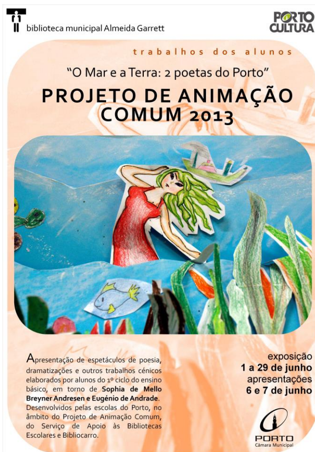
Figura 7 - Cartaz PAC 2013