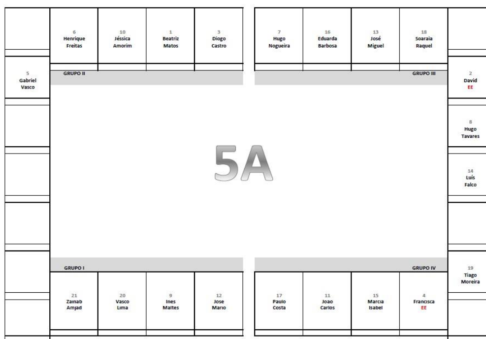
Figura 9 - Planta da Sala - 5º A

que poderiam ser aplicados na prática relativos à música contemporânea e à música portuguesa nas áreas de composição, audição e interpretação.