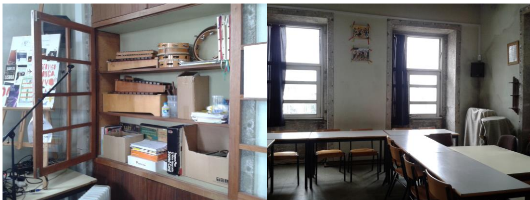
Figura 4 - Sala de Música

Para além destas duas salas existe uma arrecadação na Sala Museu onde estão guardados alguns instrumentos. Na biblioteca da escola podemos encontrar alguns manuais de Educação Musical / Música e CD's variados.