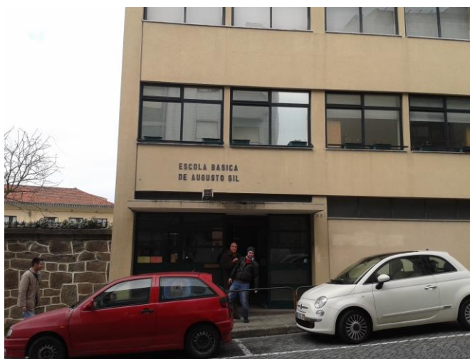
Figura 3 - Escola Básica Augusto Gil

As Práticas Educativas II e III realizaram-se na Escola Básica Augusto Gil (Fig. 3) pertencente ao Agrupamento de Escolas Aurélia de Sousa, criado a 4 de Julho de 2012. Na escola existem duas salas destinadas às aulas de Educação Musical / Música (Fig. 4) que, apesar de pequenas, estão bem equipadas com piano digital, computador (com acesso à internet), aparelhagem com colunas, projetor, quadro branco com pautas, diversos instrumentos Orff e livros (manuais de educação musical, livros de canções temáticas).