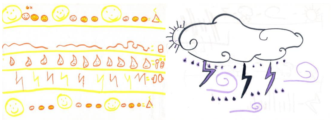
Figura 5 - Partituras não convencionais feitas pelos alunos

Em todas as aulas começávamos por fazer um aquecimento corporal e vocal, caso a atividade o exigisse. Logo nas primeiras aulas decidi começar com a experimentação e composição, porque na aula de apresentação percebi que os alunos estavam bastante à vontade com a música e captavam facilmente as melodias e as letras das canções. Optei por selecionar um texto bastante descritivo “Uma Trovoada” (Mota & Leite, 1987) onde os alunos identificavam personagens e associavam a sons de instrumentos que tinham disponíveis na sala de aula. Após exploração sonora criaram uma sequência de sons associada ao movimento corporal. Depois de todo este processo fizemos gravação para avaliação e aperfeiçoamento e terminamos com a criação de uma partitura não convencional (Fig. 5).