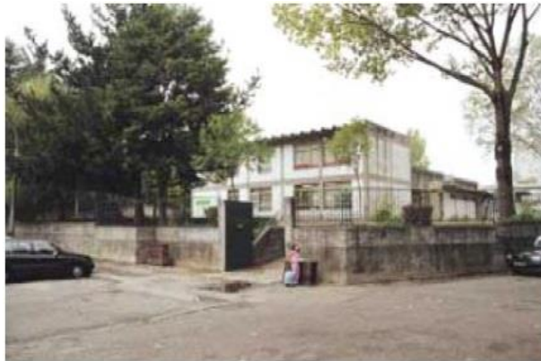
Figura 1 -Escola EB1/JI de S. Tomé

A minha Prática Educativa I realizou-se na Escola EB1/JI de S. Tomé (Fig. 1). Situada na Freguesia de Paranhos, encontra-se em bom estado de conservação devido às obras realizadas em 2009. A instituição tem espaços amplos e salas para cada turma com os recursos necessários para o bom funcionamento das aulas. A escola lida com projetos anuais dinamizados pelo Serviço de Apoio às Bibliotecas Escolares da Biblioteca Municipal Almeida Garrett. O contacto com a música é muito regular. Em simultâneo com a nossa prática os alunos continuavam a ter aulas de Educação Musical com o professor das AEC. Na escolha do local onde decorreriam as aulas de música, optamos pela sala de informática (Fig. 2). A sala era bastante ampla e como raramente era usada facilitava a preparação dos materiais antes de a turma chegar.