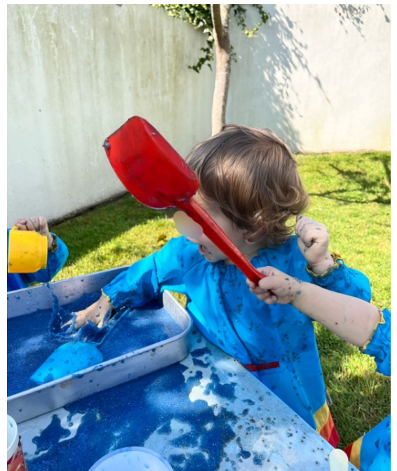
Figura 4- Nível elevado de bem-estar na exploração sensorial do slime

De seguida, será explanado a quarta ação desenvolvida de forma a promover a exploração sensorial que consistiu em luvas congeladas com pompons no seu interior. Primeiramente surgiu-lhes o desafio de rasgar as luvas (Apên B1.2.4: Img 1), a seguir foram confrontados com a temperatura das mãos geladas e, posteriormente, ao observarem os pompons presos dentro do gelo ficaram intrigados com a forma de os conseguirem tirar de lá. De seguida, as crianças contaram com a ajuda do sol que começou a derreter algum gelo, facilitando, assim, os pompons