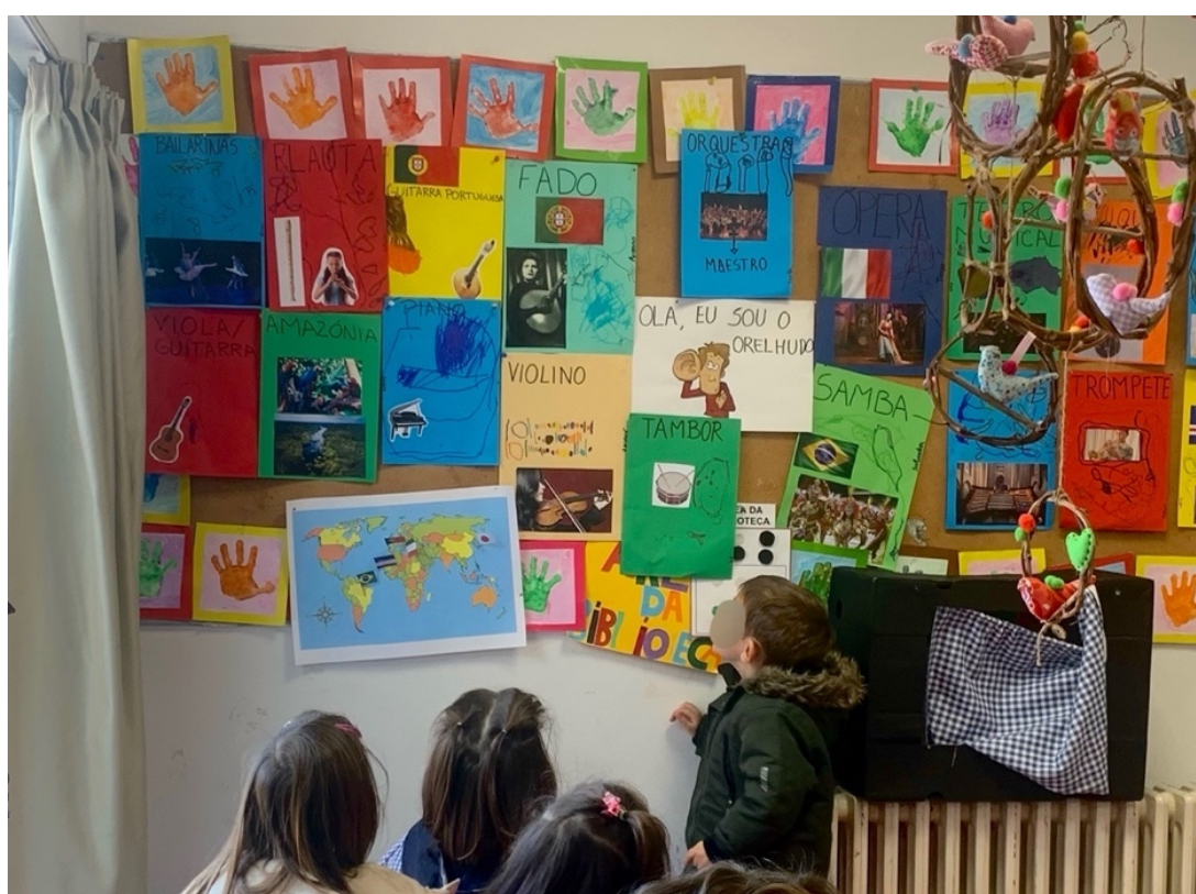
Figura 7- Recurso por parte do grupo ao painel do orelhudo para auxiliar na descodificação dos instrumentos ouvidos

Dado este ter sido um processo gradual, no início havia crianças que não apresentavam níveis de envolvimento elevados e nem tão pouco de bem-estar quando estavam presentes no pequeno grupo a ouvir o “Orelhudo”, o que era respeitado. No entanto, com os recursos visuais a crescerem na área da biblioteca e a existir uma dinâmica incentivadora quanto à partilha de saberes por parte das crianças, todo o grupo ficou envolvido no projeto. A educadora cooperante encontra-se a dar continuidade ao projeto, após o términus do estágio, não só por perceber as suas vantagens, mas também pelo constante interesse manifestado pelo grupo (Fig. 7). Assim, no culminar do percurso da PES II foram registados níveis altíssimos de bem-estar e envolvimento tendo por base as escalas da Laevers et al. (2005), tal como alguns exemplos supramencionados o comprovam.