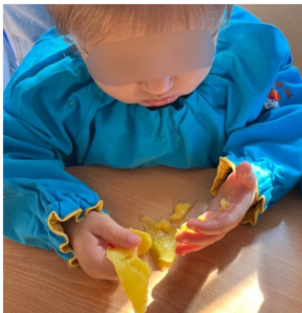
Figura 2- Exploração da textura do interior da manga

O segundo momento a ser mencionado refere-se a uma atividade em que foi proporcionado um ambiente com luz negra, dado que os jogos de luz e de sombras “seduzem e convidam a criança a interagir, brincar e fantasiar” (Lino, 2018, p. 99) e esta presença da arte