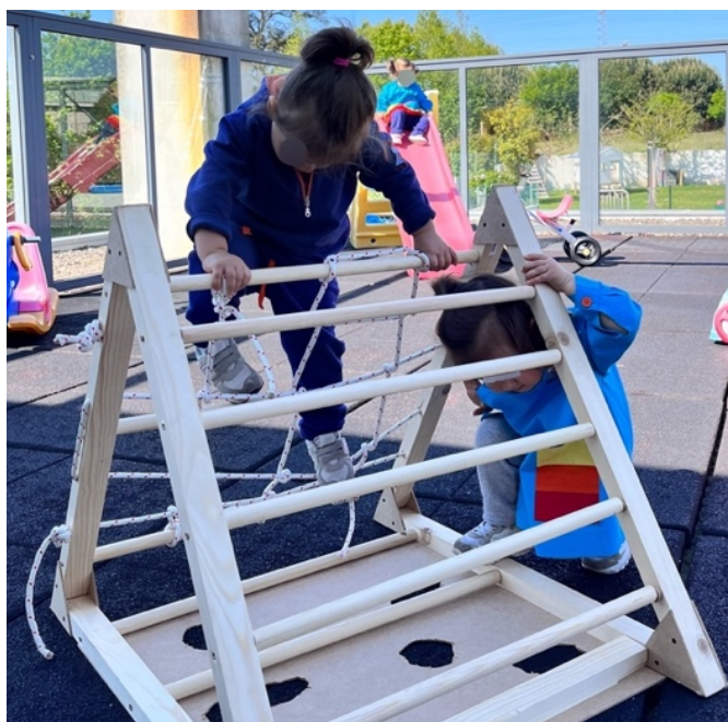
Figura 1- 1.ª momento de exploração do triângulo

pequenos grupos, e uma vez que o resultado não ter sido o esperado, pois as crianças brincavam livremente com os restantes brinquedos e não com o Triângulo, reuniram-se as restantes crianças para todas poderem desfrutar do momento em conjunto. A partir do observado no momento da atividade, a mestranda refletiu na ação e assumir que a decisão pedagógica teria sido mal calculada, dado as crianças não se terem envolvido da forma como se estaria à espera. Posteriormente, em momento de reflexão sobre a ação, constatou-se que ao ter sido proporcionado este primeiro contacto com diversas ‘distrações’, as crianças só se aproximavam e exploravam o Triângulo quando realmente nele estavam, efetivamente, interessadas, consubstanciando-se, assim, numa exploração mais significativa (Fig. 1; Apên B1.1: Img 1 a 4).