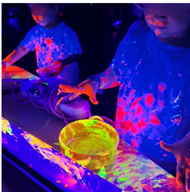
Figura 3- Exploração das diferentes perspectivas da cor: causa e efeito

manifestou-se como um estímulo ao proporcionar novos e diferentes contextos para as crianças explorarem interpretações não convencionais da realidade (Vecchi, 2010). Deste modo, as crianças puderam pintar estrelas em cartolina branca, referentes à hora do conto anterior que foi proporcionada em jogo de sombras (que será mencionada no ponto 3.3.1), assim como também pintaram as suas t-shirts , as cartolinas pretas, que foram colocadas no espelho, o chão, as paredes, os cabelos, a cara, os braços, as pernas, os outros amigos, em completa liberdade que lhes permitiu explorar as diferentes perspectivas de cor da tinta onde quisessem, indo ao encontro da decisão pedagógica tomada pela mestranda cujo objetivo era que a exploração fosse realizada com todas as partes do seu corpo, uma vez que este envolvimento com formas de arte diversificadas “promove o desenvolvimento da capacidade de interpretação e representação das ideias e pensamentos, da imaginação e criatividade” (Lino, 2018, p. 100). Assim, quando as crianças se aperceberam de que a sua roupa, os seus dentes e as tintas brilhavam no escuro, ficaram profundamente entusiasmadas e, de imediato, demonstraram prazer em explorar e em utilizar diferentes formas de se envolverem com os reflexos, o que comprovou o adequado papel do educador dado que lhe cabe “alargar as experiências [das crianças], de modo a desenvolverem a sua imaginação e as possibilidades de criação” (Silva et al., 2016, p. 49) (Fig. 13 e 14; cf. Apêndice B1.2.2).