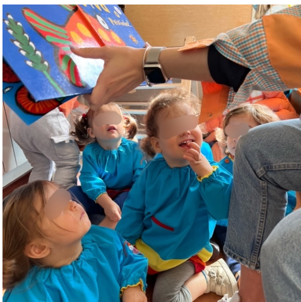
Figura 8- Nível elevado de bem-estar nos momentos de transição com recurso ao livros

Face ao descrito, considera-se que a promoção dos momentos de leitura teve um impacto bastante positivo, uma vez que o contacto das crianças com os livros melhorou substancialmente o que possibilitará que, no futuro, se possam tornar pequenos grandes leitores e contribuirão, fortemente, para que os momentos de transição se tornassem mais suaves, tal como comprovado na Figura 8 e nas imagens 8 a 10 do apêndice B1.3.