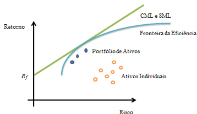
Gráfico 3: CML e SML

desempenho das carteiras. No entanto, Sharpe (1964) utiliza como medida de risco o risco total, usando como padrão de comparação a Capital Market Line (CML). O primeiro caso relaciona a rentabilidade em excesso (relativamente à taxa isenta de risco) por unidade de risco sistemático e tem em consideração os títulos. E a segunda mostra a rentabilidade em excesso por unidade de risco total e tem em consideração o mercado. Tanto uma como outra são medidas de desempenho relativas, pois requerem o cálculo de um rácio semelhante.