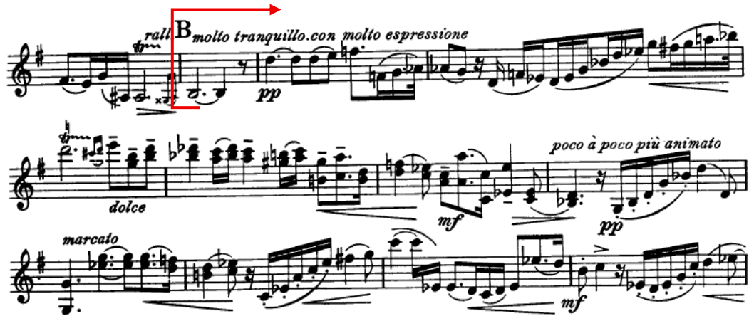
Figura 3 - Progressão e densificação do conteúdo motivico

esticadas ao limite, com um vibrato amplo e som cheio, criando uma tensão continuamente adensada. A progressão constrói-se de forma lenta, sobretudo a partir da secção B (Figura 3), onde as cordas dobradas sustentadas se intercalam com semicolcheias curtas que mantêm a direção da frase, seguindo as indicações poco a poco più animato e agitato . O clímax absoluto surge na secção D com o violino a atingir um dos registos mais agudos do andamento seguido de uma súbita descida vertiginosa (de Si 6 a Sol 2) (Figura 4), gesto dramático que marca toda a sonata. Daí até ao final, a música esbate-se gradualmente, numa dissolução progressiva de intensidade e densidade, terminando sob a indicação morendo . Segundo Yu-Hsien (2005), esta escrita aproxima-se da estética wagneriana da “melodia infinita” evitando cadências conclusivas e prolongando a tensão até à transfiguração final, em modo maior, que sugere uma dimensão espiritual de superação da dor.