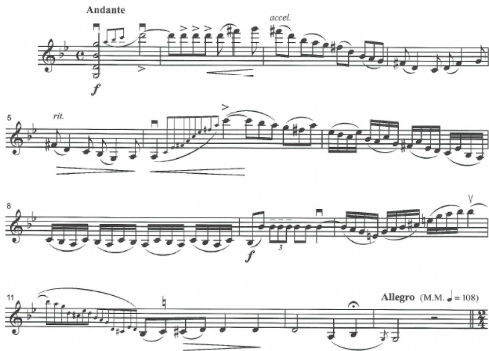
Figura 5 - Introdução de carácter cadencial (c. 1-12)