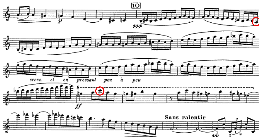
Figura 14 - Progressão motívica que explora o âmbito melódico do violino

A transição para o quarto andamento é feita sem interrupção, criando uma continuidade formal surpreendente: a aparente estagnação do Assez lent dissolve-se diretamente na energia do Final très vite . Este gesto reafirma a estratégia da compositora de jogar com contrastes e deslocamentos, recusando a lógica de separação nítida entre os andamentos: a passagem discreta, mas expressivamente eficaz (ex.: N° 11-12, Figura 15).