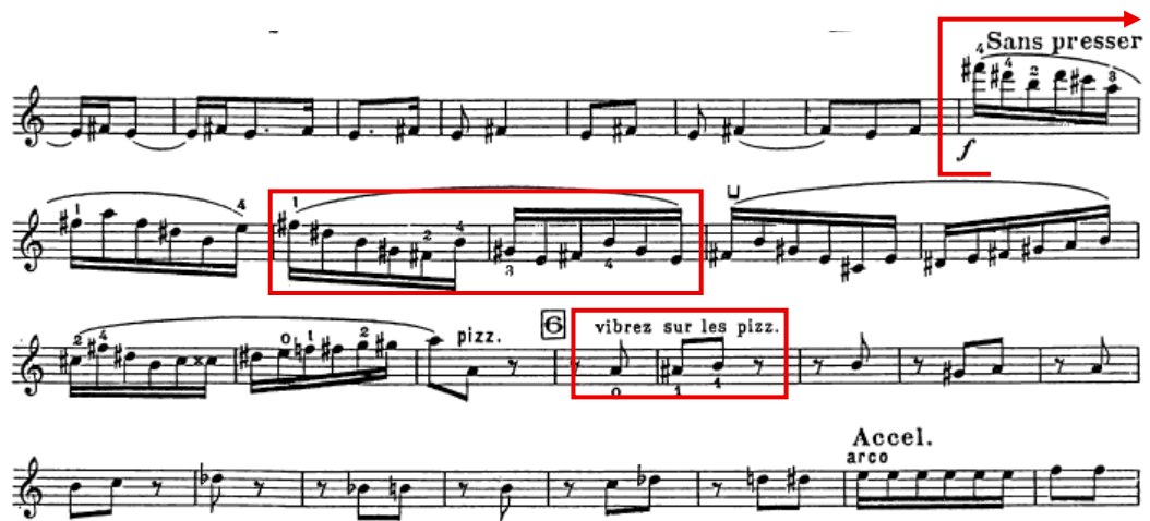
Figura 13 - Alternância entre movimentos ondulatórios e pizzicatos

Do ponto de vista tímbrico, destaca-se o uso da surdina no violino durante todo o andamento, o que confere uma coloração tímbrica particular, quase espectral. O violino alterna entre secções em pizzicato (que dialogam incisivamente com o piano) e passagens em ligaduras, retomando o movimento ondular do primeiro andamento, mas agora com um registo mais lúdico e fragmentado (ex.: Sans Presser até N° 6, Figura 13). Este jogo entre contrastes de articulação e o permanente deslocamento métrico reforça a sensação de instabilidade que a obra transmite no seu conjunto.