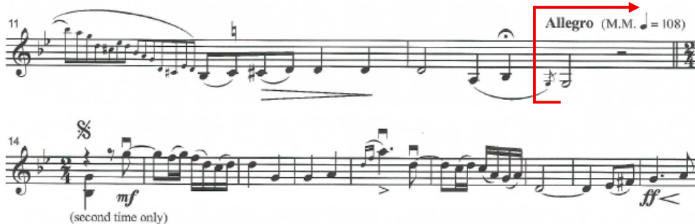
Figura 6 - Transição para o 1º Tema (c. 13-22)

Entre os compassos 14 e 56 (Figura 7), a peça assume um estilo dançante e vivo, intercalado por uma breve secção lenta que funciona como ponte direcional até ao desfecho dessa parte. A primeira grande rutura estética surge na transição para Si maior (c. 38–60, Figura 7), marcada por escalas interrompidas ( gapped scales ) (Figura 7) e uma textura de acompanhamento em acordes arpejados, evocando de forma mais explícita tradições da música negra norte-americana. O contraste ganha corpo com a introdução da secção Andante , em Si bemol maior (c. 61–88, Figura 7), que se assume como o núcleo mais expressivo da Fantasia. Esta secção é construída a partir de uma melodia simples que, na sua repetição, se torna progressivamente mais densa através do uso de cordas dobradas, enquanto o piano oferece um acompanhamento discreto. O lirismo expansivo deste tema – descrito por Cooper (2019, p. ii) como “esquisitamente belo” – estabelece uma zona tonal luminosa que dialoga com a