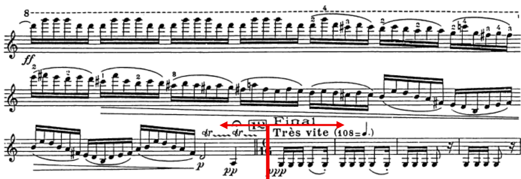
Figura 15 - Transição entre 3° e 4° andamentos

A transição para o quarto andamento é feita sem interrupção, criando uma continuidade formal surpreendente: a aparente estagnação do Assez lent dissolve-se diretamente na energia do Final très vite . Este gesto reafirma a estratégia da compositora de jogar com contrastes e deslocamentos, recusando a lógica de separação nítida entre os andamentos: a passagem discreta, mas expressivamente eficaz (ex.: N° 11-12, Figura 15).