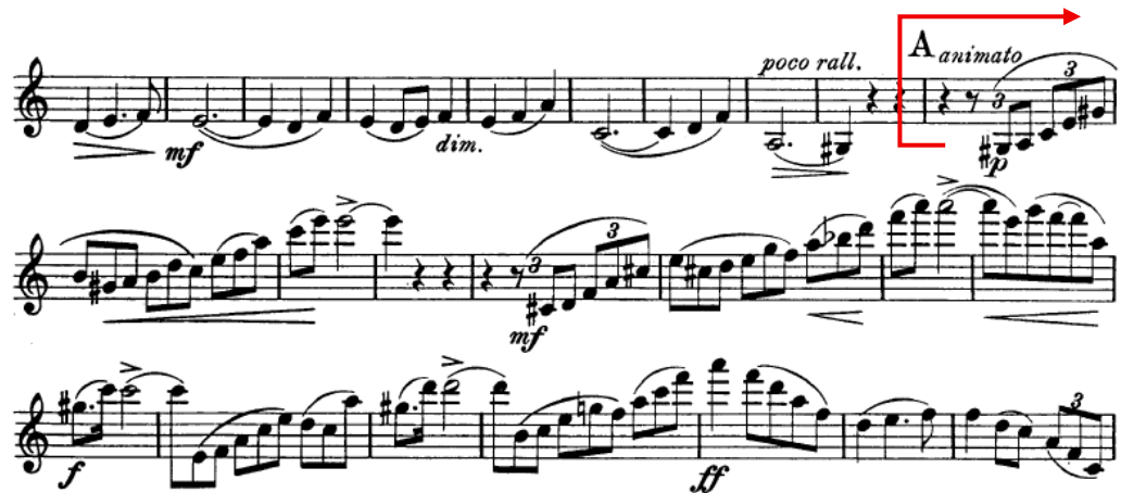
Figura 1 - Construção motivica de arpejos desconstruídos