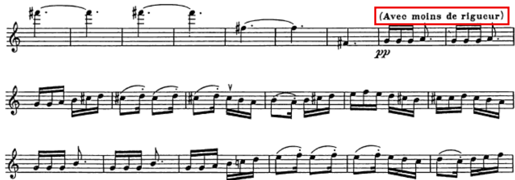
Figura 16 - Motivo metricamente instável do andamento

expressiva, libertando toda a tensão latente da sonata. Este desfecho reafirma a “clareza e espírito lúdico” descritos por Restle (2024), mas também o que Fulcher (2005) entende como gesto de resistência: a ironia e a leveza transformam-se aqui em afirmação jubilatória e desafiadora.