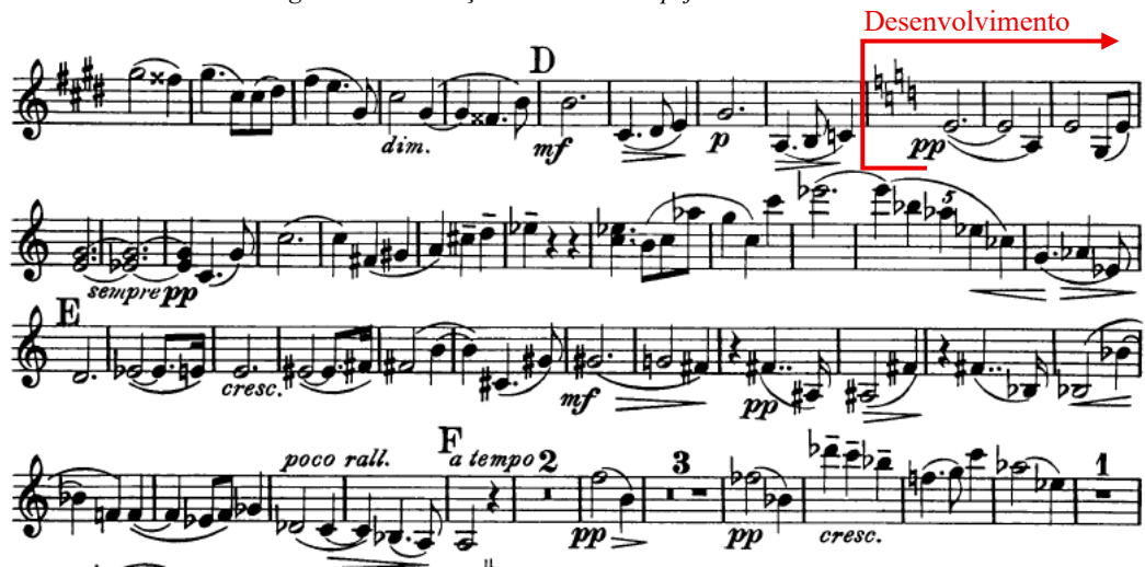
Figura 2 - Início da secção de Desenvolvimento marcado por modulações que desestabilizam o centro tonal de Lá menor.

O segundo andamento, é um Scherzo em Molto vivace , onde predomina um ritmo saltitante, e um espírito vivo e jocoso que contrasta radicalmente com a seriedade expressiva do primeiro andamento. O violino e o piano dialogam em imitações ágeis, explorando articulações variadas que conferem leveza e direção, aproximando a escrita da ironia camerística de Brahms ou do brilho dançante de Dvořák. A meio do andamento, surge um momento de suspensão calma, quase etérea, que prepara, após um grande accelerando , o regresso jubilatório ao tema do Scherzo . O Trio , em Sol menor (o modo menor da tonalidade do Scherzo ), introduz breves inflexões modais e pentatónicas, evocando discretamente o folclore sem citações literais. A Coda fecha o andamento com humor: um trilo agudo no violino e acordes secos no piano, em contratempo, desdramatizam o discurso e consolidam a dimensão lúdica.