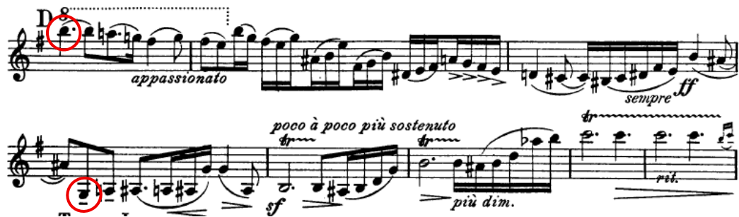
Figura 4 - Descida súbita (Si 6 a Sol 2) e ponto climático do andamento

O último andamento, Allegro con fuoco , retoma o ímpeto do Scherzo com uma escrita veloz e frases intensamente direcionadas que geram movimento constante. A compositora alterna secções de marcado impulso rítmico com passagens più tranquillo , mas esses breves momentos mais calmos acabam por reconduzir invariavelmente ao espírito allegro . O carácter cíclico assume um papel central: motivos ondulantes remissivos do 1º andamento reaparecem conferindo unidade; elementos líricos do Largo ressurgem como memória distante;