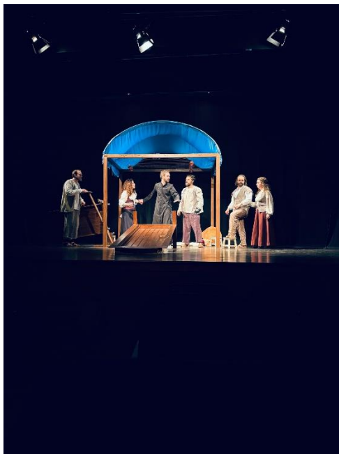
Figura 10 - Fotografia Espetáculo Memorial do Convento

A cenografia concebida para a obra Memorial do Convento pela ETCetera Teatro pauta-se por uma estética minimalista, que alia simplicidade formal a uma profunda carga simbólica. Esta opção não é apenas estética, mas também prática. Assim, através de um conjunto restrito de elementos cénicos, a companhia consegue recriar os múltiplos espaços da narrativa saramaguiana, adaptando-se com eficácia a auditórios, bibliotecas ou ginásios escolares. No coração do cenário, encontra-se uma armação de madeira, representando de modo vívido e tangível a “passarola”. Ao longo da apresentação, essa mesma armação sofre uma metamorfose gradual e ergue-se perante o público, num desenvolvimento que ecoa a história em si. O espetáculo recria assim, diante do público, o gesto de erguer uma máquina voadora, transformando a cenografia num prolongamento direto da ação.