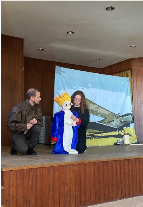
Figura 4 - Fotografia do Espetáculo Príncipezinho

remetia visualmente para a imagem de um avião, evocando de imediato a ligação do Aviador à narrativa. Todo o restante espaço cénico era construído sobretudo através da utilização de adereços.