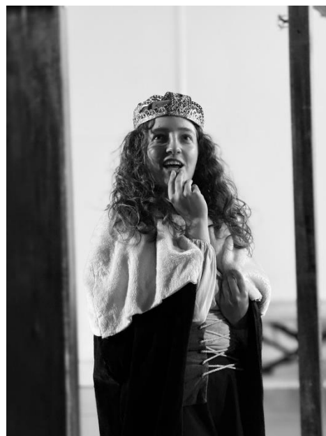
Figura 3 - Personagem da Rainha no espetáculo Memorial do Convento