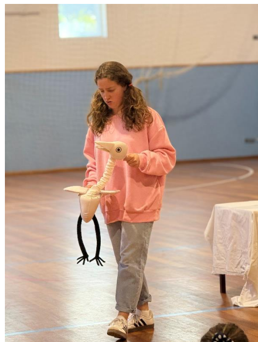
Figura 7 - Fotografia Espetáculo Pássaro da Alma