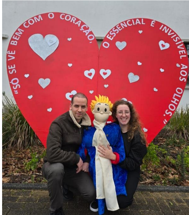
Figura 5 - Fotografia dos atores e da marioneta