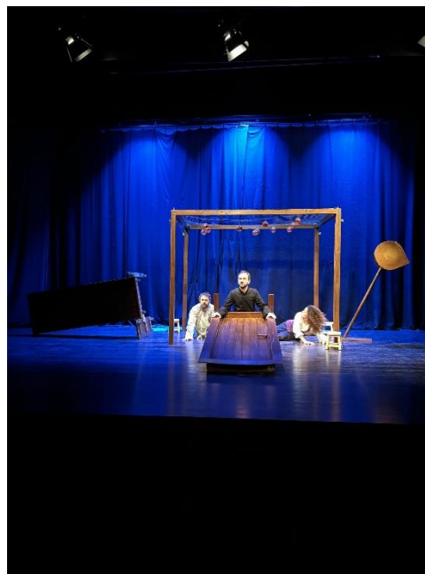
Figura 11 - Fotografia Espetáculo Memorial do Convento

Outro detalhe cénico relevante são as duas portas, colocadas à esquerda e à direita da estrutura, que se convertem em elementos de múltipla leitura. Inicialmente, as portas mostram lugares diferentes na história: a da esquerda representa o lar de Baltasar, e a da direita, o mundo do Padre Bartolomeu. Mas conforme a peça avança, essas portas transformam-se ganhando um novo sentido e transformando-se nas asas da passarola. Essa mudança no cenário destaca como o quotidiano das personagens se misturam com o