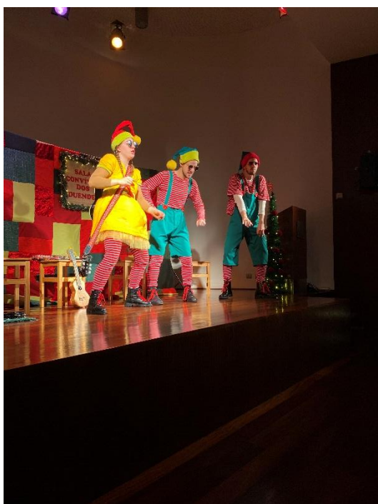
Figura 8 - Fotografia Espetáculo Natalmente

Quanto aos figurinos, a opção estética seguiu a mesma linha de cor, energia e festividade. A minha personagem, a duende Branca, vestia um traje predominantemente amarelo com detalhes em vermelho, sempre acompanhado de meias listadas e gorro de Natal, criando um contraste vivo e alegre com os outros duendes. Cada um dos intérpretes tinha uma cor predominante, permitindo ao público, sobretudo infantil, distinguir rapidamente as personagens e as suas características individuais. Esta estratégia cromática reforçava o dinamismo do espetáculo, além de favorecer a empatia imediata com as crianças.