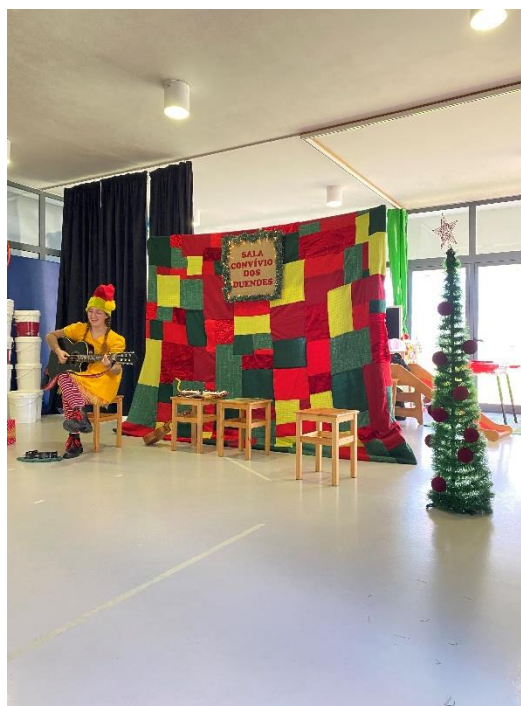
Figura 9 - Fotografia Espetáculo Natalmente