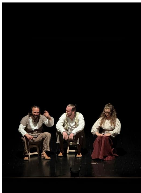
Figura 2 - Personagens alusivas ao povo no espetáculo Memorial do Convento

Através de Blimunda, Baltasar conhece o padre Bartolomeu, que sonha construir uma máquina capaz de voar - a célebre passarola. Fascinados pelo projeto, Baltasar e Blimunda tornam-se seus cúmplices e, em segredo, ajudam na construção. Enquanto este se ergue em segredo (alimentada pelas vontades humanas que Blimunda recolhe, invisível aos demais), o Convento de Mafra avança com brutalidade. Milhares de trabalhadores são recrutados à força, muitos morrem esmagados pelas pedras ou exaustos do esforço, e o povo paga com sangue e suor a ostentação de um rei. A obra monumental cresce, mas à custa do silêncio e do sacrifício coletivo.