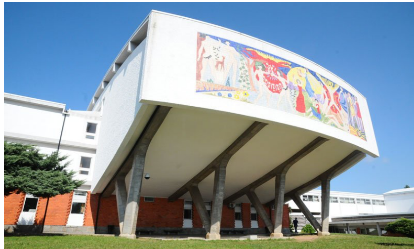
Figura 1- Conservatório de Música Calouste Gulbenkian de Braga

O Conservatório de Música Calouste Gulbenkian de Braga é uma instituição de ensino artístico especializado da música que oferece também um curso livre de dança que poderá ser certificado através da Royal Academy of Dance. Com uma arquitetura peculiar dos anos 60, o Conservatório localiza-se no centro da cidade de Braga, na rua da Fundação Calouste Gulbenkian.