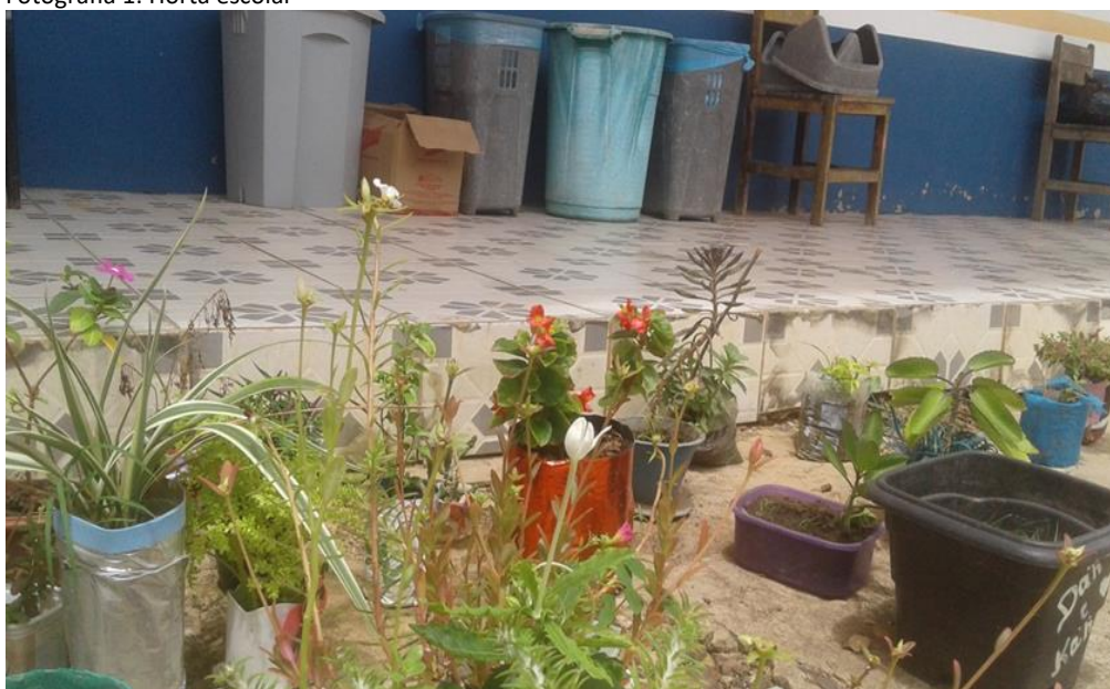
Fotografia 1: Horta escolar

Para o desenvolvimento desse projeto, a referida professora nos informou que procurou orientação no site do MEC onde está disponível uma obra denominada “Horta: a escola promovendo hábitos alimentares saudáveis” (2001), onde existem informações básicas para plantar, armazenar e preparar hortaliças em espaços pequenos, como o que foi utilizado na escola.