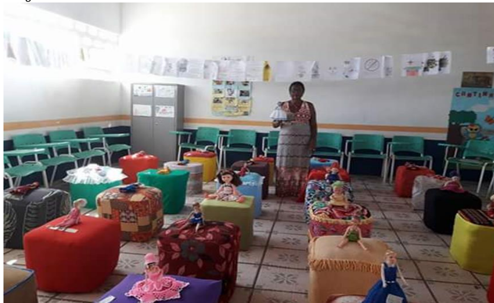
Fotografia 3: Feira de arte com material reciclável