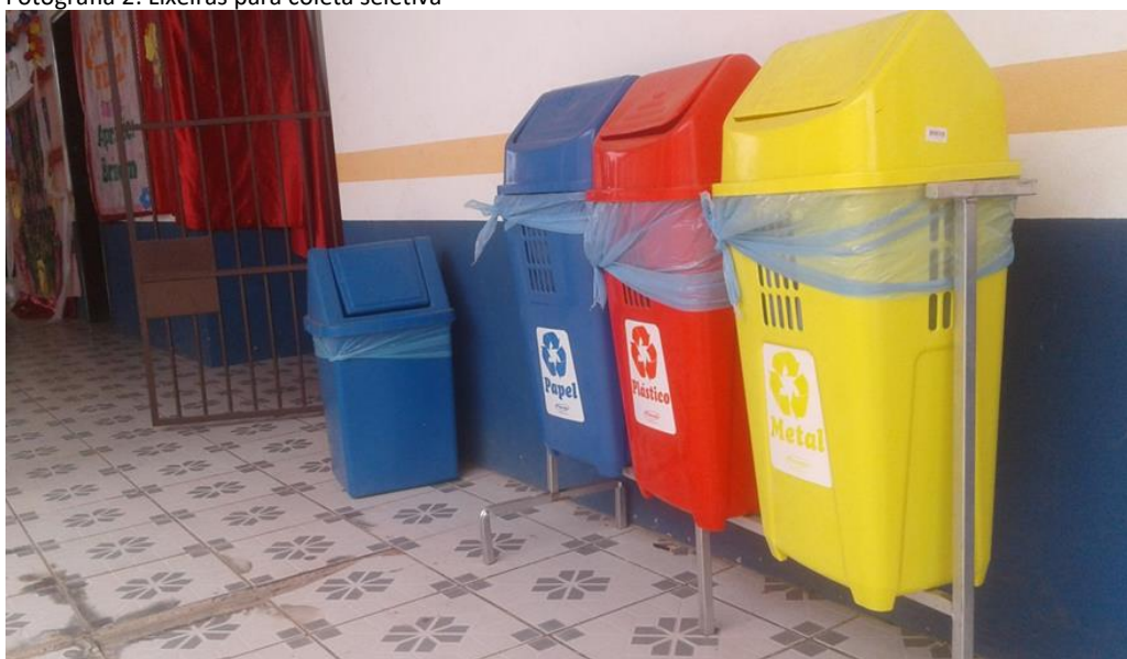
Fotografia 2: Lixeiras para coleta seletiva

selecionado conforme sua origem, sendo depositado em containeres de cores diferentes, adquiridos com recursos da escola para ajudar a manter limpo e saudável o ambiente escolar, resolvendo muitos dos problemas ambientais decorrentes do acúmulo de lixo, tais como contaminação das águas, doenças contagiosas, criação de moscas e baratas, que acabam infestando o ambiente trazendo doenças.