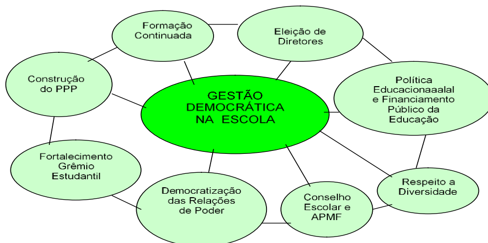
Figura 1: Mecanismos da Gestão Democrática na Escola Básica