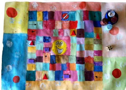
fig. 6 - Jogo de tabuleiro "Klee"