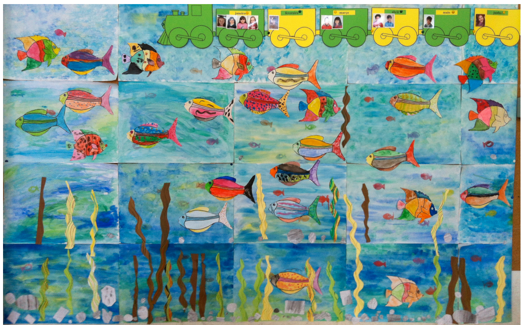
fig. 5 - Painel - aquário de turma

trabalhos ali criados que cada um recebe no final. A consciência destas assunções paralelas de portfólio, porém, nasce mais tarde. É só agora, ao recuperar esta reflexão a partir de uma nova leitura do portfólio reflexivo, em que a experiência tida entretanto permite uma visão mais abrangente, que é possível estabelecer certo tipo de ligações, como é esta relação entre os portfólios individuais dos alunos e o painel da turma.