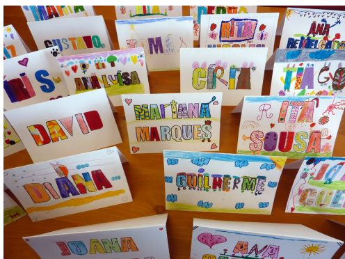
fig. 1 - cadernos/placas de identificação