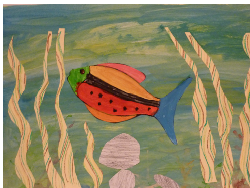
fig. 3 - aquário individual do aluno