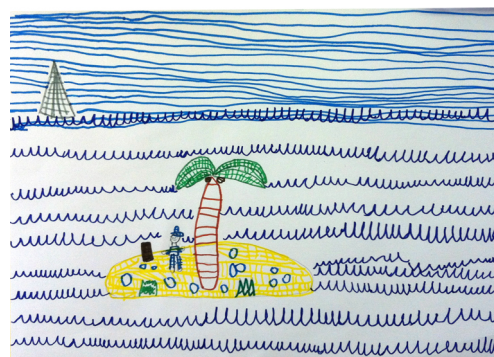
fig. 4 - texturas visuais

como resultados de um ditado, o resultado, tanto no papel como na reacção e assimilação dos alunos, é muito positivo. A diferença está mesmo no desafio, na novidade, no prazer durante o processo. No entanto, fica, inevitavelmente, a questão se não se poderia adoptar uma postura mais construtivista na metodologia de trabalho, dando aos alunos pontualmente mais espaço para que possam assumir um papel mais activo no processo de ensino/aprendizagem.