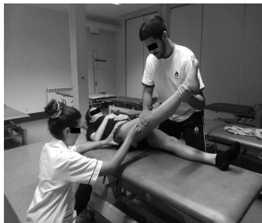
Figura 4 Medição da amplitude da CF durante o teste passivo do SLR

teste, controla as variações de movimento nos planos frontal e transversal, impedindo a abdução/ adução e rotação medial/ lateral da CF. O primeiro investigador procedeu à medição, acompanhando o deslocamento do membro com o braço móvel do goniómetro (Figura 4) e registou o valor obtido. Em cada momento foram efectuadas 3 medições nos três momentos