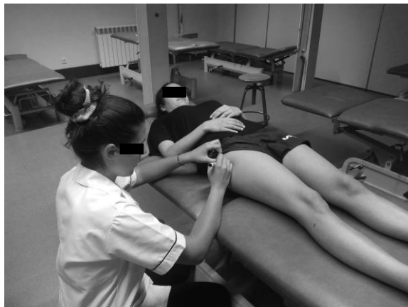
Figura 2 Marcação dos pontos anatómicos

Para determinar as alterações na flexibilidade dos IT foi utilizada a amplitude de flexão da CF, do membro dominante, durante o teste passivo de SLR, executado por dois investigadores. A medição da amplitude da CF foi realizada por um investigador através da colocação do fulcro do goniómetro sobre a marca do grande trocânter, o braço fixo paralelo à