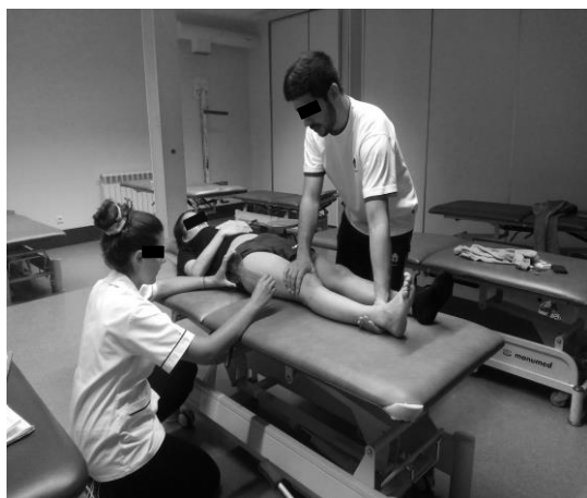
Figura 4 Posicionamento do goniómetro universal

marquesa e o braço móvel paralelo à linha entre o grande trocânter e o maléolo lateral do perónio (Figura 3), enquanto outro examinador realizou o teste passivo do SLR, que consistiu na elevação do membro dominante mantendo o joelho em extensão, até ao participante referir uma primeira sensação de desconforto na região posterior da coxa ou quando se verificaram alterações na posição da pélvis ou resistência ao movimento. Este examinador, durante o