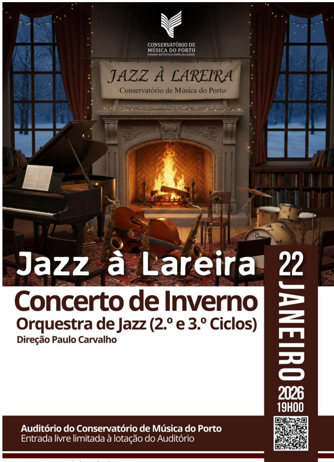
Fig 2 – Cartaz de Apresentação “Jazz à Lareira”