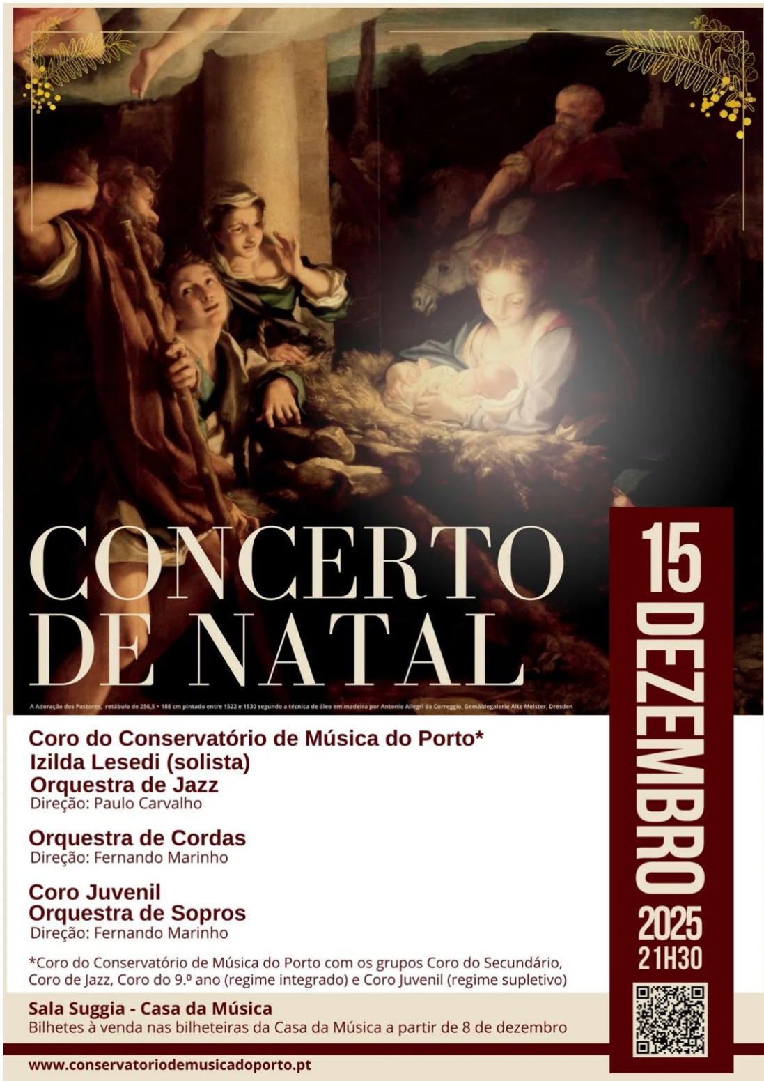
Fig 1 – Cartaz apresentação Concerto de Natal