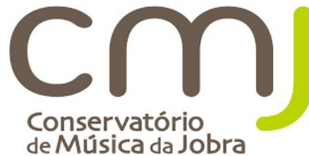
Figura 1 – Logótipo do CMJ

O Conservatório de Música da Jobra (CMJ) nasceu em 1986, como Escola Particular de Ensino Livre, tendo como objetivos a divulgação e o desenvolvimento do ensino artístico, da cultura e recreio de toda a população da Vila da Branca e freguesias limítrofes, em especial dos jovens. Porém, o seu desenvolvimento e a não existência de oferta formativa de Ensino Artístico Oficial no Concelho de Albergaria-a-Velha conduziram à criação de uma Escola Oficial reconhecida pelo Ministério da Educação (Lei n.º 9/79, de 19 Março). Assim, em 3 de Agosto de 1994, o Conservatório foi reconhecido como Escola de Ensino Oficial Artístico, podendo ministrar os cursos básicos de Piano e Viola Dedilhada (Portaria n.º 706/94, de 3 de Agosto). No ano seguinte, foram introduzidos os cursos de Flauta Transversal e Clarinete e posteriormente os cursos de Violino, Saxofone, Flauta de Bisel, Trompete e Percussão. Porém, uma vez mais, o CMJ deu provas de qualidade, organização e dinamismo, tendo sido atribuída autorização definitiva de funcionamento em 20 de Julho de 1999 pela Direção Regional de Educação do Centro (D.R.E.C.) (CMJ, 2015).