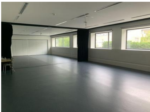
Fig. 4 - Sala de Espelhos