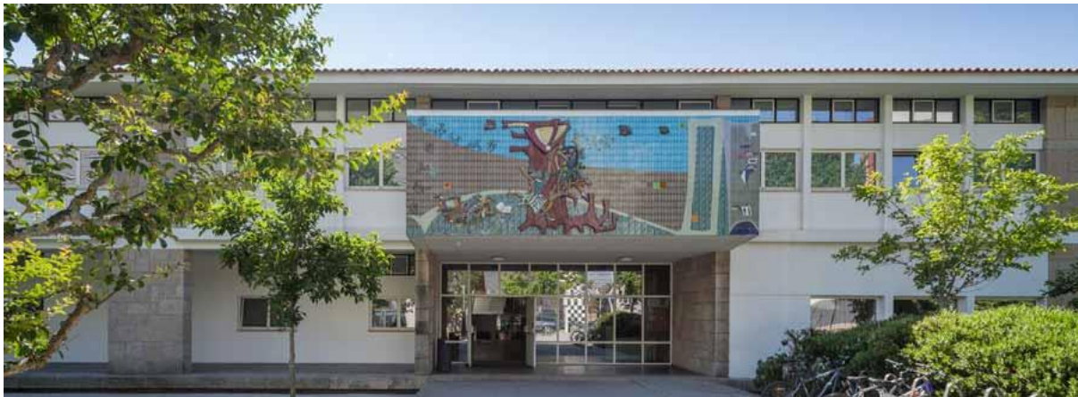
Fig. 1 - Escola Secundária 2 - 3 Clara de Resende