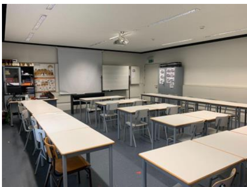
Fig. 2 - Sala de Ed. Musical