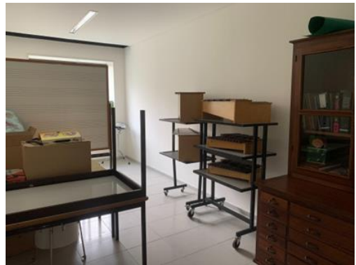
Fig. 5 - Arrumos