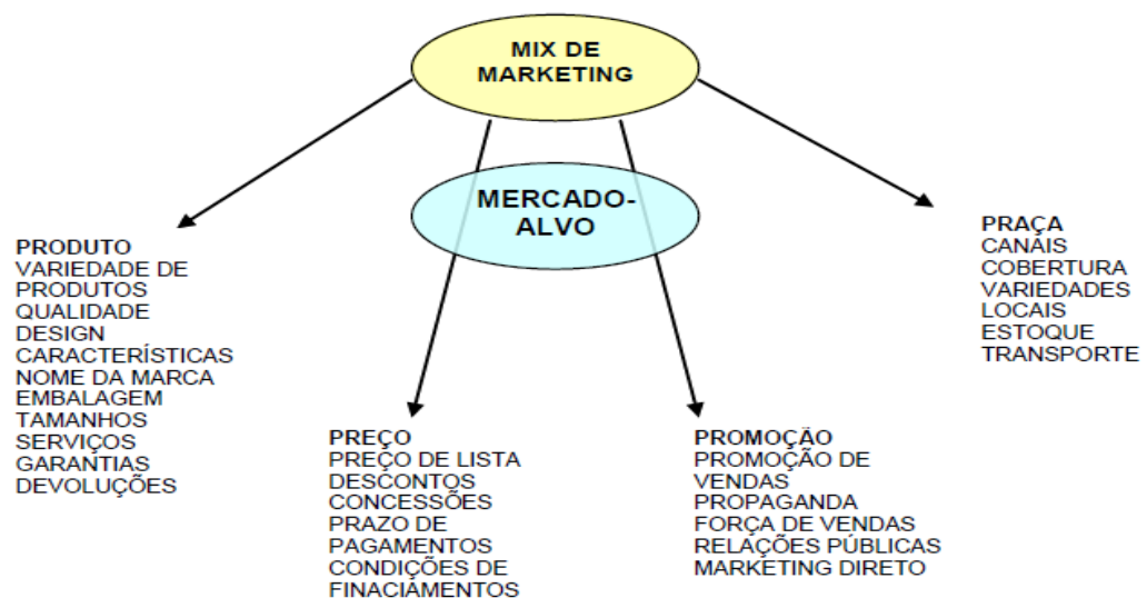
Figura 3 - Mix de marketing.

A figura 3 a seguir, ilustra, na visão de Kotler e Keller (2006) os quatro elementos que compõe o mix de marketing.