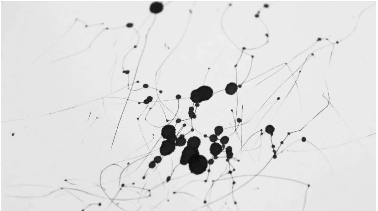
Fig. 6. Imagem da curta-metragem (2021). O ar barómetro do fluxo.