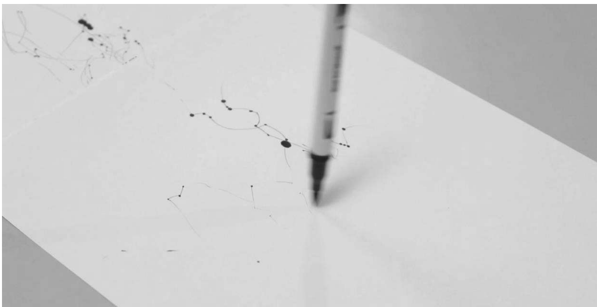
Fig. 1. Imagem da curta-metragem (2021). O ar barómetro do fluxo .

A exploração do desenho performativo de Morgan O’Hara 107 é tomada como referência para este ensaio audiovisual, pela eleição da interacção do corpo e do espaço, como tema preferencial dos projectos da artista.