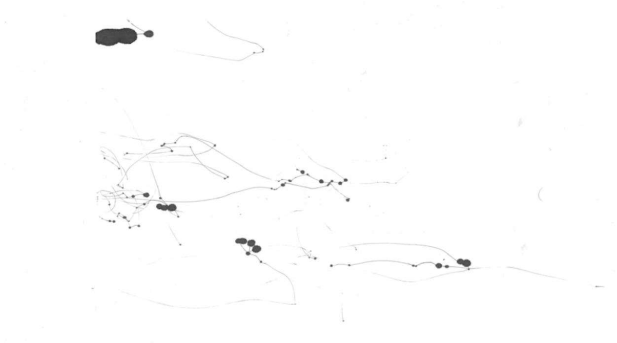
Fig. 4. Imagem da curta-metragem (2021). O ar barómetro do fluxo.

Observados no seu conjunto, nestes desenhos (fig. 4 a 7) vemos sobretudo linhas e manchas informes, que parecem apontar para um género paisagístico, ainda que por sugestão do mergulhar na ambiguidade de uma forma abstracta.