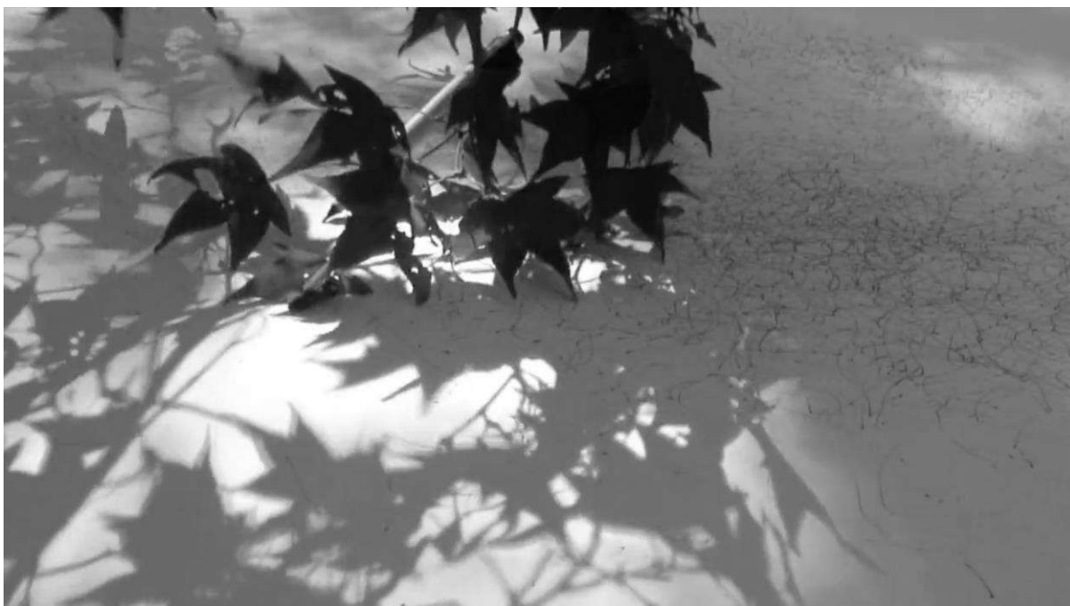
Fig. 3. Tim Knowles (2011). Tree Drawing - Acer Olivaceum . Tinta sobre papel. HD video. 9 min 47 sec.

Na expressão de Merleau-Ponty, o “olho mágico do artista” encara a visibilidade e a invisibilidade como facetas de uma só realidade, que se disponibiliza a ser compreendida, numa relação simbiótica entre quem procura e o que é procurado. Isto significa que o invisível, materializa-se ao ser percebido pela sensibilidade primordial do Ser que o torna matéria.