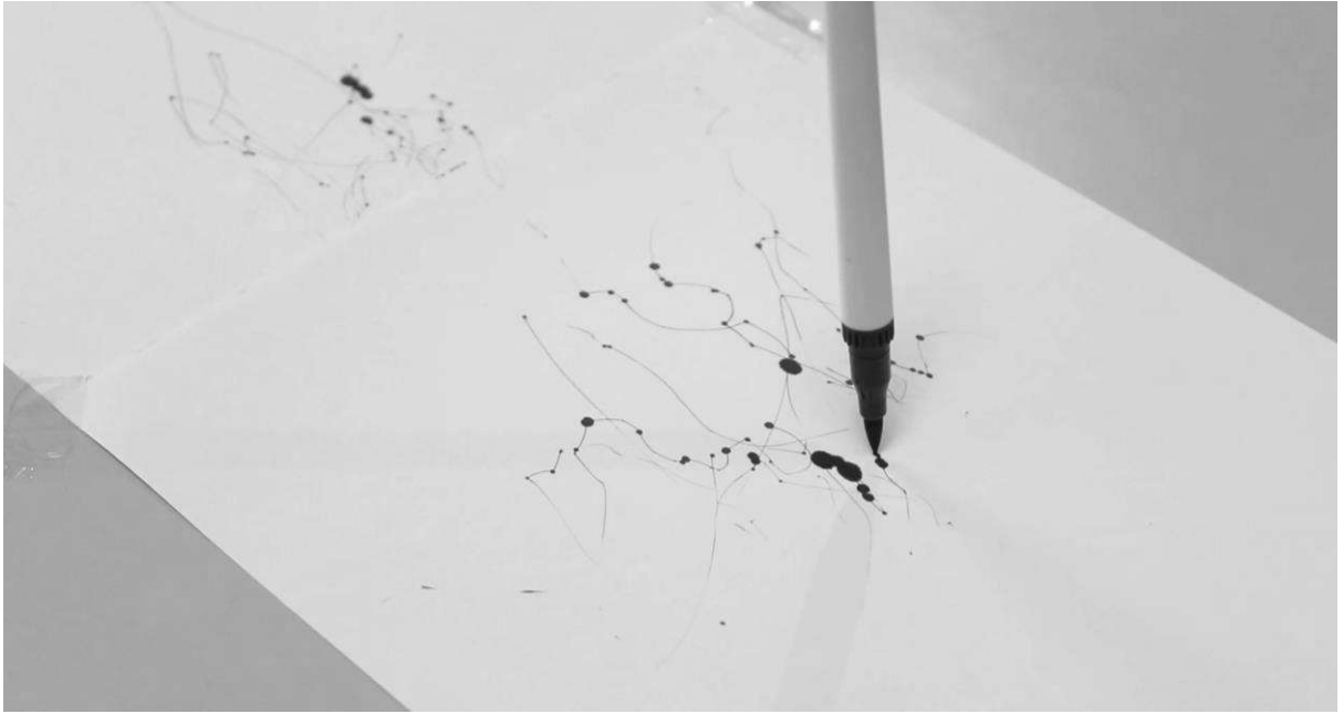
Fig. 5. Imagem da curta-metragem (2021). O ar barómetro do fluxo.