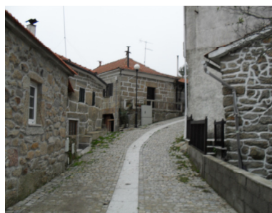
Foto7 e 8- A requalificação da aldeia.