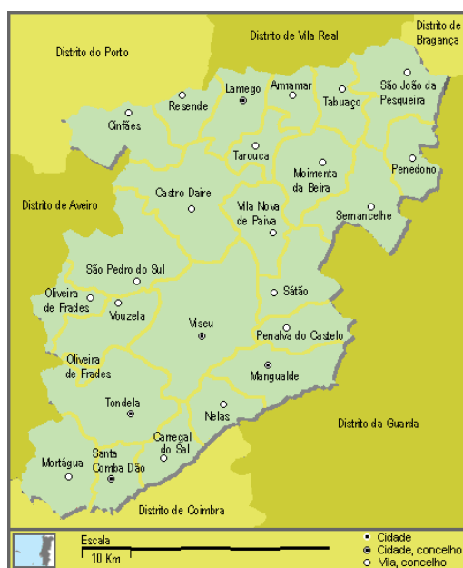
Mapa 6 - Limitação geográfica do município de Castro Daire e das suas freguesias. 7

O município é limitado a Norte pelos municípios de Cinfães, Resende, Lamego, e Tarouca a Leste por Vila Nova de Paiva, a Sul por Viseu, a Sudoeste por São Pedro do Sul e a Oeste por Arouca.