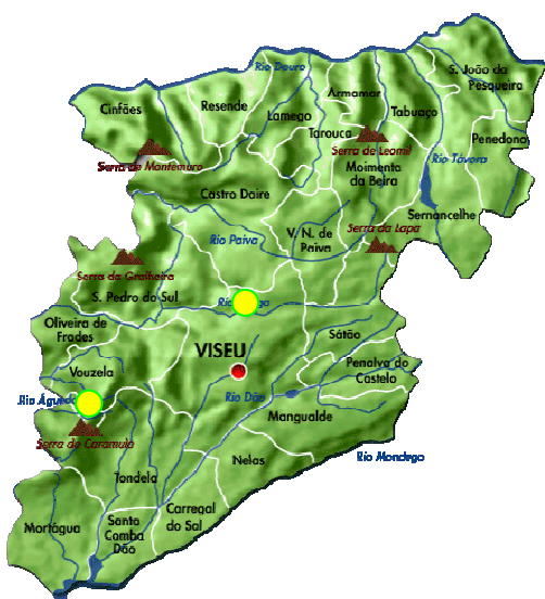
Mapa 2 – Mapa do distrito de Viseu. 25