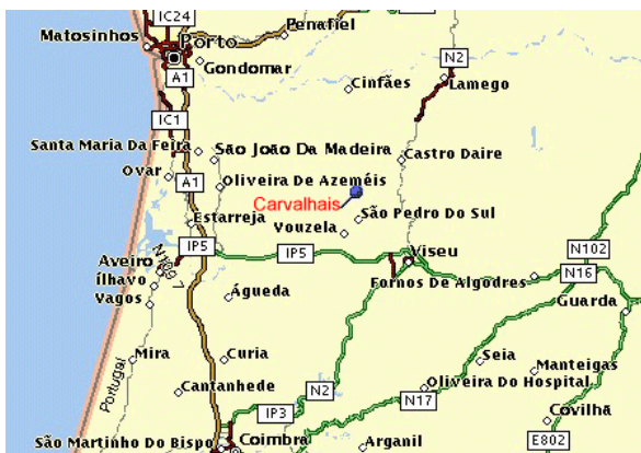
Mapa 1 -Localização de Carvalhais. 24