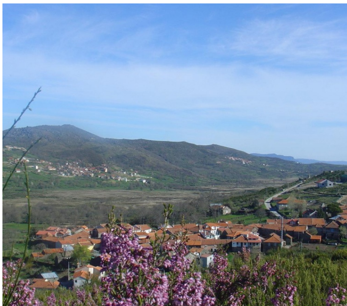
Foto 6 - Vista de Campo Benfeito. 11