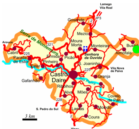
Mapa 3 e 4 – Mapas dos municípios de São Pedro do Sul e Castro Daire. 26