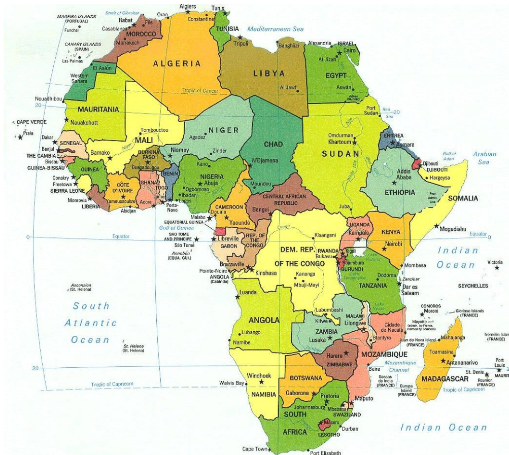
Figura 1. Mapa ilustrativo do Continente Africano 1