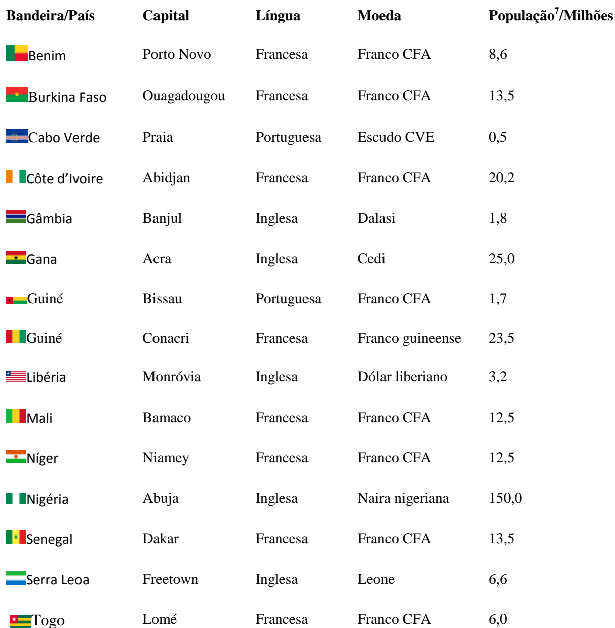
Figura 3. Cabo Verde - Exemplo Mundial na Sociedade da Informação