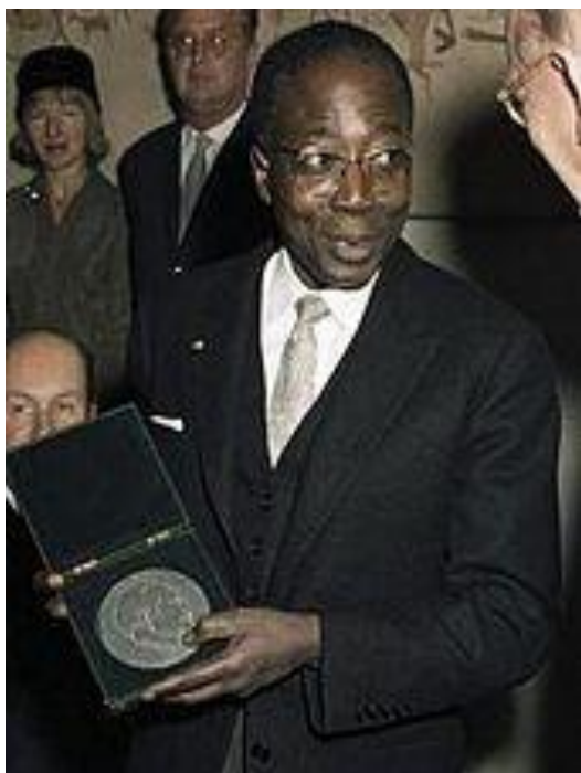
Léopold Sedar Senghor, Presidente do Senegal de 1960 a 1980.