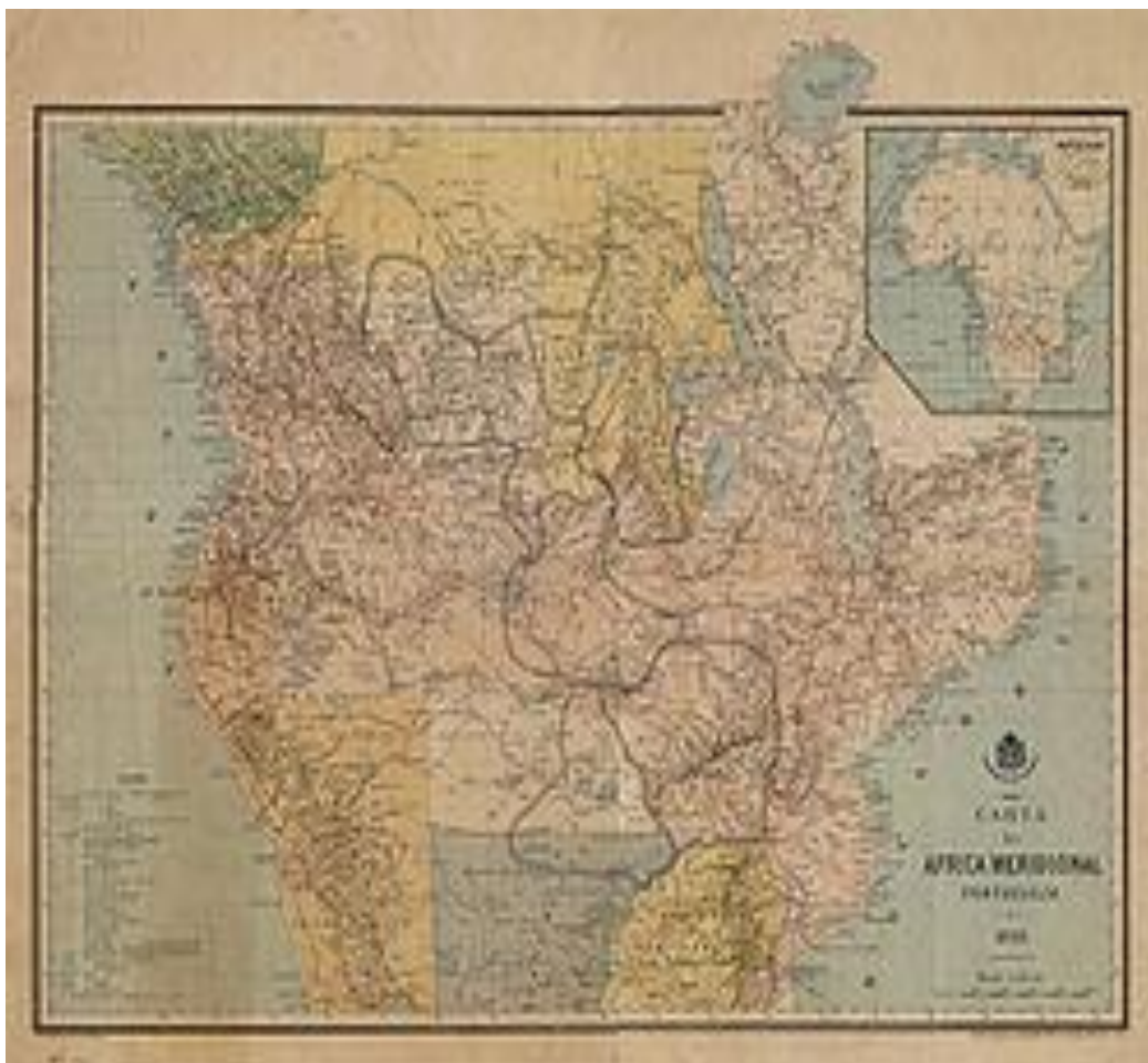
Versão original do Mapa Cor-de-Rosa.