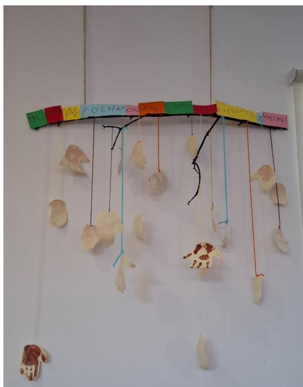
Figura 6: Construção de um elemento de decoração com os vários tons de pele da Sala B.

Contudo, as crianças queriam que este quadro fosse parte de uma exposição a ser realizada no Natal da Instituição, o que levou a uma nova sugestão criativa por parte das crianças para a mestrandia, a sua colega de estágio e a equipa pedagógica da sala: em vez de manter as mãos estampadas no papel, o grupo de crianças propôs recortá-las e pendurá-las num ramo. O que inicialmente era um quadro transformou-se assim num elemento de decoração, com as mãos suspensas representando a união e a diversidade do grupo. A ideia ganhou ainda mais significado quando as crianças sugeriram adicionar uma frase alusiva ao outono, estação em que se encontravam naquele momento, conferindo ao projeto um toque sazonal e poético (Figura 6).