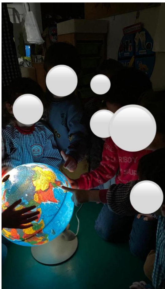
Figura 5: Exploração livre do Globo.

afirmando com segurança: “isso chama-se Planeta Terra”. Durante a exploração, as crianças interagiram entre si e com o globo, tentando localizar os países representados na sala (Portugal, Nigéria, Nepal e Brasil), demonstrando curiosidade e sentido de pertença. Entre os comentários ouvidos destacaram-se expressões como “está aqui o nosso país” (F.), “onde está o meu país?” (A.) e “aqui moram os pinguins” (P.), revelando o impacto da experiência enquanto oportunidade de aprendizagem lúdica, relacional e significativa.