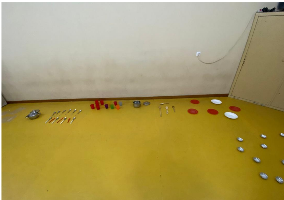
Figura 1: Organização do ambiente para o Jogo Heurístico.

A organização desta atividade foi cuidadosamente pensada e planeada em colaboração com a educadora cooperante da sala e as auxiliares de ação educativa, envolvendo diversos momentos de diálogo e de reflexão baseados nas observações realizadas ao longo do processo. A decisão de implementar a atividade em grande grupo resultou de uma escolha partilhada entre a mestranda, a sua colega de estágio, a educadora cooperante e as auxiliares de ação educativa, considerando as vantagens pedagógicas desta abordagem.