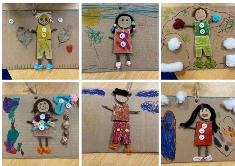
Figura 4: Resultado da atividade dos autorretratos.

A MTP favoreceu que as crianças explorassem estas temáticas de forma significativa, investigando, discutindo e construindo conhecimento de forma colaborativa. Durante o trabalho de projeto, foram desenvolvidas diversas atividades que trabalhassem e abordassem a questão das cores de pele, ao que a mestrande, a sua colega de estágio e a educadora cooperante da sala propuseram ao grupo criarem o seu autorretrato, sendo que as crianças gostaram tanto da ideia que acabaram por sugerir utilizar nessa mesma atividade diversos materiais como cartão, lã, bolas de algodão, missangas, marcadores, entre outros (Figura 4).