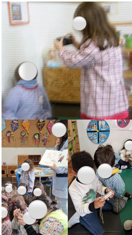
Figura 8: Exploração livre do objeto físico da história "O Dinossauro".

e as diferentes expressões do belo, ao possibilitar o contacto direto com a arte e a literatura de forma viva e partilhada, promovendo o encontro da criança com o imaginário, com a linguagem artística e com a emoção.