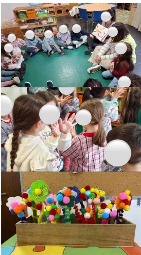
Figura 7: Leitura expressiva e as flores da sala B.

Após a leitura do livro, as crianças propuseram à mestranda e à sua colega de estágio realizar as suas próprias flores, criando assim um jardim para a sala. Devido à estação do ano em que nos encontrávamos, inverno, a mestranda, a sua colega de estágio, assim como a equipa pedagógica da sala, acharam que seria valioso e interessante fazer com que o grupo realizasse a sua própria flor, oferecendo assim um kit por cada criança que continha materiais como tecidos, pompons coloridos, rodas de madeira, paus de gelado, entre outros materiais. Este trabalho aconteceu em pares, para que as crianças tivessem o seu tempo para a realização da atividade e que não se sentissem pressionadas. Para além dos materiais que existiam no kit, houve crianças que pediram ainda se podiam utilizar as suas canetas (marcadores) na flor, ao que prontamente a mestranda disse que sim e entregou os mesmos para que estas fizessem a sua arte (Figura 7).