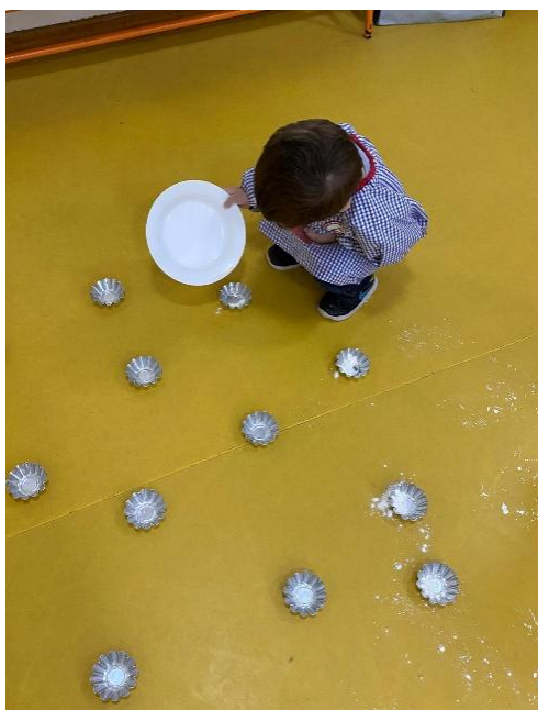
Figura 2: J. a brincar com a farinha e formas de alumínio.

que foi observada no seu contexto familiar. Neste processo a criança mobiliza inúmeros recursos internos, interpreta a realidade, relaciona-se com os outros e descobre em si a capacidade de ser outra pessoa, assumir outro papel que não o seu, atribuindo novos significados às suas experiências. Tal comportamento evidencia a importância do brincar enquanto ponte entre o mundo interno da criança e a sua realidade externa, conforme referido por Winnicott (1975), citado em Loures (2017), que considera a brincadeira como um espaço psicológico intermédio entre o mundo interno da criança e a realidade objetiva que a rodeia. Este episódio permitiu à mestranda reconhecer a relevância de proporcionar momentos de liberdade à criança, respeitando o seu ritmo e a sua forma de expressão, pois é nesse espaço de liberdade que a criança constrói o seu ser. O brincar é, por excelência, a linguagem natural da infância, sendo o jogo simbólico uma das vias mais significativas para o desenvolvimento da identidade, da criatividade e da compreensão do mundo.