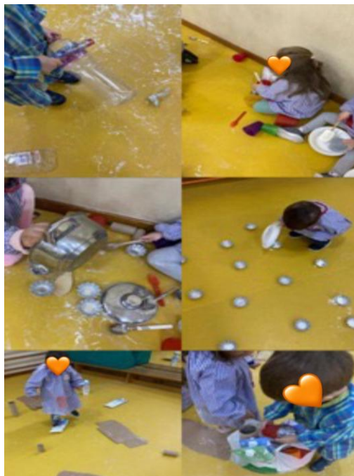
Figura 3: Exploração dos materiais do Jogo Heurístico e momento da arrumação.