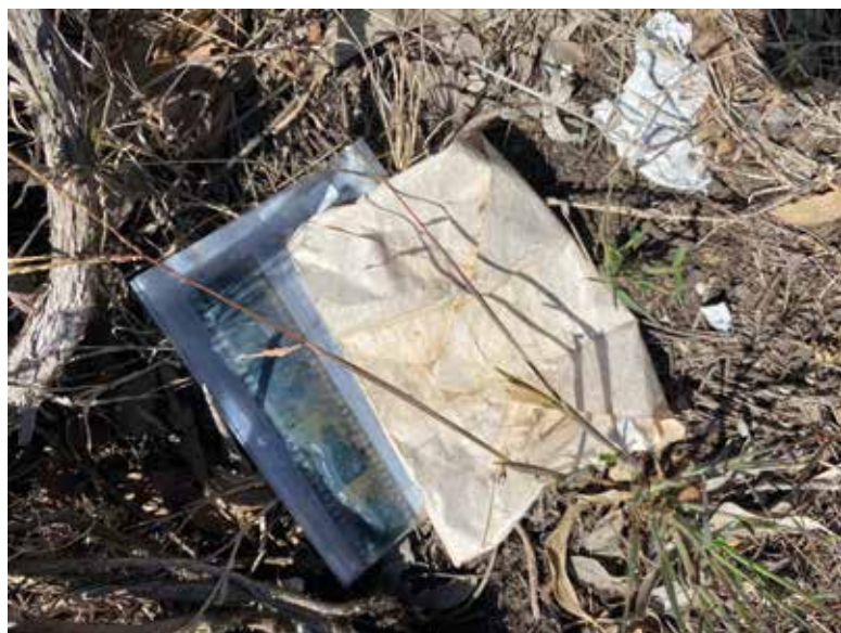
FIG. 2 Negativos encontrados na rua. Agosto de 2024.

“Inicialmente aplicado ao dialeto e à fala, o vernáculo surgiu como uma ideia acadêmica no âmbito da história da arquitetura, referindo-se geralmente a um estilo nativo de uma determinada região, bem como a uma estrutura com preocupações utilitárias. Embora a fotografia vernacular represente a grande maioria da produção fotográfica, este gênero acadêmico e interdisciplinar é relativamente jovem. Embora esta categoria possa abranger uma grande variedade de usos e tipos fotográficos - desde fotografias de anuários a recordações de viagens - refere-se frequentemente a imagens e objetos fora do cânone das belas-artes e produzidos ou consumidos em casa.” (Brown, 2005).