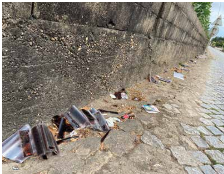
FIG. 3 Rua Adário Gonçalves Moreira, Vilar do Pinheiro, Vila do Conde, Portugal. Agosto de 2024.

das pistas para a interpretação das fotografias revelam-se na sua aparência material, no seu estado de conservação e erosão pelos elementos naturais, para além dos vestígios e ligações com os seus operadores e referentes. Relembrando o pensamento de Susan Sontag, as fotografias tendem a tornar-se mais interessantes e significativas à medida que o tempo as vai trabalhando (Sontag, 1979), porque o tempo é também um punctum, algo que nos trespassa à medida que o percorremos.