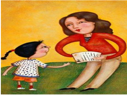
Imagem alusiva ao estilo parental democrático