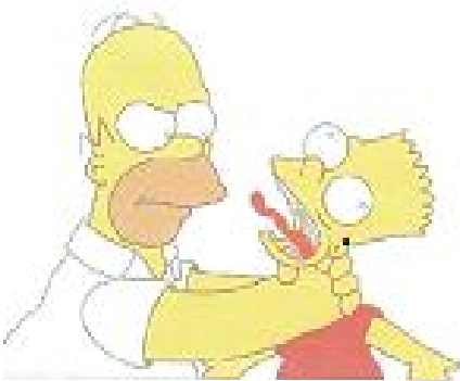
Imagem alusiva ao estilo parental autoritário