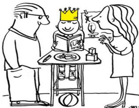
Imagem alusiva ao estilo parental permissivo