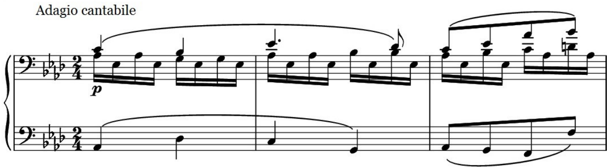
Figura 4.1, L. van Beethoven, Sonata Patética Op. 13, compassos 1 a 3.