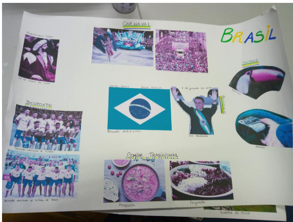
Figura 2 Cartaz feito com as crianças para o jantar temático do Brasil

Em conjunto, os protagonistas também construíram alguns elementos de decoração alusivos ao Brasil (mini-bandeiras, entre outros). A profissional brasileira também se disponibilizou a trazer alguns recursos como a bandeira do Brasil, o fubá, entre outros.