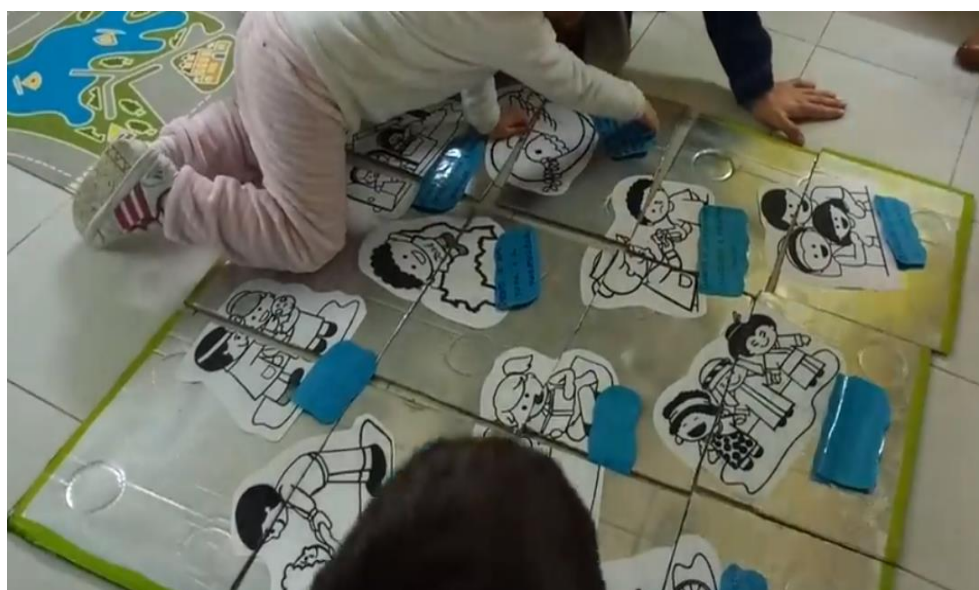
Figura 8 Puzzle terminado pelos protagonistas