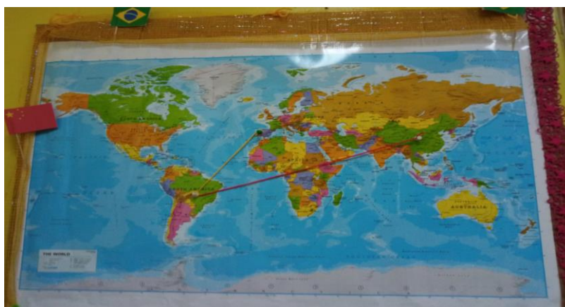
Figura 4 mapa construído para traçar os países que já haviam sido explorados nos jantares temáticos. Esta foto tem o percurso até à 2 o sessão

No final do jantar, a Íris lembrou que era necessário assinalar no mapa este novo destino e, em conjunto, fez-se a ligação entre Portugal, Brasil e China: