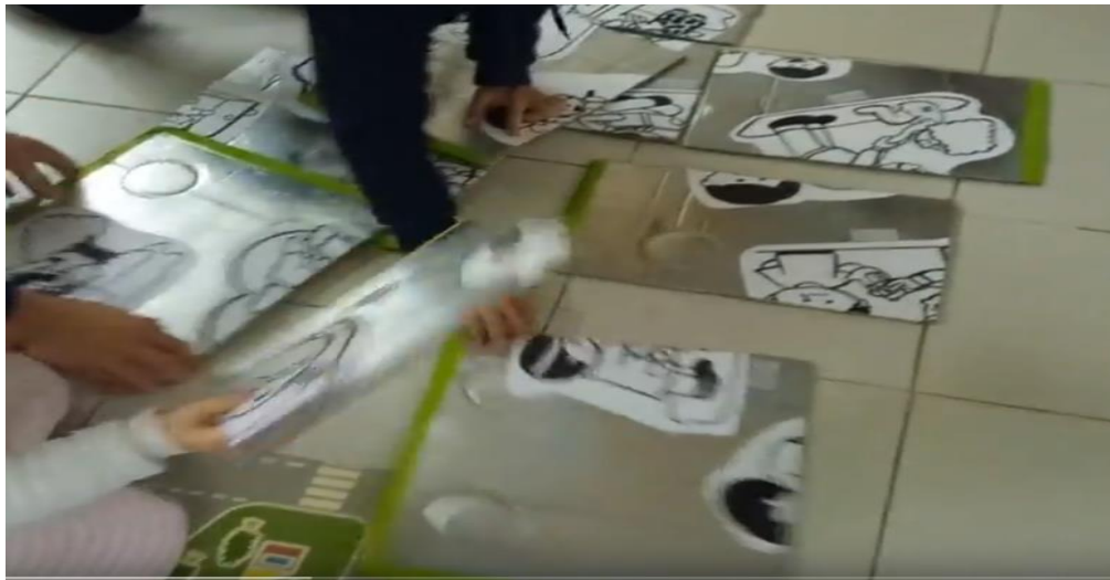
Figura 5 início da construção do puzzle