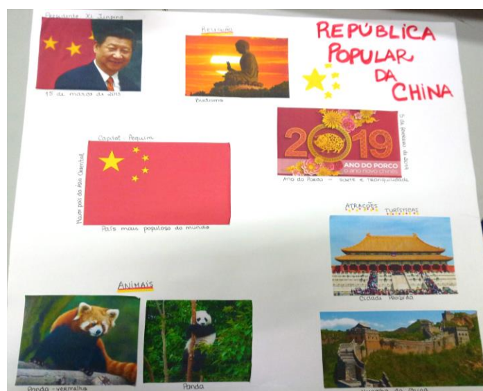
Figura 3 Cartaz elaborado com os protagonistas para o jantar temático sobre a China

Com recurso a um supermercado chinês da zona, tornou-se possível apresentar outros alimentos e objetos alusivos a esse país. Construiu-se ainda com os protagonistas o seguinte cartaz: