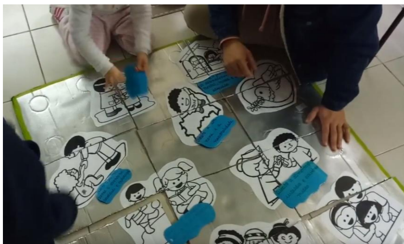
Figura 7 Após a conclusão do puzzle e da reflexão de cada direito, associaram o nome do direito a cada imagem