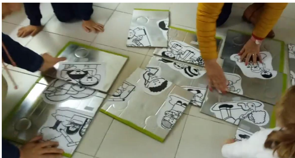
Figura 6 As crianças a realizaram, em conjunto com os pais e profissionais o puzzle