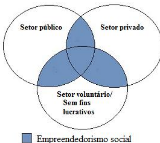
Figura 1.1 Espaço institucional para a emergência do empreendedorismo social

A figura seguinte demonstra a sobreposição do primeiro setor (setor público), o segundo setor (setor privado) e o terceiro setor (setor sem fins lucrativos) que configura o espaço para a emergência do empreendedorismo social.