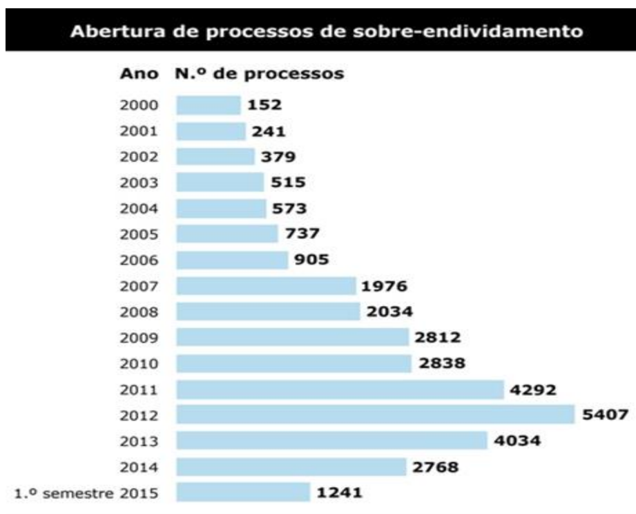
Ilustração 1 - Evolução de abertura de processos de sobreendividamento até ao primeiro

Apesar de serem várias as causas (doença, morte ou invalidez), o desemprego continua a ser o principal motivo para este crescente sobreendividamento, embora outros motivos recentes ou inesperados (penhoras ou alterações no agregado familiar, como nascimentos, falecimentos, problemas financeiros ou profissionais que levem os filhos a voltar para o agregado familiar dos pais) sejam cada vez mais frequentes. Seguem alguns dados que ilustram a evolução dos processos de endividamento e respetivos pedidos de ajuda nos últimos anos: