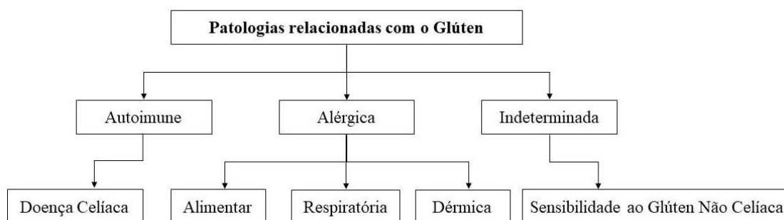
Figura II – Representação esquemática das patologias relacionadas com o Glúten (adaptado de Vaquero et al. , 2015).

Em indivíduos saudáveis cerca de 98% das proteínas ingeridas na dieta alimentar são digeridas por protéases gastrointestinais (Aranda & Araya, 2016). No entanto, as proteínas de glúten não são digeridas eficazmente pelo sistema digestivo humano e alguns péptidos, produto da digestão incompleta permanecem no trato digestivo. Relativamente ao trigo, a componente gliadina consegue resistir à acidez gástrica, enzimas pancreáticas e protéases do epitélio intestinal. Desta forma, os péptidos da gliadina conseguem atravessar o epitélio intestinal. Um destes péptidos, o \alpha -gliadina 33-mer, é considerado responsável por desencadear reações imunitárias em indivíduos predispostos (Aranda & Araya, 2016; Moscoso & Quera, 2016). Devido a este facto, o glúten tem atraído grande atenção com o crescente número de indivíduos que desenvolvem reações adversas aquando da sua ingestão (Rosell et al. , 2014). As patologias relacionadas com o glúten encontram-se apresentadas no esquema da Figura II e estão divididas com base no seu mecanismo patológico: (1) autoimune, Doença Celíaca; (2) alérgico, Alergia a Trigo e ainda indeterminada, (3) Sensibilidade ao Glúten Não Celíaca (Elli et al. , 2017).