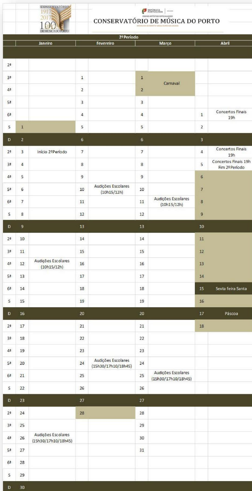
Figura 2: Calendário Escolar - 2.º Período