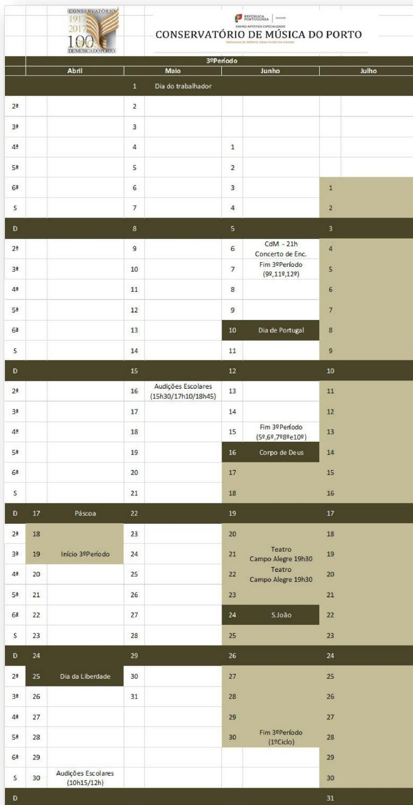
Figura 3: Calendário Escolar - 3.º Período