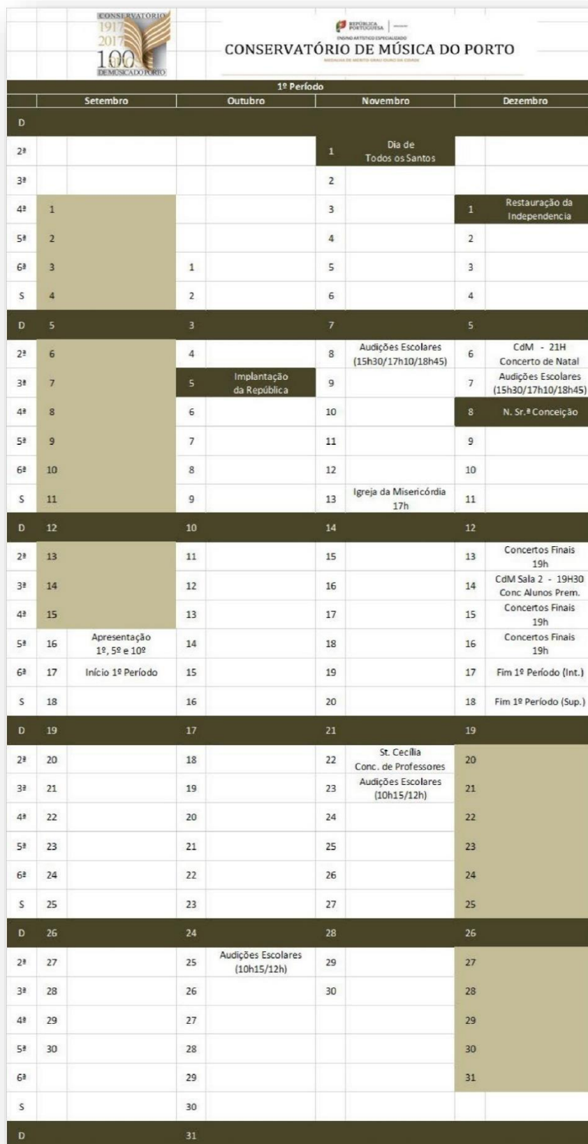
Figura 1: Calendário Escolar - 1.º Período