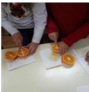
Figura 5 – Divisão em 4 partes iguais