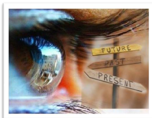
Figura 13 – Visão dos tempos

Ter como ponto de partida este princípio, implica assumir que se revela perentório ir ao encontro da “compreensão da realidade”, mas nunca descorando da “realidade em compreensão” (Máximo-Esteves, 2008, p. 12), em que os conhecimentos vivem em constante harmonia concetual e levam à abertura