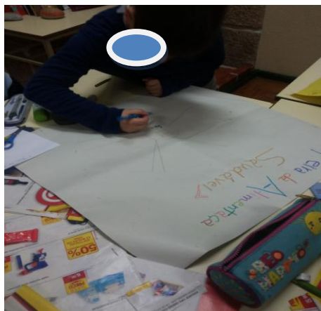
Figura 8 – Registo da Informação