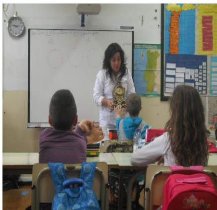
Figura 2 – Exploração dos Relógios

Perante a atividade descrita e analisada previamente, torna-se essencial mencionar ainda, que a mesma, para além de ser observada pelo outro