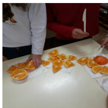
Figura 6 – Divisão em 8 partes iguais

As figuras 4, 5 e 6 correspondem a uma atividade de exploração do conceito de divisão, recorrendo a laranjas para concretizar a divisão prática, passo a passo, para levar à compreensão do conceito mas essencialmente para que posteriormente fosse possível aplicar em exercícios práticos. No momento de exploração os/as alunos/as eram convidados/as a realizar ações de acordo com orientações para todo o grupo. Numa primeira fase a divisão destinava-se a ser concretizada em duas partes iguais, passando para quatro, oito e doze sucessivamente.