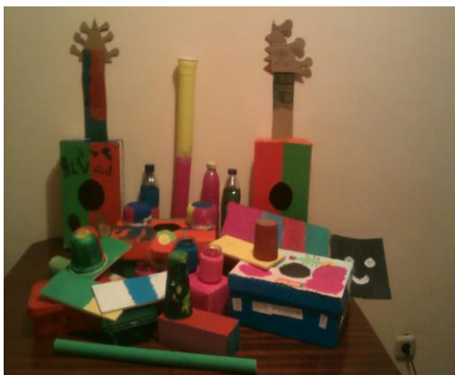
Figura 10- Instrumentos Musicais

A diversidade constitui-se portanto como um dos conceitos que deve vigorar no discurso e nas práticas dos/as Professores/as, na medida em que permite uma maior abrangência de exploração de conteúdos/conceitos. No entanto, importa ter em conta o que na realidade significa recorrer à “diversidade”, enquanto estratégia de promoção de aprendizagens significativas. Investir neste aspeto, implica portanto, desenvolver um conjunto de metodologias e recursos/materiais, que incidam na pluralidade de ações que encerram em si atuações de carácter personalizado indo ao encontro do que significa educar e não apenas ensinar.