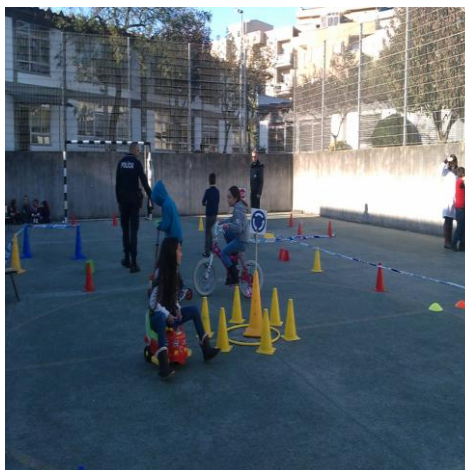
Figura 12 – Exercício Prático

A análise retrospectiva sobre o processo de intervenção em contexto educativo que foi desenvolvida, tem vindo a seguir um encadeamento lógico, na medida em que se focam as potencialidades e fragilidades. Nesse sentido, importa registar que a avaliação proporcionada aos/às próprios/as alunos/as do seu desempenho não foi bem conseguida como desejável, muitas das vezes por pressão de tempo e outras por inexperiência das estagiárias. Contudo foi e tem sido alvo de reflexão e este aspeto seria um dos aspetos essenciais a melhorar com maior incidência, exigindo um esforço acrescido ao nível da concetualização de estratégias que permitam que os/as alunos/as procedam à avaliação do processo, refletindo eles próprios recorrendo à argumentação e tomada de consciência.