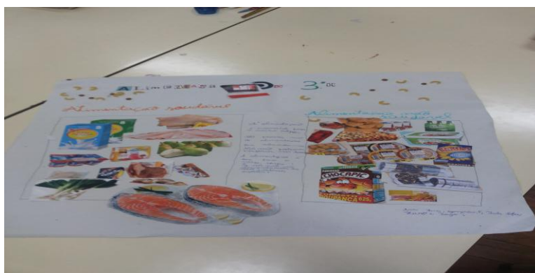
Figura 9 – Resultado Final

As figuras 7, 8 e 9 revelam isso mesmo, ou seja, numa primeira fase tornou-se necessário realizar uma discussão entre o grupo, apoiada com a orientação da estagiária, sobre possíveis estratégias de organização da informação a transmitir, passando