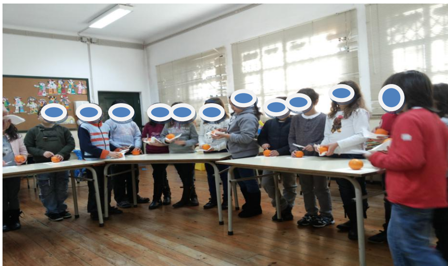
Figura 4 – Disposição do grupo na atividade da divisão