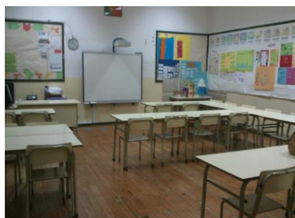
Figura 1 - Organização do Espaço

verificar que a sala se encontra estruturada segundo três filas diferentes (duas na horizontal e uma na vertical), reunindo ainda um espaço destinado à execução de tarefas com os