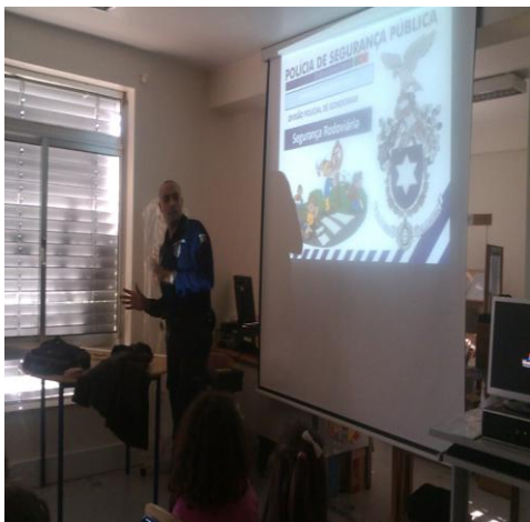
Figura 11 - Palestra

importância atribuída à pro-atividade práticas das tarefas e da consequente aprendizagem facilitada nesse sentido.