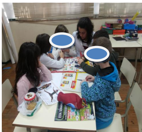
Figura 7 – Discussão de organização

grande grupo inicialmente, definindo neste momento o tempo disponível para a execução da tarefa, cerca de 45 minutos aproximadamente. De referir ainda que concluída esta construção, cada grupo teria que realizar uma apresentação para os restantes elementos da turma com o intuito de dar a conhecer não apenas o resultado final mas também o processo que esteve na origem do mesmo. Este momento reveste-se de enorme importância para cada aluno/a, na medida em que atribui validade às produções realizadas e que ao mesmo tempo responsabiliza cada um/a pelo seu processo de ensino.