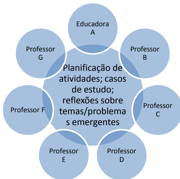
Figura 1 - Reuniões de grupo/supervisão