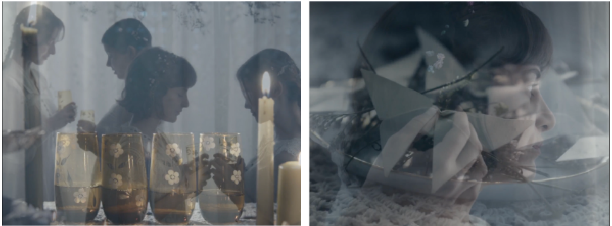
Figura 4 - Os Seres Cantarão (2025)

O filme culmina com as irmãs a saírem pela porta de casa em direção ao quintal, sendo o ecrã coberto por um flash branco. Esta escolha funciona, mais uma vez, como uma metáfora que deixa o espectador a questionar-se: será que Anastasia consegue libertar-se e abandonar as irmãs? Será que Olga foi convencida e, por consequência, todas as irmãs decidem afastar-se das crenças do pai? Ou tudo permanece igual? Reforçando um dos principais objetivos da montagem: explorar a subjetividade do espectador, estimulando a sua participação na construção do sentido do filme.