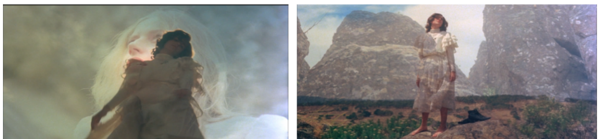
Figura 3 - Picnic at Hanging Rock (1975)

Após algum tempo no piquenique as alunas Miranda, Marion, Irma e Edith pedem permissão para explorar a área. As jovens começam a subir entre as rochas vulcânicas e, à medida que se aventuram entre as rochas, a música intensifica, assim como o uso de slow-motion. sob uma estranha influência Miranda, Marion e Irma entram em transe, enquanto a sucessão de dissolves, acompanhada pelo som etéreo das flautas, envolve o espectador numa experiência hipnótica.