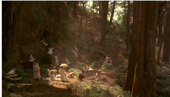
Figura 2 - Picnic at Hanging Rock (1975)

Durante o picnic os personagens estão quase estáticos, e são utilizados planos gerais que congelam as personagens no tempo e no espaço.