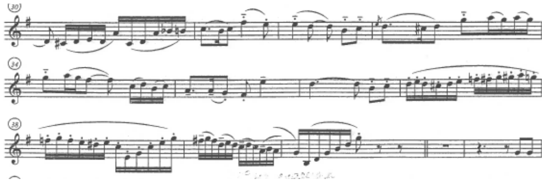
Figura 12 Exemplo da articulação na Cueca. Cueca, Guastavino, Editorial Lagos, 1995, p.2.

obra é visível o caráter festivo e rítmico imprimido pelo uso de uma articulação curta e enérgica (Panatteri, 2015).