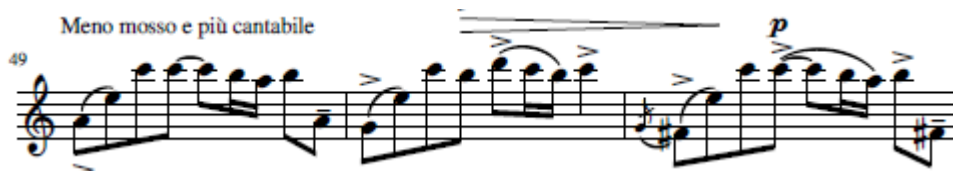
Figura 5 Compasso 51, onde surge a milonga nesta secção intermédia do estudo. Tango-Etude no. 3, Piazzolla, Editions H. Lemoine, 1987, p.7

Segundo Reyes (2018), Piazzolla privilegiava o ritmo, percussivo e acentuado para uma interpretação do tango. Ao longo deste estudo, é apresentado um tema enérgico e rápido, e numa secção central um contraste, Meno mosso e più cantabile . Nesta secção intermédia da obra, o ritmo da milonga torna a surgir, como pode ser visto na figura 5.