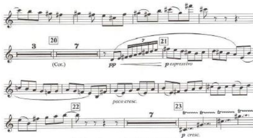
Figura 9 Seção lírica no número 21, em contraste com o material até então apresentado. Variaciones concertantes , Ginastera, Boosey & Hawkes, 1953, p.1

A Variazione in modo di scherzo for clarinete (Vivace) , em Variaciones Concertantes apresenta na sua globalidade trechos de difícil execução técnica. Segundo Kmiecik (2011), Excerpts of this type are frequently used by audition committees to evaluate the technical facility of the auditioning clarinetist. (p. 23). Apesar de ser comparada na sua complexidade técnica a excertos como L'oiseau de feu , de Stravinsky, e Symphony No.9 de D. Shostakovich (Kmiecik, 2011), esta variação apresenta também uma seção melódica bastante lírica, nos números 21 a 22, em absoluto contraste com o material bastante rítmico até então apresentado, como pode ser visto na figura 9.