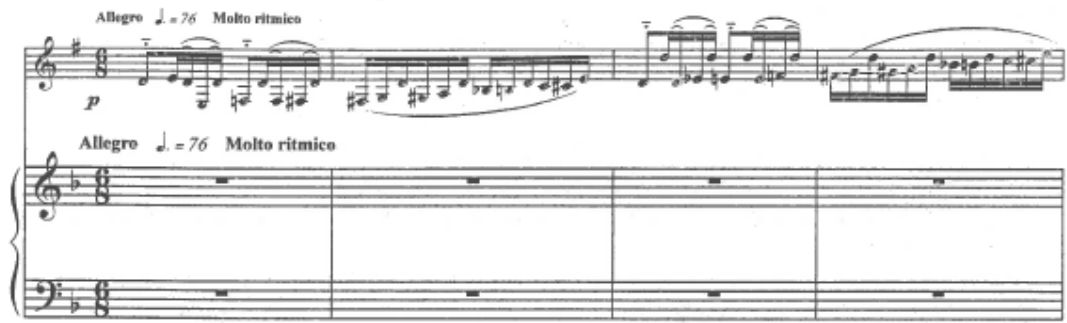
Figura 2 Início da Cueca. Cueca, Guastavino, Editorial Lagos, 1995, p.7.

Na obra de Ginastera, Variatione in modo di scherzo for clarinete (Vivace) é apresentado a indicação de Vivace . Esta informação, juntamente com a pulsação metronómica bastante rápida, pretende que o clarinetista apresente uma grande precisão rítmica, bem como uma grande agilidade técnica para a interpretação de trechos de difícil execução. Neste excerto orquestral estão presentes características rítmicas folclóricas como as hemíolas e o frequente uso de ritmos sincopados. O uso de appoggiaturas é uma característica que os compositores nacionalistas argentinos tanto apreciam. Este exemplo pode ser visto no número 16 da figura 3.