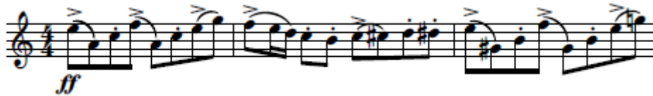
Figura 4 Exemplo da milonga. Tango-Etude no. 3, Piazzolla, Editions H. Lemoine, 1987, p.6

Ao longo do estudo é frequente o compositor variar as acentuações.