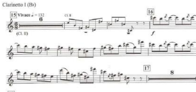
Figura 13 A articulação deverá ser muito precisa. Variaciones concertantes, Ginastera, Boosey & Hawkes, 1953, p.1

Em Variaciones Concertantes, na Variazione in modo di scherzo for clarinete (Vivace) , é necessário um grande rigor rítmico. Para tal, é essencial uma articulação bastante curta de modo a tirar o máximo partido da indicação Vivace para assim dar o caráter de fulgor a esta variação. Apesar de este excerto ocorrer maioritariamente no registo agudo do instrumento, a articulação deverá ser direta e precisa.