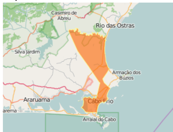
Figura 2 Mapa da Cidade de Cabo Frio

A investigação foi realizada na Escola Municipal Arlete Rosa Castanho, situada no Município de Cabo Frio, Estado do Rio de Janeiro.