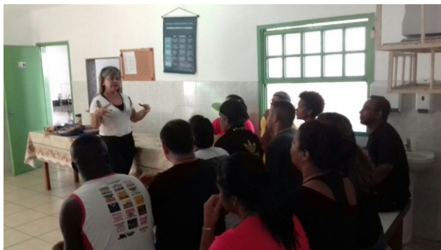
Espaço Físico da Escola