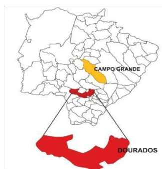
Figura 1: Localização de Dourados no Estado de Mato Grosso do Sul

O Instituto Federal de Educação, Ciência e Tecnologia de Mato Grosso do Sul – Campus Dourados- está localizado na cidade de Dourados, no estado de Mato Grosso do Sul. A cidade é constituída por uma área total de 4.086,237 km 2 e a área urbana totaliza 40,68 km 2 .