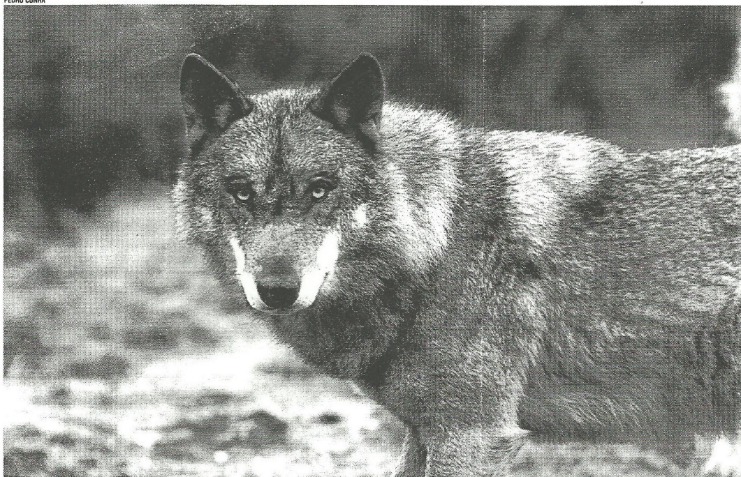
"Lobo/Wolf", co-produção do Teatro Regional da Serra do Montemuro com o Pentabus/Theatre Company hoje reposta em Coimbra