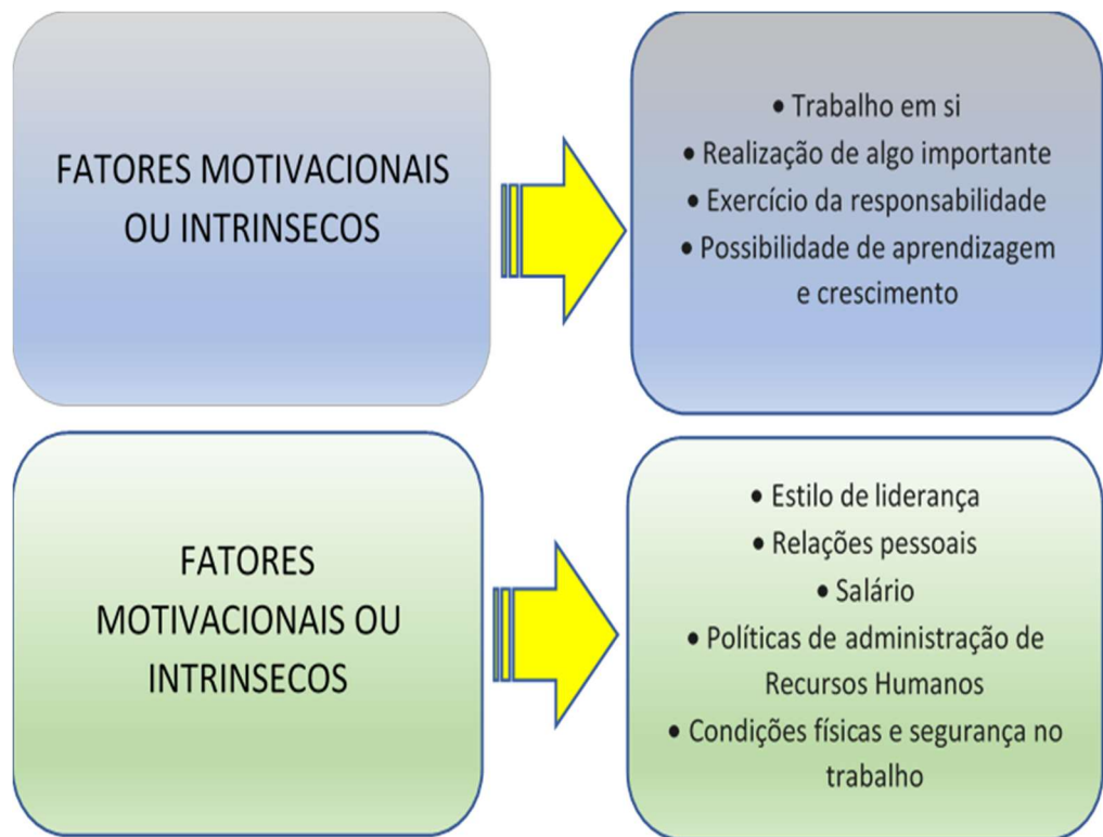
Figura 4 – Teoria dos dois fatores, uma ideia Herzberg, adaptado de Chiavenato, (2004, p.334)

Teoria das características da função de Hackman e Oldham – Hackman e Oldham criaram o modelo das características da função tendo definido cinco tipos de necessidades: