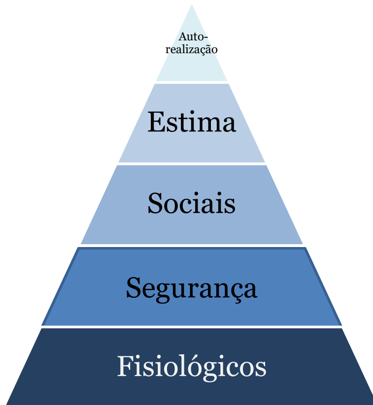
Figura 2 - Pirâmide de Necessidades de Maslow, adaptado de Chiavenato (2004, p.331)

tornam-se, assim, prioritárias. Segundo este autor, a hierarquia das necessidades humanas é a seguinte: