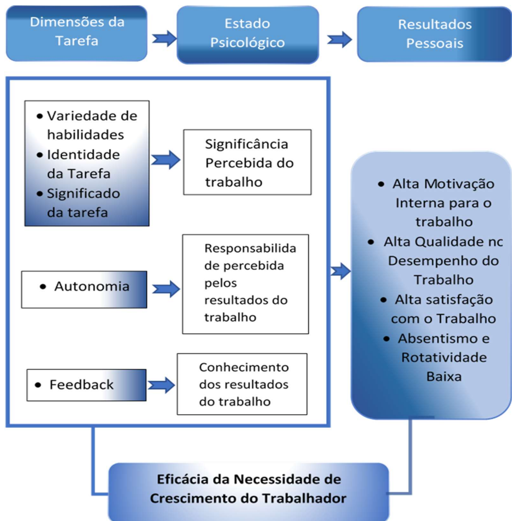
Figura 5 – Modelo das dimensões básicas da tarefa de Hackman e Oldham (1975, p.161)

E qual a ligação que se firma entre a motivação e os formandos? Qual é o papel desempenhado pela motivação durante a formação?