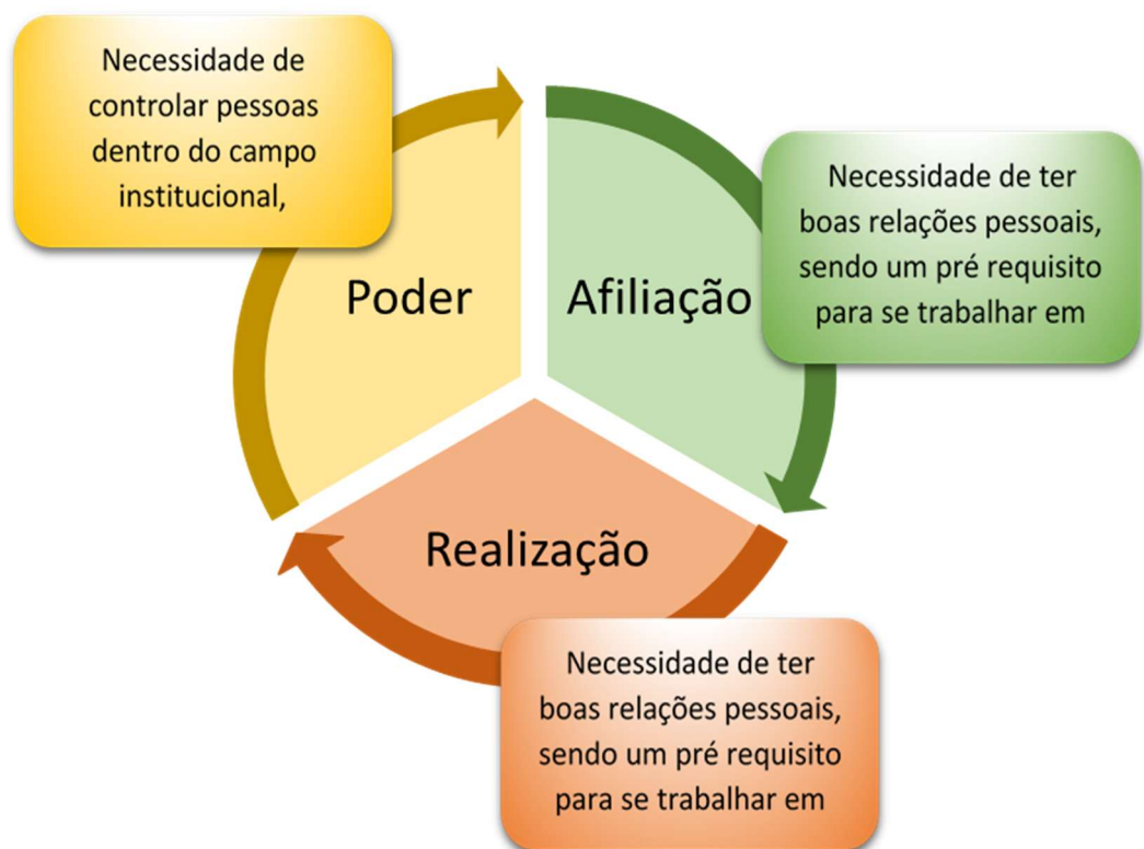
Figura 3 - Teorias das três necessidades de David McClelland

estas encontram-se relacionadas com a ambição e o reconhecimento por parte dos outros, sendo que neste tipo de necessidade pode ser visto o desejo de controlar os outros ou influenciá-los, procurando assim uma posição de liderança. Por seu turno, as necessidades de realização consistem no desejo de alcançar algo difícil, procurando superar as tarefas complexas e obter autonomia e feedback positivo pelos restantes membros do grupo. McClelland defendia que todas as pessoas têm algo destas necessidades, ainda que em graus distintos.