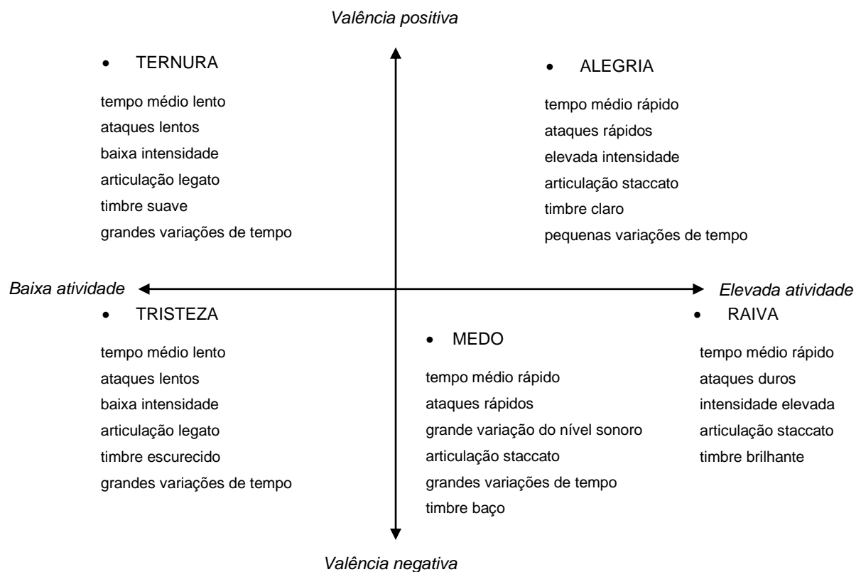
Figura 8 – Resumo dos indicadores expressivos utilizados pelo performer na comunicação da emoção na performance musical. (adaptado de Juslin, 2001:315)

A figura 8 mostra um resumo de indicadores expressivos utilizados na comunicação de emoções na performance musical (Juslin P. N., 2001).