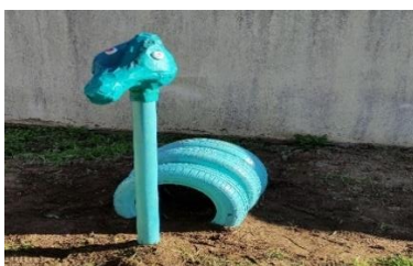
Figura 4- Projeto do espaço exterior

Tendo em consideração a importância do espaço exterior (cf. Capítulo I), como mencionado anteriormente, de maneira a contribuir para enriquecer o espaço e continuar a promover competências das diversas áreas, nomeadamente sociais e motoras, foi realizado um dinossauro com materiais recicláveis. No que concerne à realização da cabeça do dinossauro e à pintura, houve a colaboração das crianças, que demonstraram entusiasmo durante todo o processo. Para a seleção da cor, estas foram questionadas acerca da cor que mais gostavam, dentro do leque de cores disponíveis. Desta forma, foram estimuladas para um processo democrático e de negociação, no entanto, a maioria, rapidamente, concordou que devia ser azul “Para dar mais cor ao recreio”, disse, com muita assertividade a criança F.O. Para a elaboração da cabeça, recorreu-se à técnica da pasta de papel, e por isso foi um processo que ocorreu em várias fases. Foram criados pequenos grupos que ficavam responsáveis por aquela tarefa, ou seja, estes funcionavam de modo rotativo e, enquanto um grupo tratava desta tarefa, as outras crianças desenvolviam experiências pedagógicas nas áreas desenvolvimentais da sala. De anotar que este projeto do espaço exterior, foi articulado com outras salas do EPE, visto que estavam a desenvolver projetos com problemáticas que envolviam os animais, tendo sido divulgado à restante comunidade educativa.