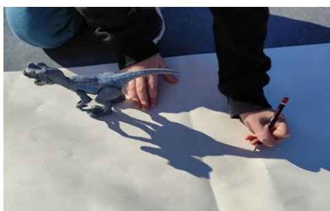
Figura 1- Desenho através da sombra representada pela luz do sol

No decorrer desta atividade do projeto as estagiárias tiveram como principal papel orientar e auxiliar as crianças face a dificuldades sentidas, pois, segundo Laevers (2014), um profissional deve estimular as crianças e proporcionando-lhe autonomia. Neste sentido, foi possível as crianças partilharem o máximo de conhecimento e aprendizagens entre elas e, simultaneamente, encontrassem estratégias e resolução para os seus problemas. Esta experiência possibilitou, pelo descrito, abordar a Área do Conhecimento do Mundo e a Área de Expressão e Comunicação.