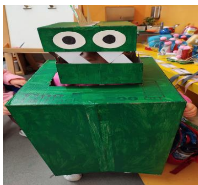
Figura 3- Dinossauro feito a partir da caixa de cartão

Pintaram máscaras, recortaram, colocaram elásticos e rapidamente identificaram quem ficaria com a máscara da caixa de cartão, consoante as características abordadas ao longo da história. Aliás, algumas crianças afirmaram, face à caixa de cartão, “Esse é o T-Rex”. A mestranda questionou o motivo e as crianças responderam “Porque ele é o maior”.