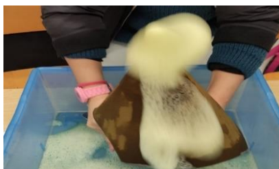
Figura 5- Experiência da erupção do vulcão

A estrutura do vulcão foi construída pelos grupos e, enquanto faziam essa construção, foram questionados quais seriam os ingredientes que poderíamos utilizar para simular a erupção de um vulcão. Durante esse diálogo, os alunos revelaram que sabiam alguns desses ingredientes necessários, sendo que os restantes tiveram que ser orientados pela estagiária responsável. Cada elemento teve oportunidade de colaborar na atividade e foi proposto que verificassem o que acontecia após a introdução de cada ingrediente. Após essa averiguação concluíram que o ingrediente “mágico” era o bicarbonato de sódio e que este representava a lava quando o vulcão entrava em erupção. No final, os alunos foram remetidos para uma reflexão “Então e se isto estivesse a acontecer na realidade, o que iria acontecer ao que estava ao redor do vulcão?”. Rapidamente, o D. respondeu que se assim fosse “Tudo iria ficar estragado e queimado”, a C. referiu que “As casas ficariam desfeitas”. Logo, os alunos apresentaram bom raciocínio, capazes de refletir e compreender que se a lava é quente e queima, então destruirá o que está ao redor. Competências estas que se pretendem desenvolver de acordo com os documentos orientadores PASEO e AE.