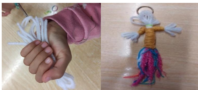
Figura 6-Boneca de folclore dos Açores

Perante as dificuldades sentidas pelos alunos, foi necessário fortalecer a aprendizagem de lidar com a frustração e de não desistir perante uma dificuldade, sendo que este foi um aspeto observado ao longo do estágio que necessitou de ser estimulado constantemente. Segundo Vavassori (2017) é importante lidar com a frustração durante a infância, pois permite criar habilidades para ultrapassar esse sentimento, o que pode trazer benefícios para a vida adulta e, assim, superar situações sociais. Portanto, entende-se que este sentimento se não for considerado relevante durante o crescimento do indivíduo, pode trazer consequências para a vida deste, não conseguindo ter resiliência e não desenvolvendo capacidade de ultrapassar os obstáculos.