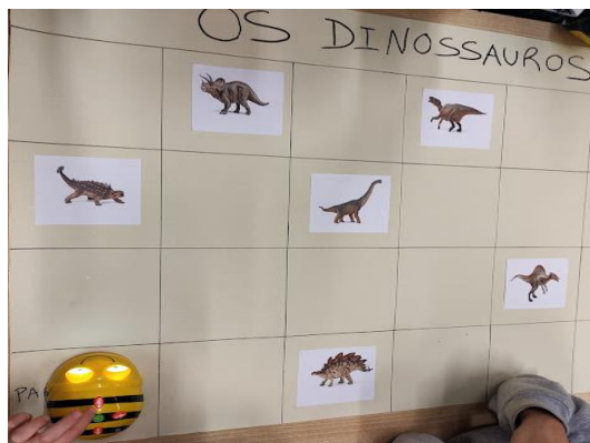
Figura 2- Tapete de programação e robot Bee-Bot

No que concerne às diferentes áreas de conteúdo mobilizaram aprendizagens associadas à Área do Conhecimento do Mundo e à Área de Expressão e Comunicação, no domínio da Matemática e da Linguagem Oral e Abordagem à Escrita.