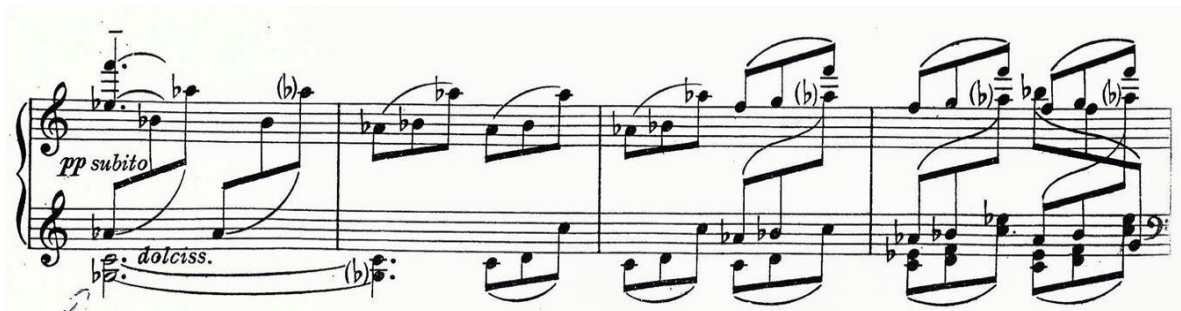
Figura 31: Tre Episodi dal balletto Marsia. 3º and., motivo C (cps. 13 a 16)

vozes ao motivo, a cada repetição do padrão. O carácter, contudo, é semelhante: tranquilo, em pp dolcissimo (figura 31).