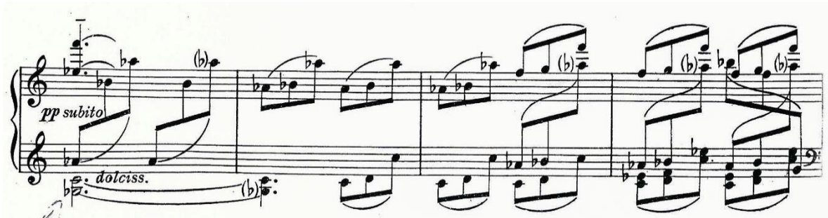
Figura 19: motivo comum (C no 3º andamento)