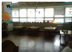
Ilustração 7 - Sala 5 anos

Toda a instituição tem apenas um piso, o que facilita a locomoção por parte das crianças e, por conseguinte, a sua autonomia.