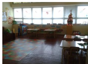
Ilustração 5 - Sala 3 anos