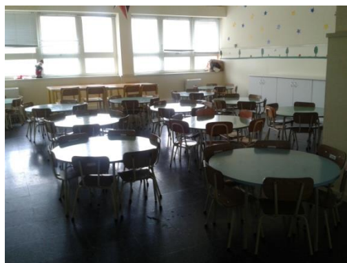
Ilustração 2 - Refeitório

O refeitório está localizado junto à cozinha, sendo composto por várias mesas e cadeiras de acordo com a faixa etária e número de crianças. É neste local que se servem os almoços e lanches da tarde, ambos confeccionados na própria instituição, havendo uma alimentação equilibrada e saudável, uma vez que a ementa é elaborada com a ajuda dos nutricionistas do centro de saúde.