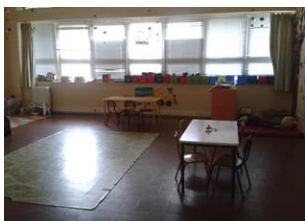
Ilustração 4 - Sala 2 anos

As salas de atividades possuem iluminação natural e artificial, como foi referido anteriormente, com materiais próprios à faixa etária das crianças, tendo ao mesmo tempo ventilação e aquecimento.