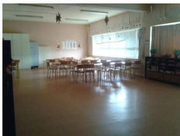
Ilustração 1 - Sala de ATL

O ATL também dispõe de duas casas de banho, estando divididas por sexos, tendo uma sala grande, com várias mesas e cadeiras para as crianças trabalharem e um local mais amplo, onde as crianças podem brincar mais a vontade.