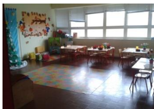
Ilustração 6 - Sala 4 anos