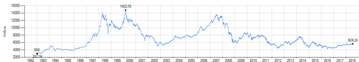
Figura 1: Evolução do PSI20