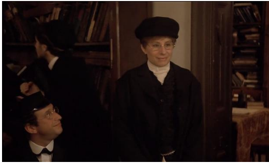
Figura 24. Yentl (1983) – excerto 3

Entre as figuras 20 e 23, Yentl conversa com homens da yeshiva, após ser aceite, mostra-se feliz (figura 24).