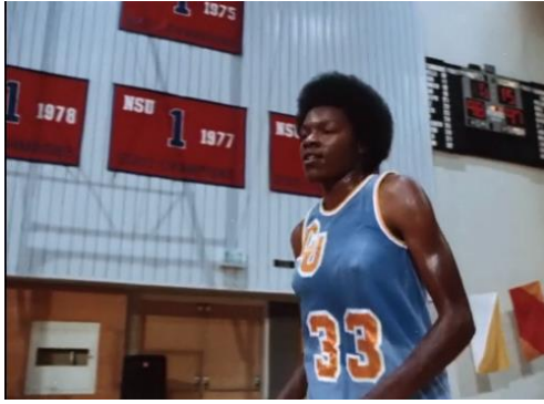
Figura 46. Fast Break (1979)