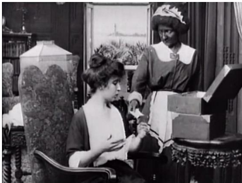
Figura 4. A Florida Enchantment (1914) – excerto 1

Iniciaremos a nossa análise da representação dos homens trans a partir de excertos do filme A Florida Enchantment (1914), seguindo-se Yentl (1983), Just One of the Guys (1985), Something Special (Willy/Milly) (1986). Depois será sequência de excertos dos filmes Just One of the Guys (1985), Albert Nobbs (2011), Yentl (1983) Victor/Victoria (1982) e Fast Break (1979), marcada pela constante presença das mamãs das atrizes e pela expressão das personagens que contracenam com elas.