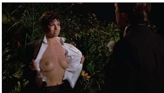
Figura 38. Just One Of The Guys (1985)

Tip refere em Disclosure o seguinte sobre Just One Of The Guys (1985): “They played with this idea of transness as a way of occupying a space that you necessarily aren’t supposed to have.” (Feder, 2020). Esta citação aplica-se não só ao filme em questão, como também a todos os outros que abordam a identidade trans de forma similar.