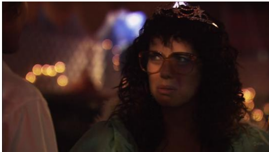
Figura 58. The L Word (2004-2009) – excerto 5