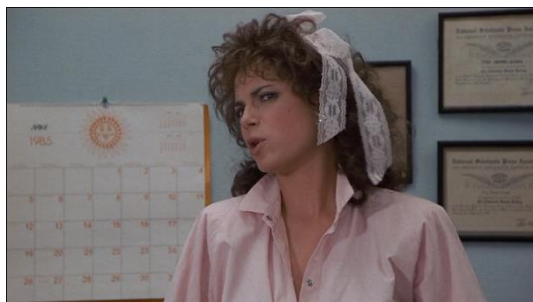
Figura 30. Just One Of The Guys (1985) – excerto 3

Nas figuras 29 e 30, Terry discute com o editor do jornal.