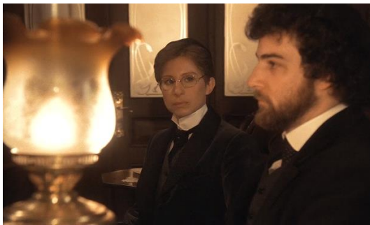
Figura 25. Yentl (1983) – excerto 4

Entre as figuras 20 e 23, Yentl conversa com homens da yeshiva, após ser aceite, mostra-se feliz (figura 24).