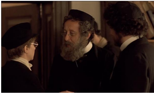
Figura 20. Yentl (1983) – excerto 3

Nas figuras 16, 17 e 18 vemos Yentl, ‘agora’ um homem trans, a observar algo no campo. Na figura 19 apercebemo-nos que olha para uma carroça que passa por si, manda parar o condutor e corre para entrar nela.