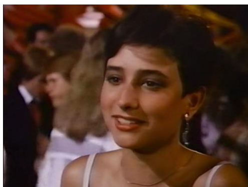
Figura 36. Something Special (Willy/Milly) (1986) – excerto 3

No segundo excerto, nas figuras 34 e 35, Willy conversa com o rapaz que ama.