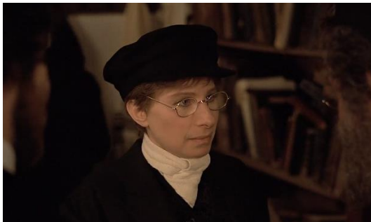
Figura 21. Yentl (1983) – excerto 3