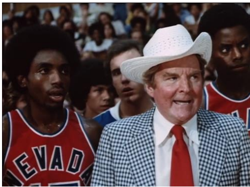
Figura 47. Fast Break (1979)

Na figura 46, entra no campo de basquetebol um ‘suposto’ homem. O homem branco da figura 47 zanga-se quando vê as mamas da personagem da figura 46.