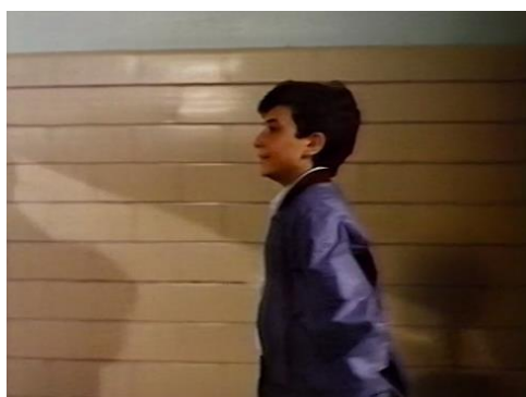
Figura 32. Something Special (Willy/Milly) (1986) – excerto 1