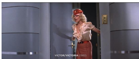
Figura 45. Victor/Victoria (1982)

A personagem da figura 44 começa a tirar a gravata. A mulher da figura 45 mostra-se incomodada ao descobrir que à pessoa da figura 44 foi-lhe atribuído o género feminino à nascença.