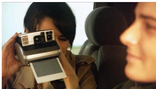
Figura 48. The L Word (2004-2009) – excerto 2 25

género masculina. Aliás, este estereótipo é visível em Max nas figuras do seguinte excerto.