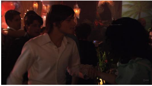
Figura 60. The L Word (2004-2009) – excerto 5