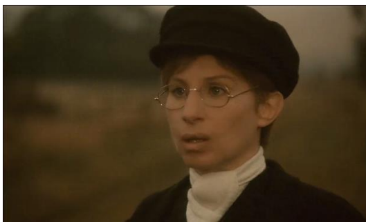
Figura 18. Yentl (1983) – excerto 2