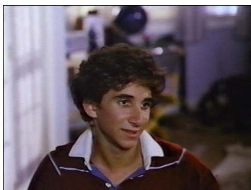
Figura 35. Something Special (Willy/Milly) (1986) – excerto 2

No segundo excerto, nas figuras 34 e 35, Willy conversa com o rapaz que ama.