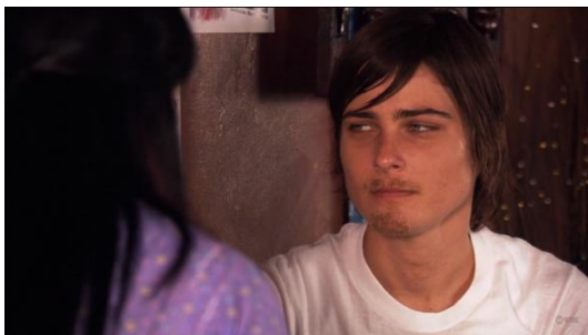
Figura 64. The L Word (2004-2009) – excerto 11