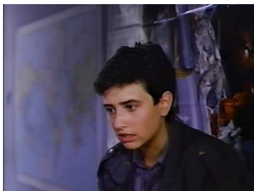
Figura 34. Something Special (Willy/Milly) (1986) – excerto 2