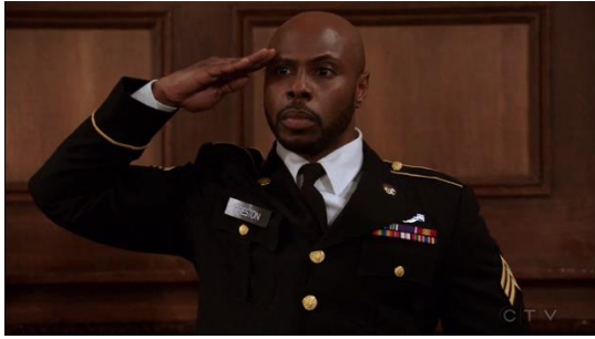
Figura 3. Jim Preston, militar - Law & Order: Special Victims Unit (1999-)