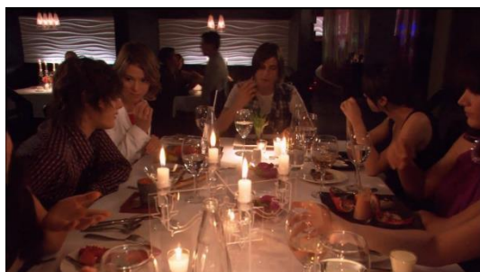
Figura 54. The L Word (2004-2009) – excerto 10