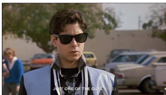
Figura 26. Just One Of The Guys (1985) – excerto 1

Tal como nestes exemplos, poderemos entender que os motivos para a transição ou ‘transformação’ de Yentl estarão nesta teorização. Contudo, a presente visão sobre este filme está em risco de ser refutada quando analisarmos a sequência de excertos dos filmes Just One of the Guys (1985), Albert Nobbs (2011), o presente filme Yentl (1983), Victor/Victoria (1982) e Fast Break (1979).