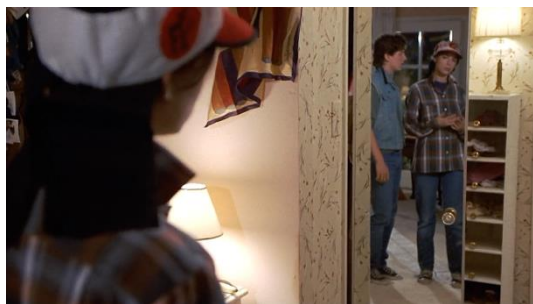
Figura 28. Just One Of The Guys (1985) – excerto 2

No segundo excerto, como mostram as figuras 27 e 28, Terry discute com o companheiro de residência.