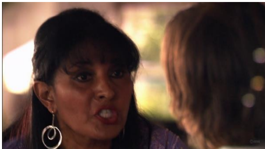
Figura 63. The L Word (2004-2009) – excerto 11

A situação descrita nesta citação apresenta paralelismos com a conversa entre Max e Kit (Pam Grier), (excerto 11, figuras 63 e 64).