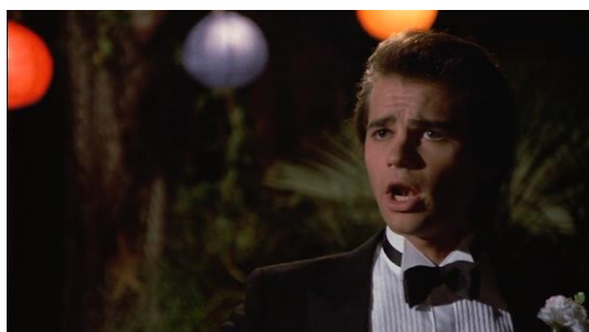
Figura 39. Just One Of The Guys (1985)

Na figura 38, Terry abre a camisa e mostra as mamas ao homem com quem está a conversar na figura 39.