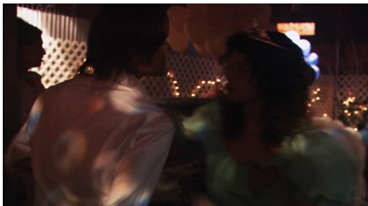
Figura 59. The L Word (2004-2009) – excerto 5