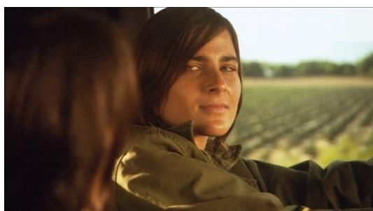
Figura 49. The L Word (2004-2009) – excerto 2

Neste excerto (figura 48 e 49), Jenny (Mia Kirshner) fotografa Max, numa fase em que Max ainda não se assumiu como homem trans. E, na figura 49, o espectador apercebesse, claramente, que Max é uma butch, pelo olhar/ cumplicidade e atração que existe entre ambos.