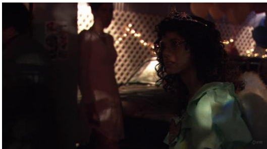
Figura 62. The L Word (2004-2009) – excerto 5

Outro estereótipo lésbico presente em The L Word , e tendo em conta a relação butch/femme entre Jenny e Max (pré e pós transição), reforça a premissa de que a heterossexualidade é a regra e que, mesmo em relações entre pessoas do mesmo sexo, tem de haver sempre um homem e uma mulher conforme menciona Halberstam “(...) expressed bewilderment about what looked to them like slavish copying of heterosexual roles.” (1998, p. 122).