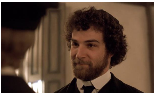
Figura 23. Yentl (1983) – excerto 3