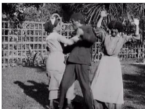
Figura 11. A Florida Enchantment (1914) – excerto 5