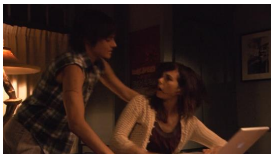
Figura 56. The L Word (2004-2009) – excerto 4