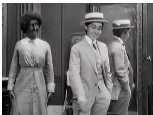
Figura 13. A Florida Enchantment (1914) – excerto 6

Nas figuras 9, 10, 11 e 12, a empregada de Lillian, apresentando agora características masculinas, corre para agredir um homem. A mulher que está com este homem foge quando ‘o’ vê.