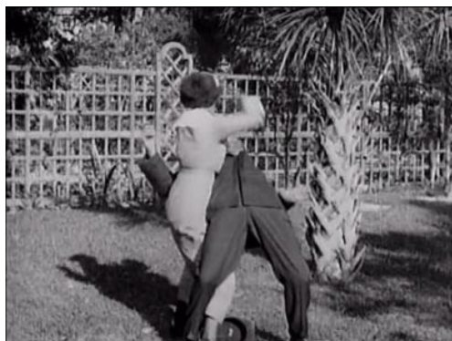
Figura 12. A Florida Enchantment (1914) – excerto 5

Nas figuras 9, 10, 11 e 12, a empregada de Lillian, apresentando agora características masculinas, corre para agredir um homem. A mulher que está com este homem foge quando ‘o’ vê.