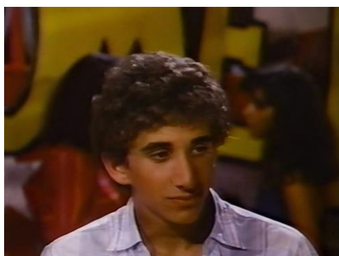
Figura 37. Something Special (Willy/Milly) (1986) – excerto 3