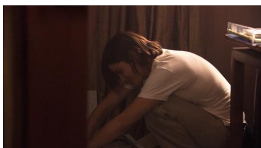
Figura 50. The L Word (2004-2009) – excerto 3