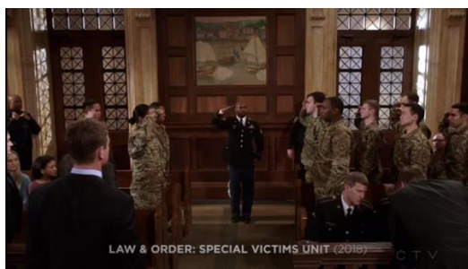
Figura 2. Jim Preston, militar - Law & Order: Special Victims Unit (1999-)

Na figura 1, Chaz interpreta Gary K. Longstreet, que trabalha na caixa de um estabelecimento comercial, coloca um boné vermelho com o slogan “MAKE AMERICA GREAT AGAIN” na cabeça enquanto ouve um discurso do ex-presidente dos Estados Unidos da América, Donald Trump.