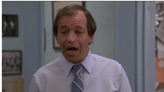
Figura 29. Just One Of The Guys (1985) – excerto 3

No segundo excerto, como mostram as figuras 27 e 28, Terry discute com o companheiro de residência.