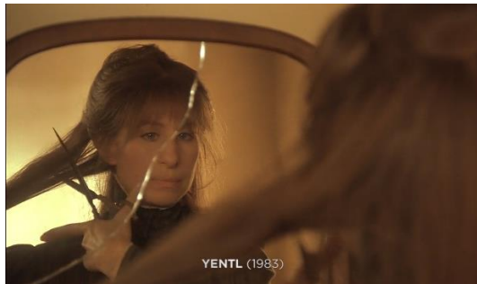
Figura 15. Yentl (1983) – excerto 1

De seguida analisaremos excertos do filme Yentl (1983).