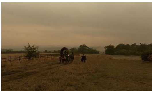
Figura 19. Yentl (1983) – excerto 2