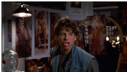
Figura 27. Just One Of The Guys (1985) – excerto 2