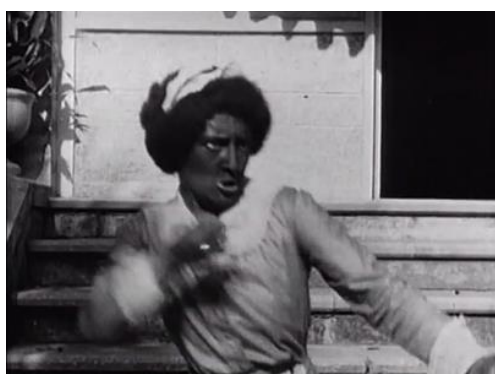
Figura 10. A Florida Enchantment (1914) – excerto 5