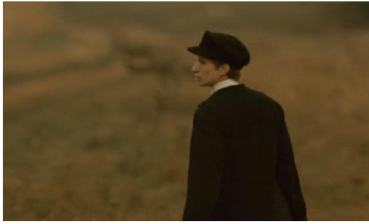
Figura 16. Yentl (1983) – excerto 2