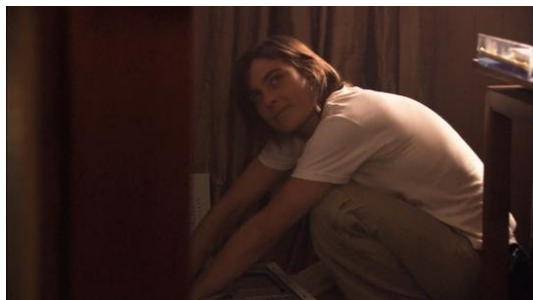
Figura 52. The L Word (2004-2009) – excerto 3

O facto de Max ser uma pessoa FTM 26 e, quando comparado à personagem Shane que, apesar de não estar no mesmo nível dele, também apresenta características butch .