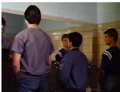
Figura 33. Something Special (Willy/Milly) (1986) – excerto 1

Nas figuras 31, 32 e 33, Milly, que assume o nome de Willy enquanto homem, entra na casa de banho dos homens.