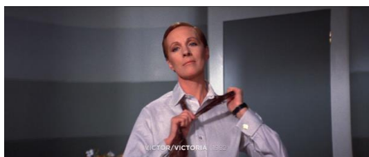
Figura 44. Victor/Victoria (1982)

Na figura 42, Yentl despe a camisa revelando as mamas. O homem da figura 43 fica perplexo.