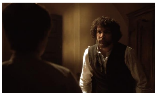
Figura 43. Yentl (1983)

Na figura 42, Yentl despe a camisa revelando as mamas. O homem da figura 43 fica perplexo.