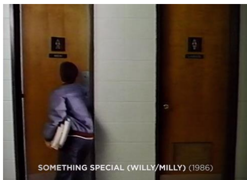
Figura 31. Something Special (Willy/Milly) (1986) – excerto 1