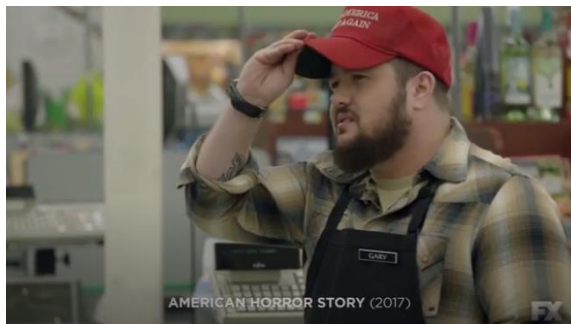
Figura 1. Gary K. Longstreet, operador de caixa - American Horror Story (2011-)

Entre estas falas é-nos mostrada uma cena de cada uma das séries American Horror Story (2011-) e Law & Order: Special Victims Unit (1999-). Cada cena pertence a um episódio que conta com um ator trans, Chaz Bono em American Horror Story e Marquise Vilsón em Law & Order: Special Victims Unit .