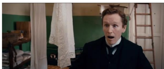
Figura 41. Albert Nobbs (2011)

Na figura 40, um 'suposto' homem exhibe as mamas e revela ser uma mulher. O homem da figura 41 fica chocado com o que vê.