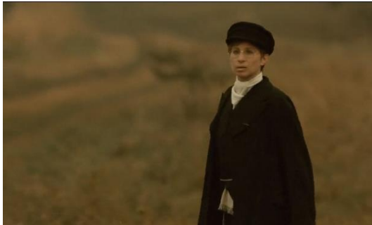
Figura 17. Yentl (1983) – excerto 2