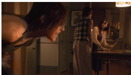
Figura 53. The L Word (2004-2009) – excerto 4

O facto de Max ser uma pessoa FTM 26 e, quando comparado à personagem Shane que, apesar de não estar no mesmo nível dele, também apresenta características butch .