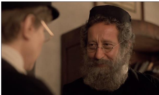
Figura 22. Yentl (1983) – excerto 3