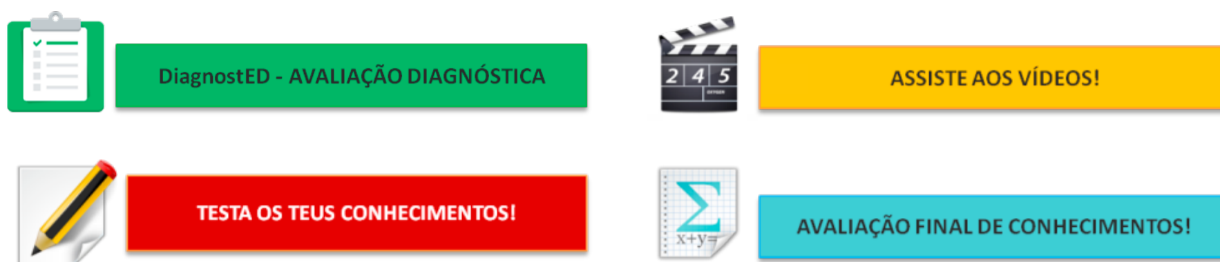
Figura 3: Imagens dos Separadores/Marcadores das subsecções