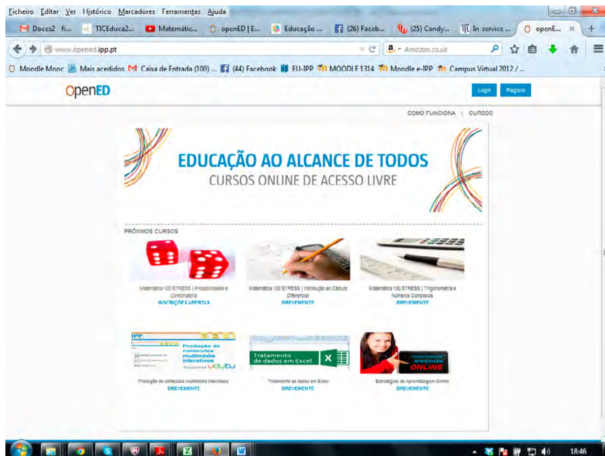
Figura 1: Screen Shot de http://www.opened.ipp.pt/ (5/6/2014)

Na imagem que seguidamente apresentamos (Figura 2) pode ver-se a descrição sucinta do funcionamento dos cursos da OpenED. Como “uma imagem vale mais do que mil palavras”, abstermo-nos de mais qualquer exposição que certamente se revelaria repetitiva.