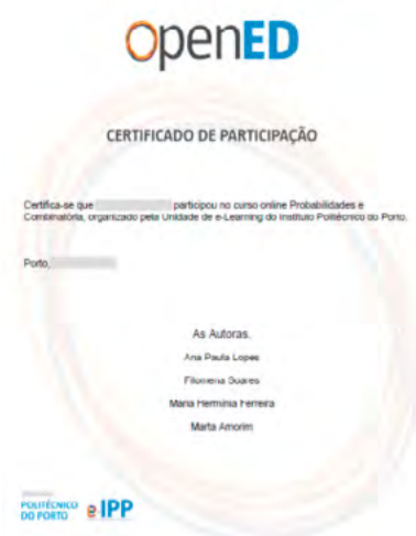
Figura 7: Exemplo de Certificado de Participação

acompanhamento dado por um sistema de learning analytics que não foi possível até ao momento.