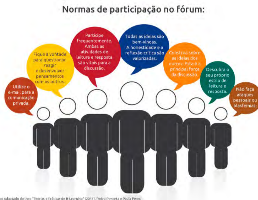
Figura 6: Normas de participação no fórum (adaptado de (Peres & Pimenta, 2011))

De acordo com o formato do curso, e perante as restrições que sentimos, este fórum funcionará, neste momento, como um fórum de discussão entre participantes. No entanto, e para estimular a sua utilização, existirá sempre uma interação com a equipa que desenvolveu o curso. Esperamos que os utilizadores tirem partido deste recurso, colocando as suas questões, sentindo-se à vontade para a abertura de novos temas de discussão.