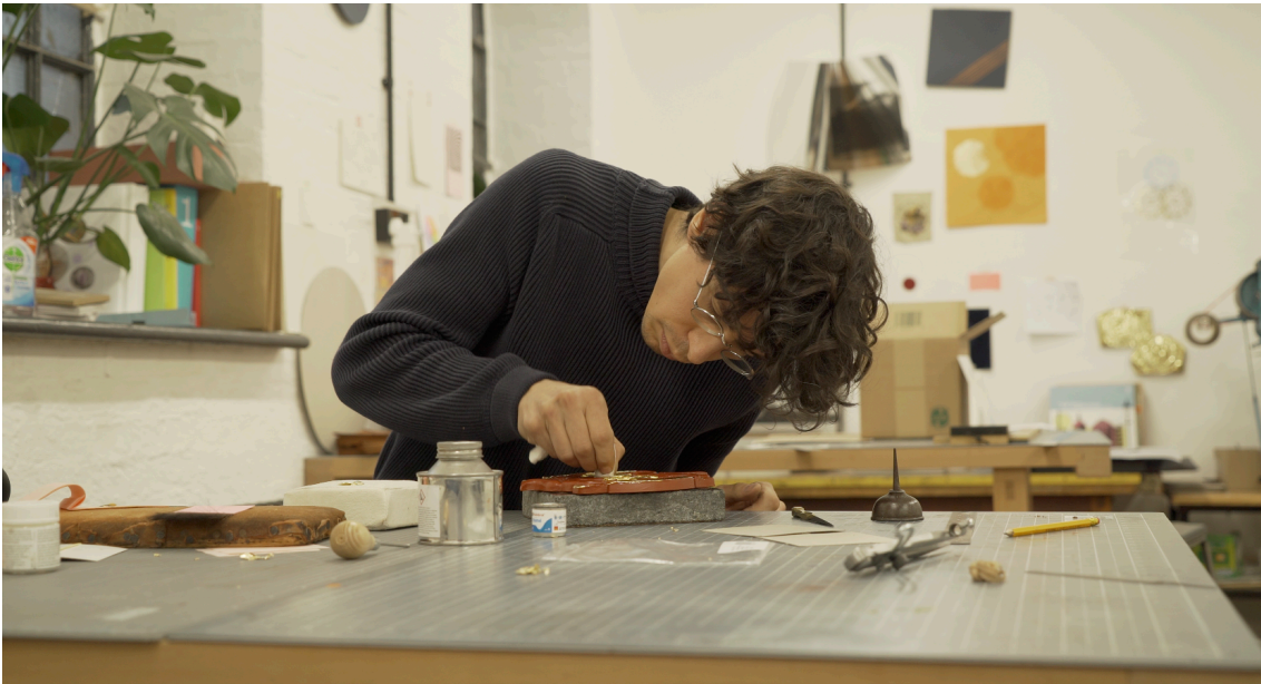
Figura 1 e 2 - Trabalho produzido pelos artistas residentes no Atelier

Durante o período da tarde fazia a edição dos mesmos, onde por não haver muito tempo e este tipo de vídeos ser um tanto “descartável”, o processo de color grading e edição de som era um pouco mais básicos. Por norma, tinha também de fazer a legendagem dos vídeos e cortá-los para que coubessem nas diferentes plataformas digitais, normalmente em ratios de: