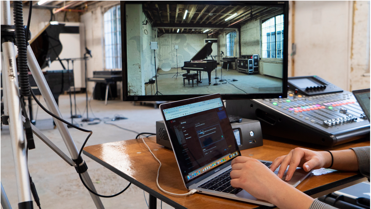
Figura 4 - Preparação para uma filmagem de performance - Live at the Factory