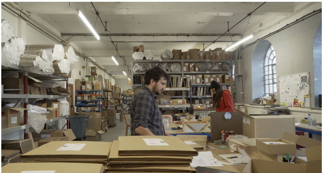
Figura 3 - Membros da equipa da state51 no espaço da Warehouse

- na Warehouse, ilustrada na Figura 3, onde 3 ou 4 pessoas trabalham normalmente com as encomendas que recebemos na loja online, Greedbag. De manhã tratavam de organizar todos os pedidos do dia, e na parte da tarde, o processo de embalagem e distribuição dos mesmos. Por vezes estes vídeos eram feitos através de um timelapse, com uma GOPRO que era colocada no armazém e filmava durante 30 a 60 minutos. A altura de Novembro e início de Dezembro, foi a mais interessante de captar, devido ao grande número de pedidos por causa da época de Natal.