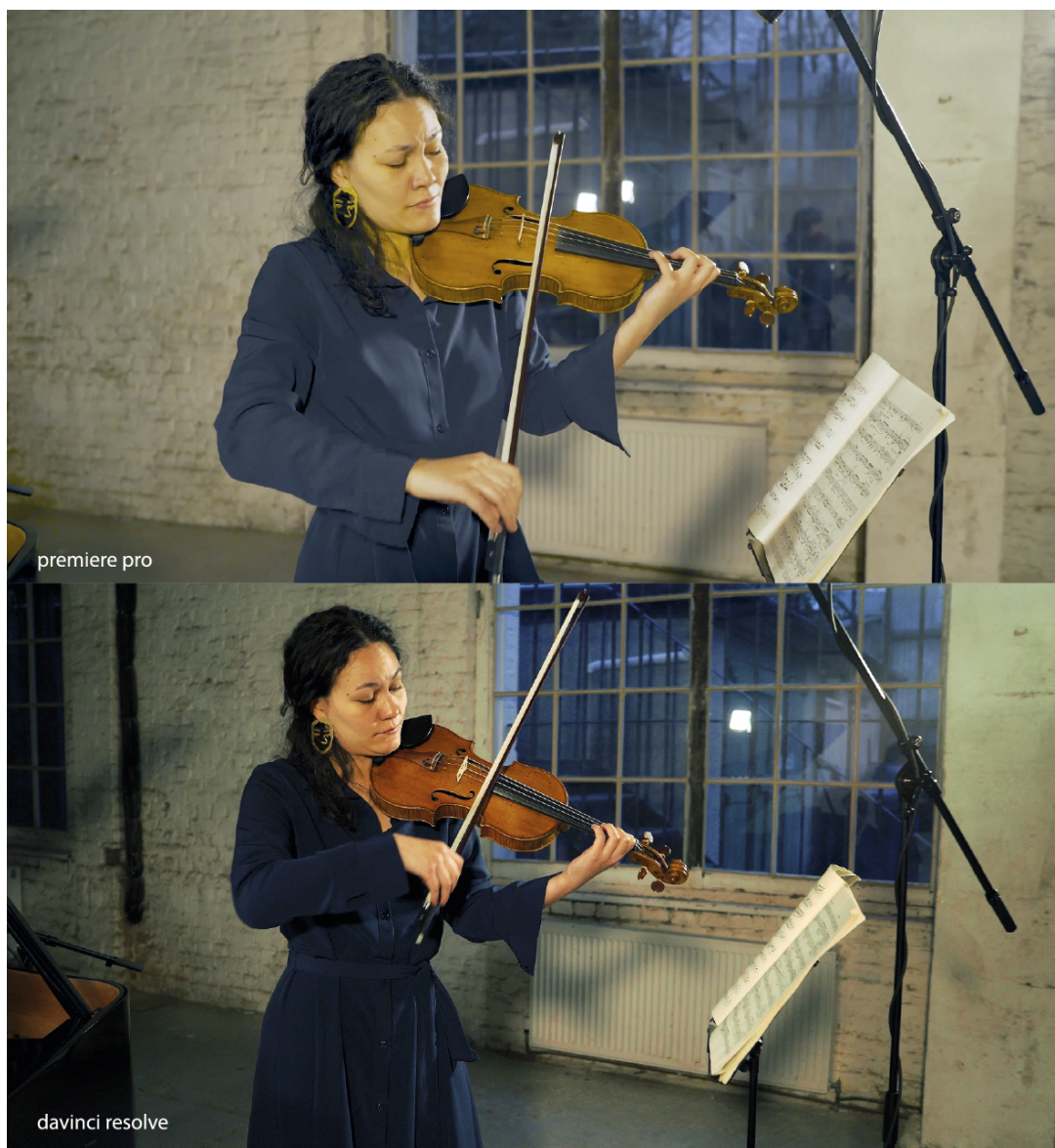
Figura 7 - Evolução do Color Grading. Antes, com Premiere Pro e depois, com DaVinci Resolve.

Depois do visionamento de vários vídeos tutoriais, e de um workshop dado pela Blackmagic Design e organizado pela BFI Film Academy “Introduction to editing with DaVinci Resolve”, senti uma grande diferença no look final. Como comprova a figura 7, melhorei os básicos conhecimentos que tinha, não só na luz e cor, mas também no trabalho dos tons de pele, redução de ruído.