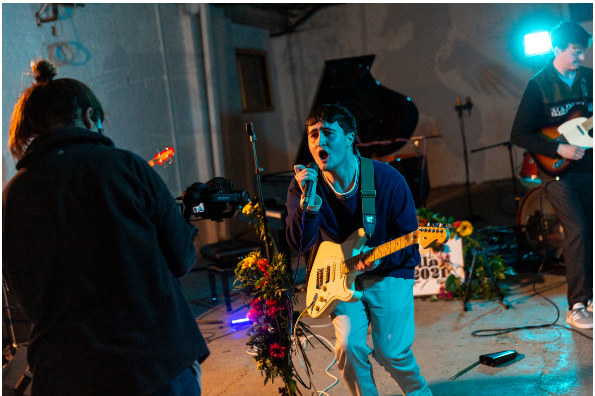
Figuras 5 e 6 - Imagens de behind-the-scenes do evento Hello 2021 da DIY