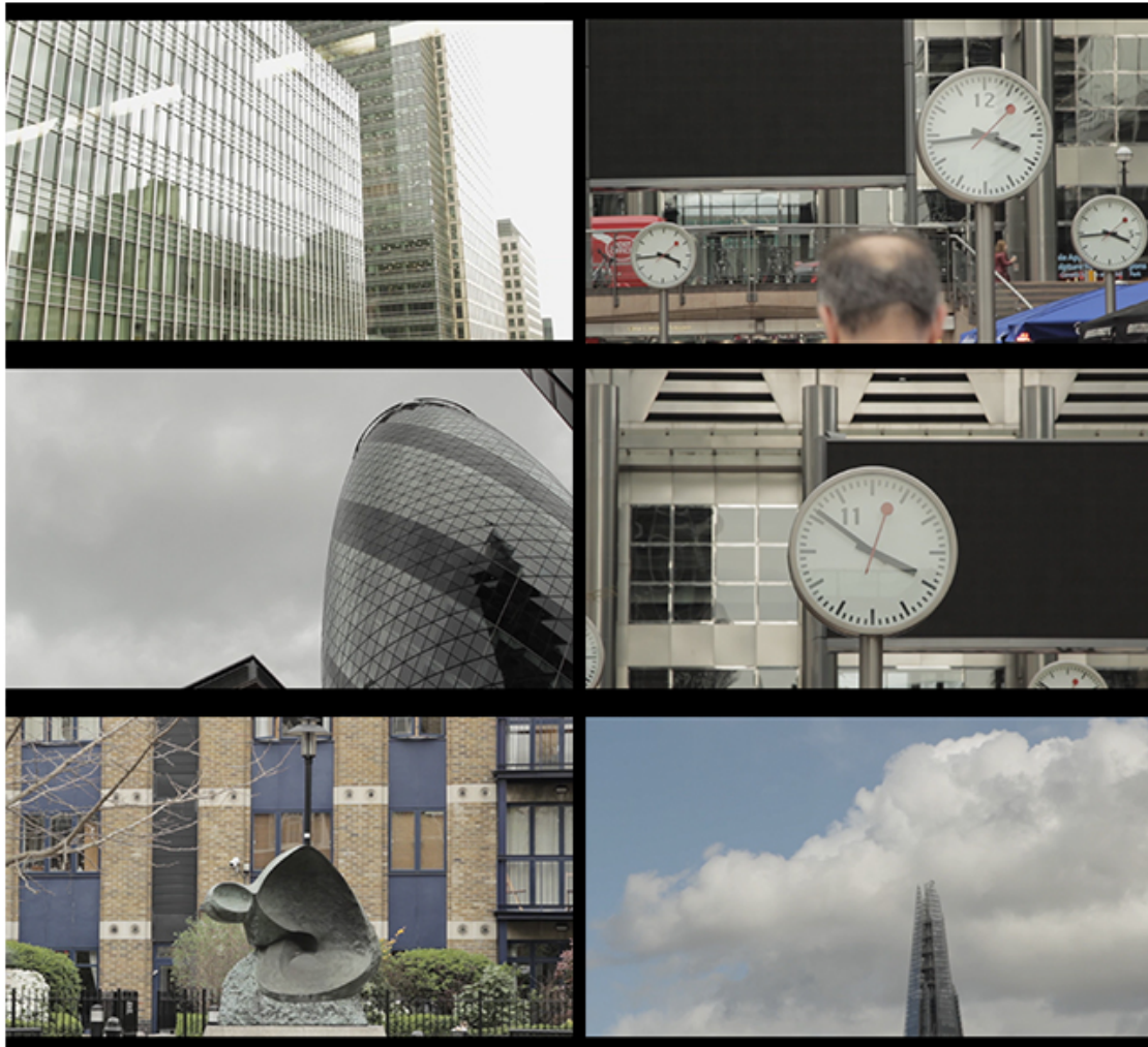
Imagens 1.1 a 1.6 (Esquerda para a direita, cima para baixo) – Frames do filme Message

peçoas a dormir na rua, um aumento de 23% em relação ao ano anterior. 29 As razões para este fenómeno são várias, e em conversa com sociólogos e profissionais de instituições que apoiam os sem-abrigo, percebi que duas das principais são a pobreza e a instabilidade emocional. Vamos voltar à segunda razão mais tarde, focando-nos por agora na pobreza.