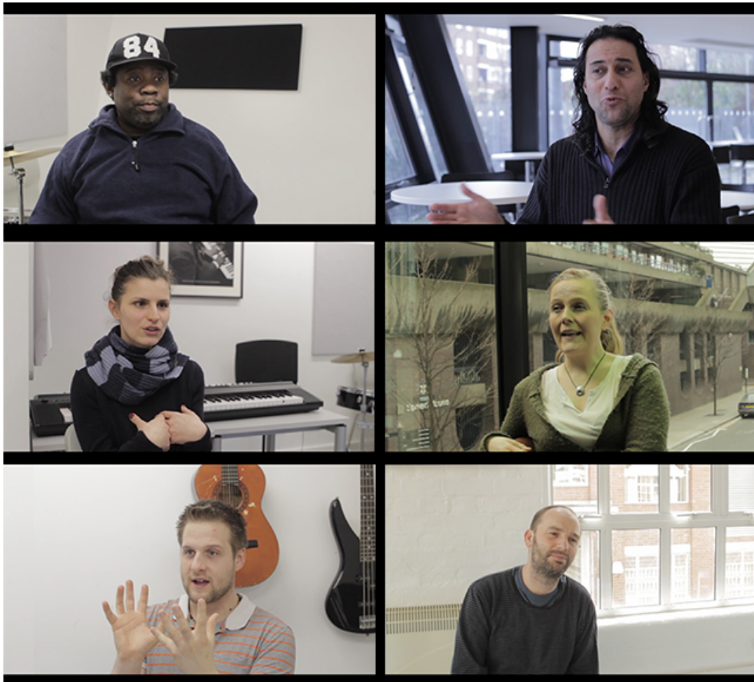
Imagens 3.1 a 3.6 (Esquerda para a direita, cima para baixo) – Frames do filme Message

Todas as entrevistas ocorrem em um de dois cenários, mostrando a dualidade que existe na vida de muitos dos participantes do projecto: Ou em frente a uma parede (Imagens 3.1, 3.3 e 3.5), transmitindo um sentimento de clausura, estrada sem saída e falta de esperança, acentuado pela presença de um objecto negro no plano; ou em frente a uma janela (Imagens 3.2, 3.4 e 3.6), simbolizando a abertura de horizontes, as possibilidades que o mundo contem, em suma, uma mensagem de esperança.