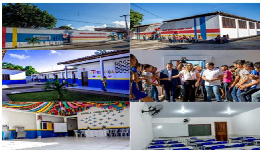
Figura 2: Cenas da reinauguração da Escola A

de ética reproduzir tal fotografia de reinauguração da escola lugar de nossa investigação: