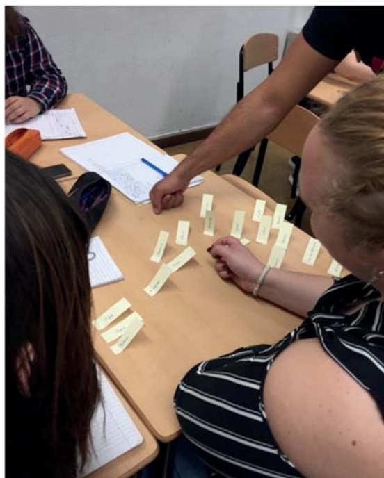
Figura 3 – Selección geográfica de palabras

informe de 2016 del Instituto Cervantes” y explicación con ejemplos de lo que es el registro informal o familiar.