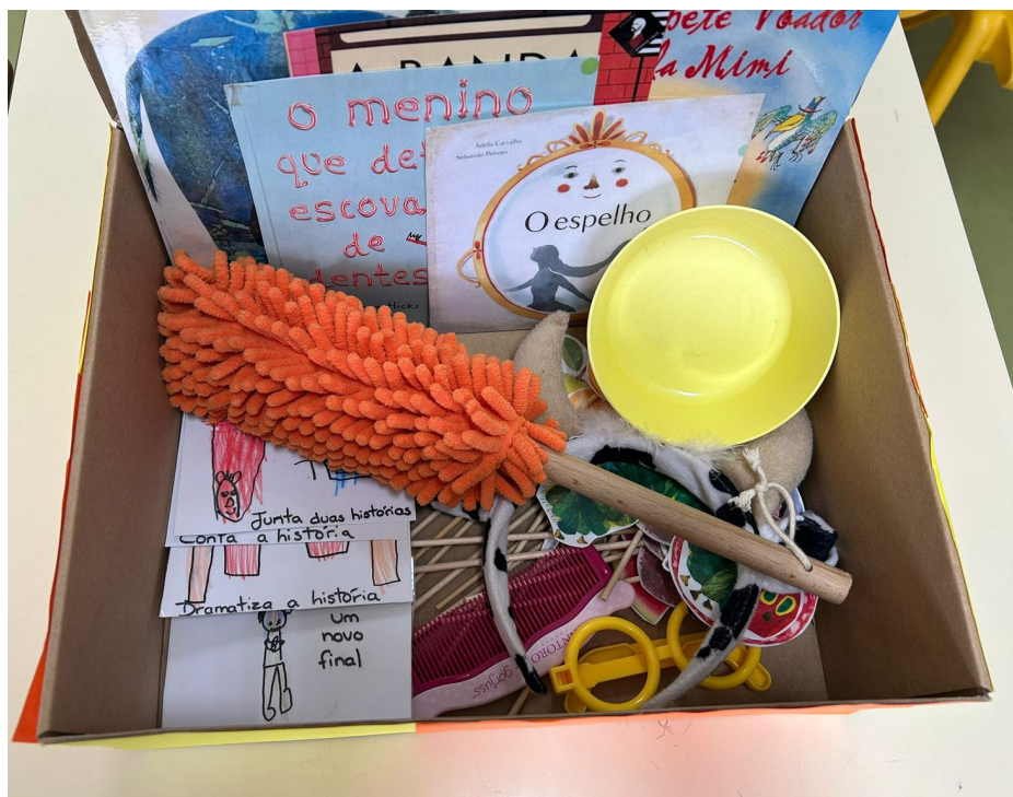
Baú de histórias