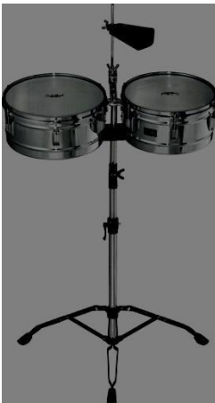
Figura 3. O Timbale.

A configuração dos timbales e conjunto de tambores foi desenvolvida no início da segunda metade do século XX, quando bandas cubanas, influenciados pelo jazz norte-americano, começaram a combinar o som de instrumentos de percussão com o som da bateria. Mais tarde, a criação de Songo (um ritmo criado no final de 1960) fez com que a bateria se tornasse uma parte permanente da música popular cubana moderna. Mas foi no início de 1990 com o aparecimento de um género musical chamado timba, que, progressivamente, mais bateristas (tocando música popular cubana) adicionaram os timbales à sua bateria. A combinação de conjunto de tambores e timbales ganhou muita popularidade durante esse período, e é hoje considerada uma configuração padrão para bateristas que tocam música popular cubana. Os timbales também são usados em situações em que uma só pessoa tem que tocar mais do que um instrumento de percussão, ao mesmo tempo. A configuração básica para um percussionista poderia ser um par de congas e um par de timbales, tocando congas com uma mão e timbales com a outra. Por vezes são adicionados pedais a esta configuração, permitindo ao percussionista imitar secções de percussão completas (Oscar van Dillen,1958) A figura 3 ilustra um Timbale.