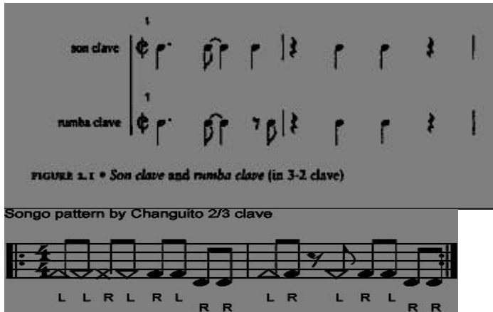
Figura 5. Ritmo Songo.

Bembe - Este ritmo 6/8 é tipicamente tocado em congas, shekere e campana.