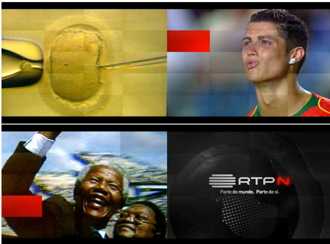
Imagem 07 – Filme de Identidade “RTPN – Parte do mundo. Parte de si.”

Este filme de identidade foi produzido com base em imagens de arquivo de actualidade pertinente, que abriam caminho para as metáforas persentes no texto. O texto, que reforça uma dualidade foi lido alternadamente por uma voz masculina e outra feminina, enaltecendo este contraponto narrativo. Ao nível gráfico definiu-se uma grelha de 20 rectângulos ao longo de todo o ecrã como reforço da divisão entre a parte e o todo. Esta grelha foi a matriz para toda a criação gráfica e audiovisual desta identidade, como falarei mais à frente. Aqui já se podia perceber parte do código de cores utilizado, assim como parte da tipografia. Durante este filme, alguns deste rectângulos vão sendo “acendidos” com o vermelho escolhido, enaltecendo um ou outro pormenor da música ou do texto. Neste filme é também possível de perceber a assinatura musical escolhida para a emissão e a importância que o tratamento de áudio terá daqui para a frente.