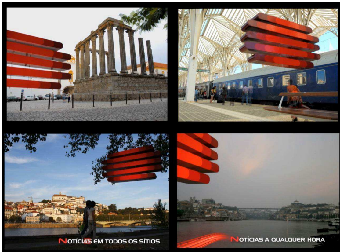
Imagem 05 – Campanha de Identidade “RTPN, n de notícias”

Era urgente levar a RTPN para todo o país, e fazer com que ela fosse entendida como nacional. Daí, foram desenhados dois filmes (anexos 05 e 06), que consistiam em pendurar um logótipo RTPN de 2 metros em locais de referência da maior parte das capitais de distrito em Portugal. Os filmes eram produzidos segundo a técnica de Stop-Motion, criando enquadramentos emblemáticos, contendo a marca RTPN em todos eles. Isto tinha uma dupla eficácia. Por um lado, o público em antena reconhecia facilmente a sua cidade pelo cenário e incluía conscientemente este habitar de uma nova marca que se manifestava; por outro, e como a produção ia deslocar-se a todos estes locais de rodagem, aproveitamos para levar uma equipa de marketing que explicava aos mais curiosos locais a marca RTPN. Este filmes mantiveram-se em antena por cerca de um ano e meio, sendo estruturais para a consolidação da marca e identidade em antena.