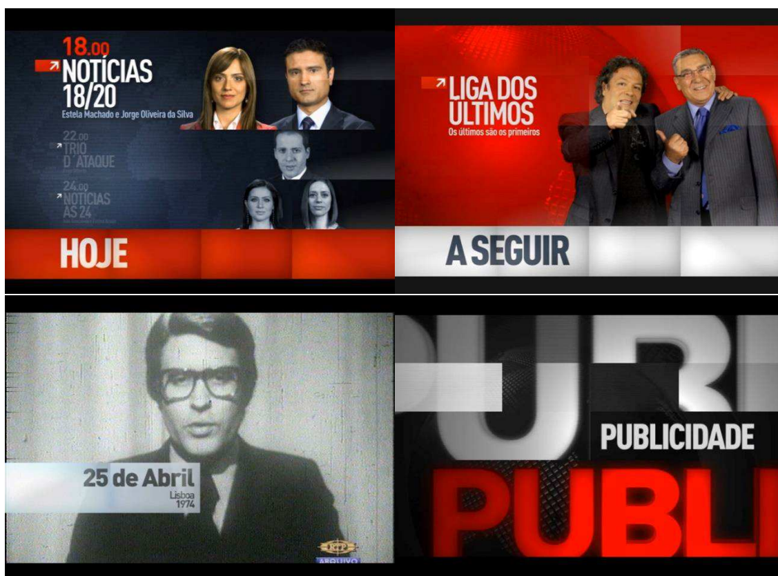
Imagem 08 – Diversos exemplos de Breakfillers de Autopromoção

A identidade gráfica de todos estes filmes resultou num conceito unificado, em que a grelha de 20 rectângulos subjacente em todos os conteúdos permitia que cada informação tivesse o seu local próprio para acontecer no ecrã. Isto facilitou todo o processo de memorização de informação adicional, sobretudo ao nível das referências temporais. A aproximação visual destes rectângulos, a sua função e a sua dinâmica gráfica foram inspiradas pelos painéis de informação – flipboards – presentes em aeroportos ou em estações de metro. O público está mais do que habituado a prestar atenção a estes locais onde a informação é muito concreta e pertinente, capaz de ser assimilada rapidamente.