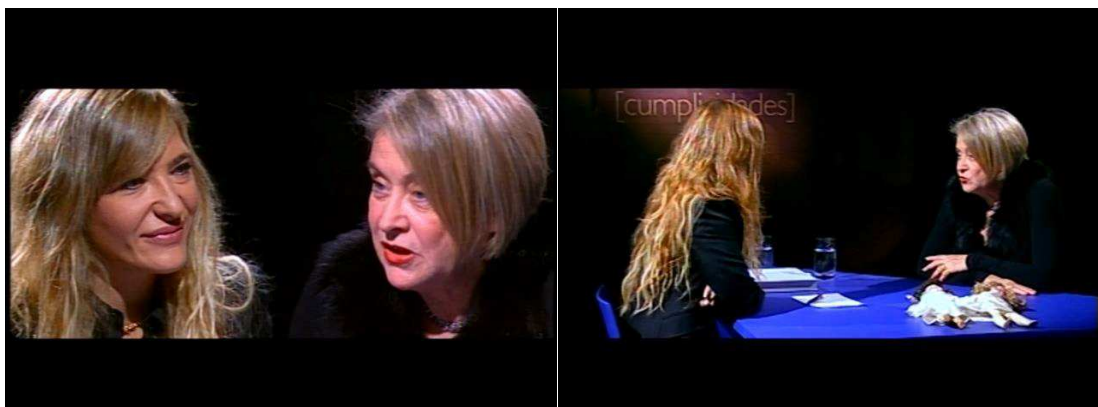
Imagem 01 – Programa “Cumplimentos”

Em 2003, a RTP adquire a NTV na sua totalidade, assim como integra nos seus quadros alguns dos seus profissionais, comigo incluído. Nasce a RTPN. Nesta fase de transição entre filosofias de Produção Media, sou destacado como realizador de conteúdos de entretenimento, agora inserido em equipas de realização e produção da RTP. Realizo programas culturais (anexo 01), talkshows e Grandes Reportagens.