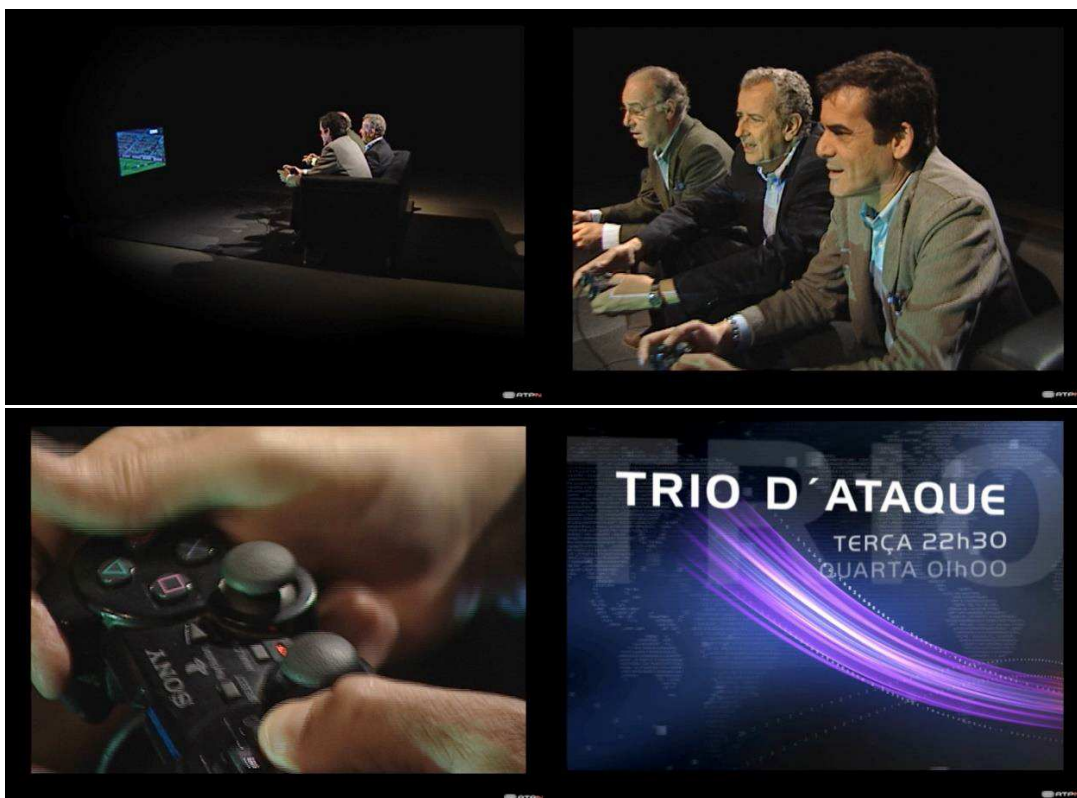
Imagem 03 – Autopromoção “Trio D’Ataque”

pudesse enaltecer a paixão de cada um dos comentadores pelo seu próprio clube de futebol. Na altura, o jogo Pro Evolution Soccer (para Sony Playstation ) estava muito em voga nas camadas jovens e era já um caso de sucesso com milhões de utilizadores em todo o mundo. Porque não criar um filme em que os 3 comentadores jogam compulsivamente, quais miúdos entusiasmados, este jogo de futebol para consola, comandando e defendendo cada qual a sua equipa, assim como o fazem semanalmente em estúdio, mas apenas com palavras? O slogan criado era chamativo: “Aqui no Trio D’Ataque, o jogo confunde-se com a realidade”, numa dupla analogia, o jogo de computador pelo jogo de futebol real e o jogo de futebol pela vida em si. Este slogan é dito pelo próprio apresentador/moderador do programa que aparece como fecho da autopromoção. Devo dizer que não foi fácil convencer as Direcções de Programas e os próprios intervenientes desta ideia, mas depois de produzida, ela foi muito bem aceite resultando numa melhoria da audiência média do programa. Interessante também o facto de as faixas etárias mais jovens e urbanas terem aderido mais a este programa, cujos pertenciam a uma faixa etária mais elevada.