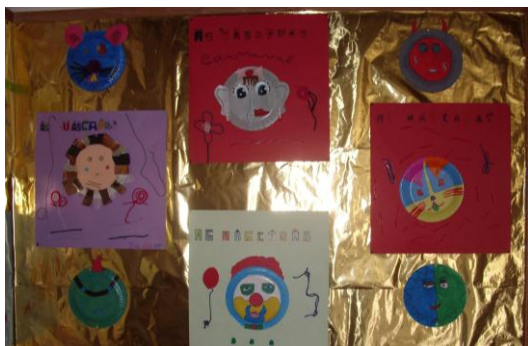
Figura 4 Exposição dos trabalhos.

Na disciplina de EV foi pedido inicialmente aos alunos que fizessem o estudo da letra para o cartaz. O estudo da letra para o cartaz foi feito a partir de papel quadriculado, com utilização de materiais de pintura. Realizaram também um estudo da letra, com recortes de jornais e revistas.