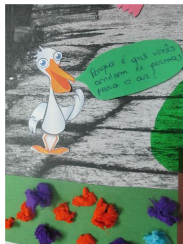
Figura 5 Pormenor de uma ilustração de um aluno.

De três fotos, os alunos escolhiam a fotografia que queriam como suporte. As fotografias de tamanho A3 eram coladas em cartão para se criar alguma resistência. Recorri à fotografia como base da composição. Uma dificuldade sentida que surge pela utilização de uma imagem que não tinha nenhuma ligação com o texto para ilustrar.