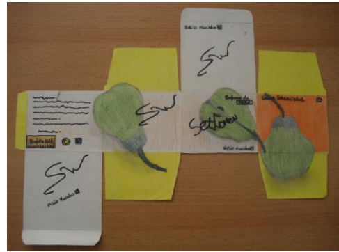
Figura 6 Ilustração de Embalagem.

A mensagem que passei aos alunos foi de que, teriam de criar a ilustração da embalagem estabelecendo uma ligação com o elemento representado. Foram colocadas algumas questões aos alunos através de uma ficha em que tinham de mencionar: o elemento natural escolhido, para que serviria a embalagem, a quem se poderia destinar, o nome do produto. Estas questões foram colocadas antes dos alunos começarem a criar a ilustração da embalagem, para que desta forma se criasse um fio condutor entre o elemento representado, e a embalagem. A estratégia de questionamento como salientam Vieira e Vieira, promove a o desenvolvimento de competências como as capacidades de pensamento crítico. (Vieira & Vieira, 2005)