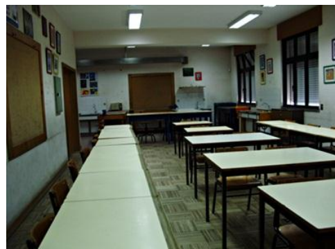
Figura 1 Interior da sala de Aula do 5ºano da Escola Marques Leitão.

A sala de aula (fig.1) de Educação Visual e de Educação Tecnológica, situa-se no primeiro piso. A sala de grandes dimensões e com luz natural, tem quatro janelas para o exterior. Está equipada com vinte e duas mesas e vinte e cinco lugares sentados. Existe também ao dispor dos alunos, mesas/bancadas, para a realização de trabalhos tecnológicos. No interior da sala existe uma mufla, um