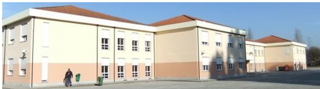
Figura 2 Escola Básica e Secundária do Levante da Maia.

A nível social nota-se as transformações que estão associadas à vinda de novos residentes, um modo de vida urbano, ligado a vivências fora do território em questão, contraria o passado assente numa cultura de vizinhança e proximidade.