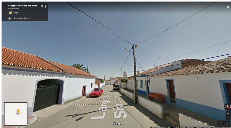
Figura 1 Detalhe da aldeia de Cumeada ilustrando os candeeiros existentes antes da substituição por LED de 4000 K. Ver texto para explicação.

Constatou-se também que toda a aldeia está iluminada, desde zonas residenciais até caminhos de acesso entre a estrada EN255 e as entradas da aldeia (Figura 2). O troço da estrada EN255 entre as duas rotundas que limitam, a Norte e Sul, a aldeia de Cumeada está também iluminado com luminárias instaladas em postes no lado Oeste da estrada.