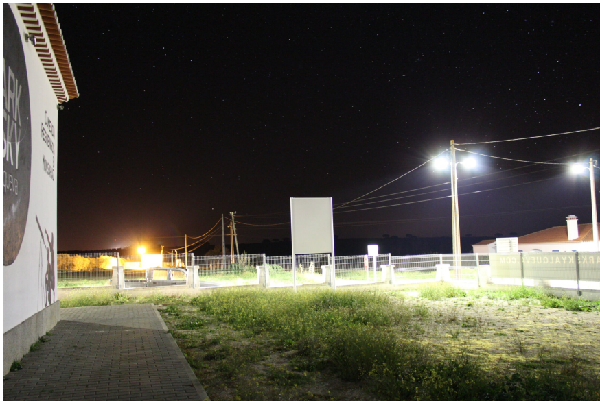
Figura 3 Vista do interior do terreno do Observatório para Sul. A perturbação da iluminação pública é notória e incompatível com um observatório astronómico.