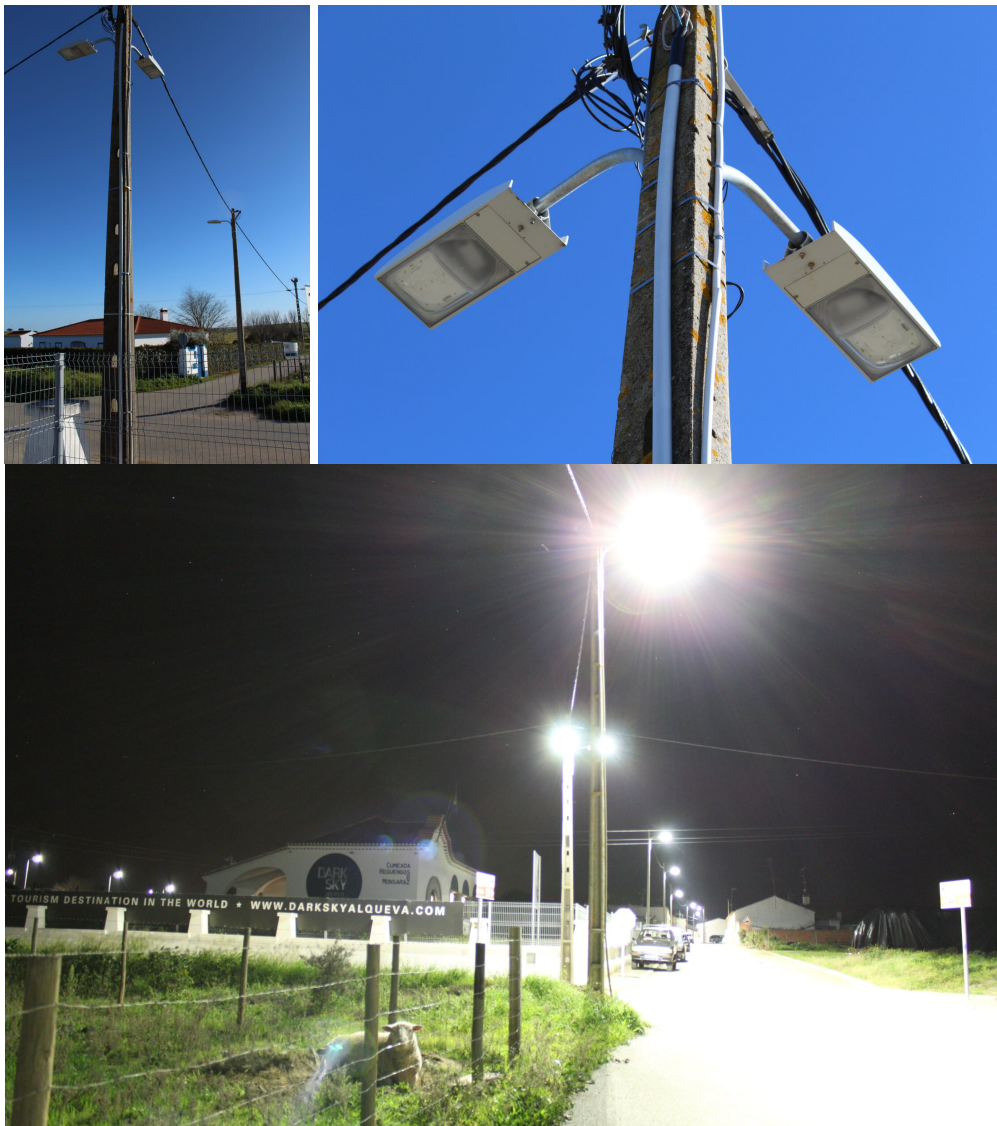
Figura 4 Luminárias LED de 4000 K instaladas no cruzamento que confina com o Observatório Astronómico.