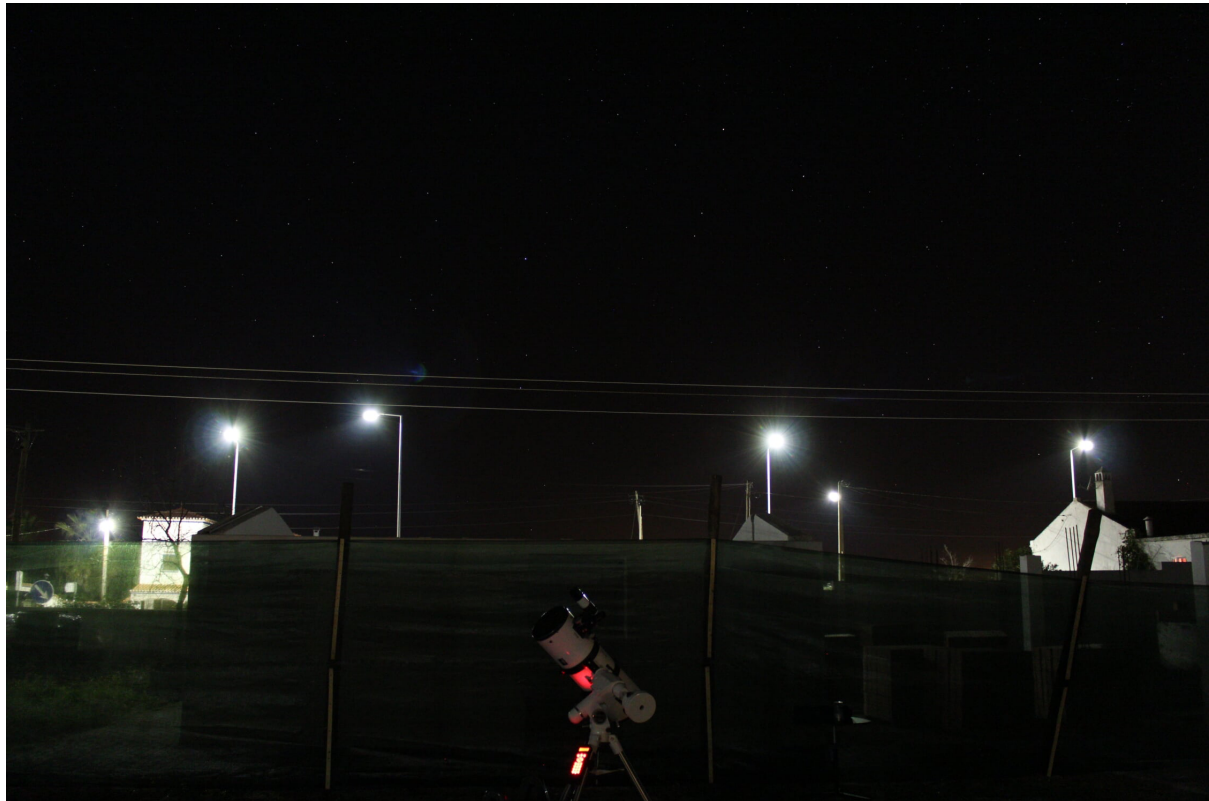
Figura 5 Traseiras da sede da Reserva Dark Sky® Alqueva, junto ao local do Observatório. Constata-se a forte perturbação dos candeeiros que iluminam a estrada EN255, cuja altura faz com que incida luz directa nos observadores e telescópios.

Apesar de nesta primeira visita não se ter procedido à medição da iluminância, conforme acima referido, a inspeção visual permitiu constatar que a iluminação actual é excessiva, não permitindo a adaptação do olho a condições escotópicas nem, possivelmente, mesópicas. Como consequência, no interior da aldeia não é possível observar senão os astros mais brilhantes, resultado sobretudo de encandeamento, não surgindo o céu muito distinto daquele que pode ser observado numa cidade com forte poluição luminosa. Próximo de alguns candeeiros, a iluminação é tão intensa que nem as estrelas mais brilhantes conseguem observar-se. Este facto deve-se não só à altura dos postes (ver discussão adiante, secção 4) mas também ao tipo de iluminação e fluxo luminoso utilizados, suficientes para uma significativa redução do diâmetro pupilar do olho e limitando a entrada de luz dos objectos mais ténues, tornando-os invisíveis à vista desarmada.