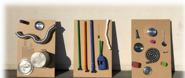
Figura 2: Recurso elaborado para a Atividade de Dinamização do Espaço Exterior

Para tal, utilizaram-se vários materiais, com a finalidade de os mesmos produzirem sons diferentes e serem utilizados de diversas formas, como tubos pvc com diâmetros diferentes, garrafas de detergente, tachos e panelas, latas e pratos de alumínio, guizos e tubos de plástico, que poderiam funcionar como um reco-reco, balões, três placas MDF, três cavaletes, cordão, braçadeiras, tintas e pinceis. Deste modo, após a construção desta parede sonora cada par pedagógico com o seu grupo de crianças explorou o mesmo, bem como, os seus sons no espaço exterior. Neste seguimento, as educadoras estagiárias explicaram, inicialmente, em que consistia a parede sonora (Figura 2), explicitando que os vários materiais utilizados, que as crianças foram identificando, produziram sons diferentes e poderiam ser utilizados de forma diferente, possibilitando, de seguida, a exploração livre, por parte das crianças, do recurso construído, pelo que surgiram comentários, tais como, "L.F. que disse que podiam falar pelos tubos [referindo-se aos tubos de pvc] e que eles produziam sons diferentes" (DF, 7 de janeiro de 2021), "O R.P. afirmou que existia, na parede sonora, uma guitarra e tambores" (DF, 7 de janeiro de 2021) e "O T.F. disse que podiam puxar pelo tubo branco, porque ele encolhia e esticava" (DF, 7 de janeiro de 2021).