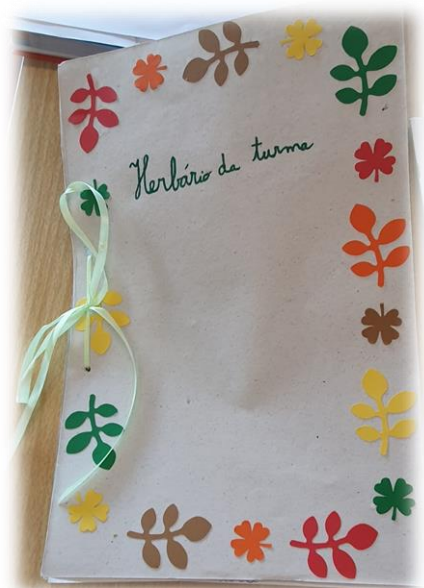
Figura 4: Capa do Herbário elaborado pela Turma

Ao longo da PES, deu-se continuidade a um projeto do agrupamento iniciado no ano letivo anterior, que foi interrompido devido à situação pandémica vivenciada, sendo esse o projeto "Ouvintes Sortudos", que tinha como principal objetivo a promoção da fluência da leitura das crianças da turma. Assim, todas as quartas-feiras era introduzido um texto, devendo o mesmo ser abordado e trabalhado na quinta e na sexta-feira. Durante o fim-de-semana, os alunos deveriam proceder à leitura do mesmo aos seus familiares, preenchendo-se uma grelha, apresentada na segunda-feira seguinte, com o nome do ouvinte, a duração da leitura e um comentário com a avaliação da mesma.