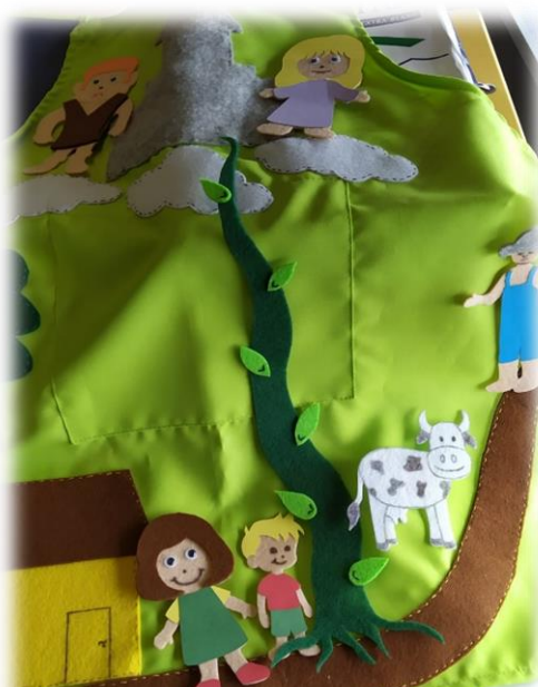
Figura 3: Recurso elaborado para a Leitura do Conto "O João e o Pé de Feijão"